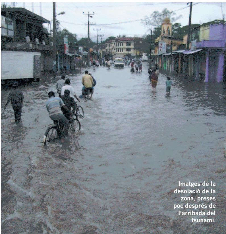
Imatges de la desolació de la zona, preses poc després de l'arribada del tsunami.