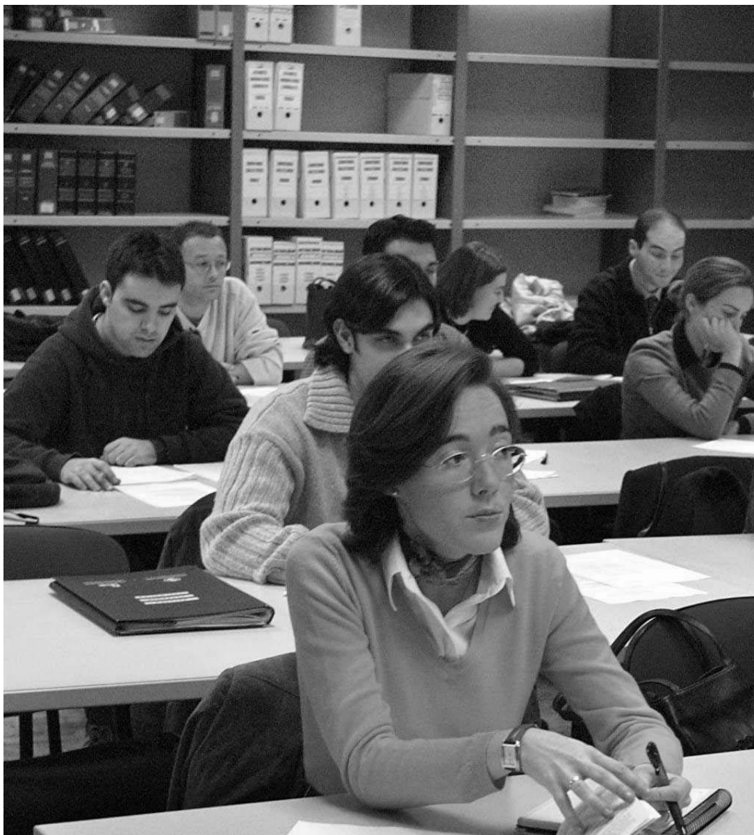
Estudiants durant una classe en una aula de la Universitat de València.

La taxa d'abandó és una altra dada a tindre en compte. La mitjana de la Universitat se situa en l'11%. Mentre que en Ciències de l'Activitat Física i l'Esport és de l'1,1% i en Odontologia de l'1,4%, en Geografia arriba al 31,4% i en Filologia Francesa al 28,6%.