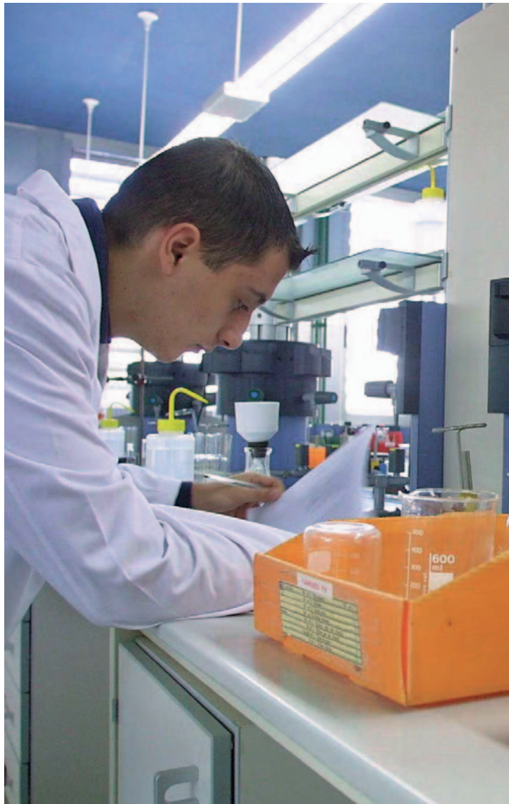
Un jove investiga en un laboratori de la Universitat.

El comunicat continua: "Joves Investigadors estem cinc anys demanant a les administracions que financen programes de formació d'investigadors que dignifiquen la tasca dels investigadors en fase inicial, tot oferint contractes. Per això considerem que la nova convocatòria de la Universitat de València representa un significatiu avanç contra la precarietat laboral dels investigadors en fase inicial. No obstant això, considerem important recordar que la nostra reivindicació continua sent el sistema 0+4, és a dir contracte laboral des de l'inici de la carrera investigadora".