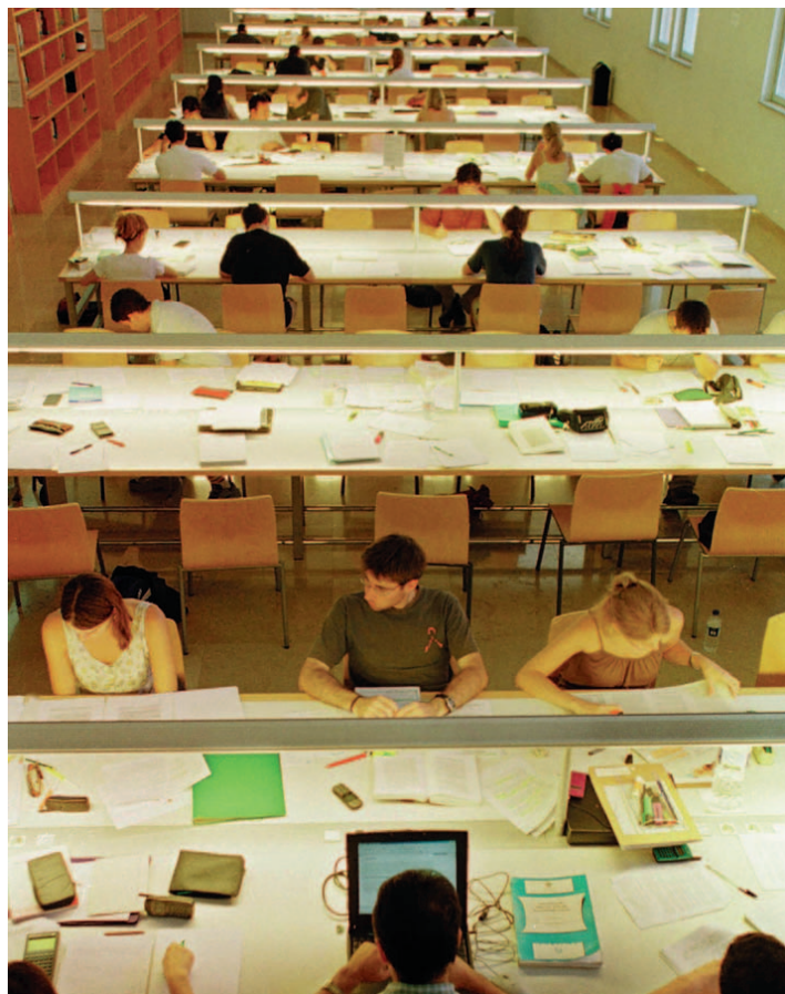
universitària o qualsevol altre document que els acredite com a membres de la Universitat de València.