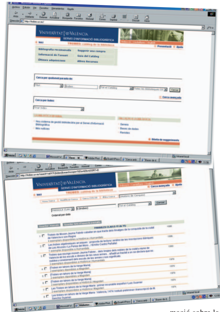
Algunes de les pàgines de recerca bibliogràfica de la web trobes.uv.es

Amb aquest nou programa informàtic es gestiona el préstec de tota classe de documents a tota la comunitat universitària. Anualment es gestionen més de tres-cents cinquanta mil préstecs de documents a professors, estudiants i personal d'administració i serveis, a més d'altres usuaris externs que utilitzen els serveis de la Universitat.