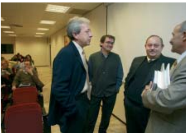
Dalt, estudiants davant els fullets informatius sobre Europa. Davall, els organitzadors de la jornada.