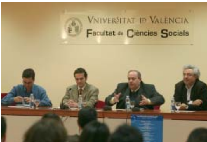
Un moment de la inauguració del cicle.