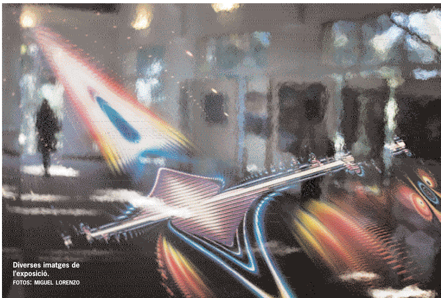
Diverses imatges de l'exposició.