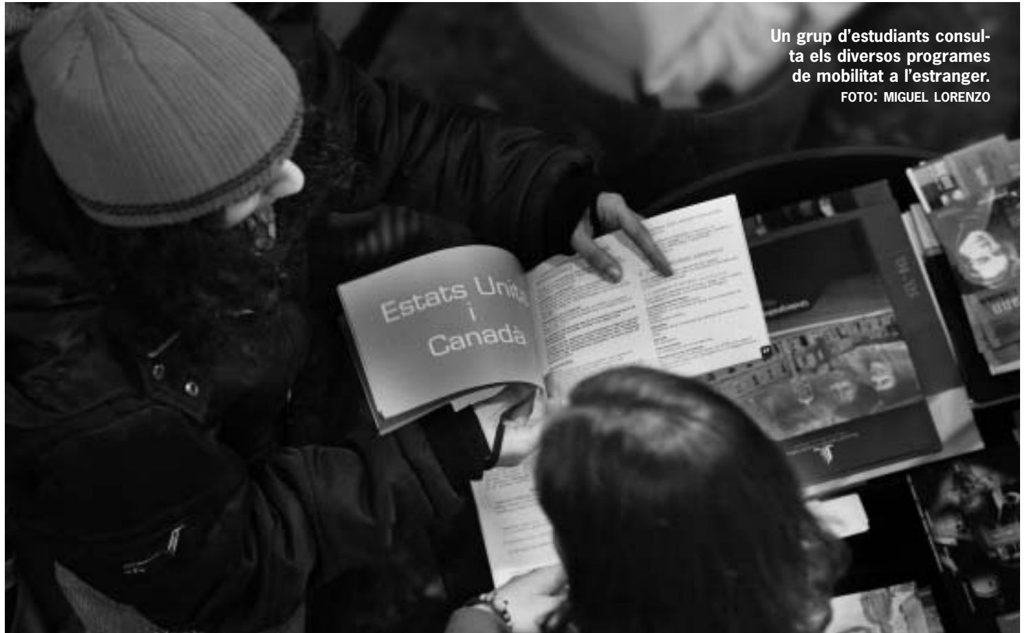
Un grup d'estudiants consulta els diversos programes de mobilitat a l'estranger.