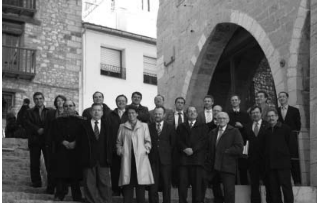
Els rectors de les universitats que conformen la Xarxa Joan Lluís Vives, la passada setmana a Morella.

Morella es va convertir durant un dia en la seu de les universitats de l'Institut perquè va ser allí on fa deu anys –el 28 d'octubre del 1994– es va signar la constitució de l'Institut. En l'acte van