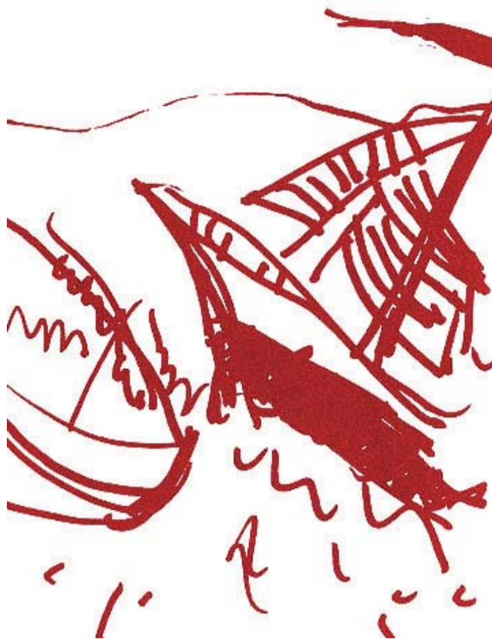
Una de les il·lustracions del llibre. Davall, la portada.