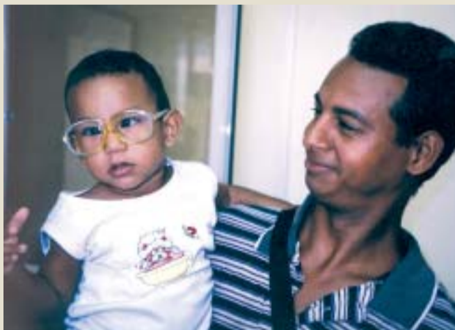
Un xiquet tractat en el Centre Òptic de Santiago de Cuba.

Les cinc universitats públiques valencianes s'uneixen en el CUVRIC per a fer un esforç conjunt a l'hora d'impulsar programes de cooperació internacional i d'afrontar els nous reptes que planteja l'ajuda a països en vies de desenvolupament.