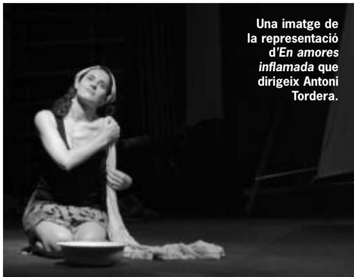
Una imatge de la representació d' En amores inflamada que dirigeix Antoni Tordera.