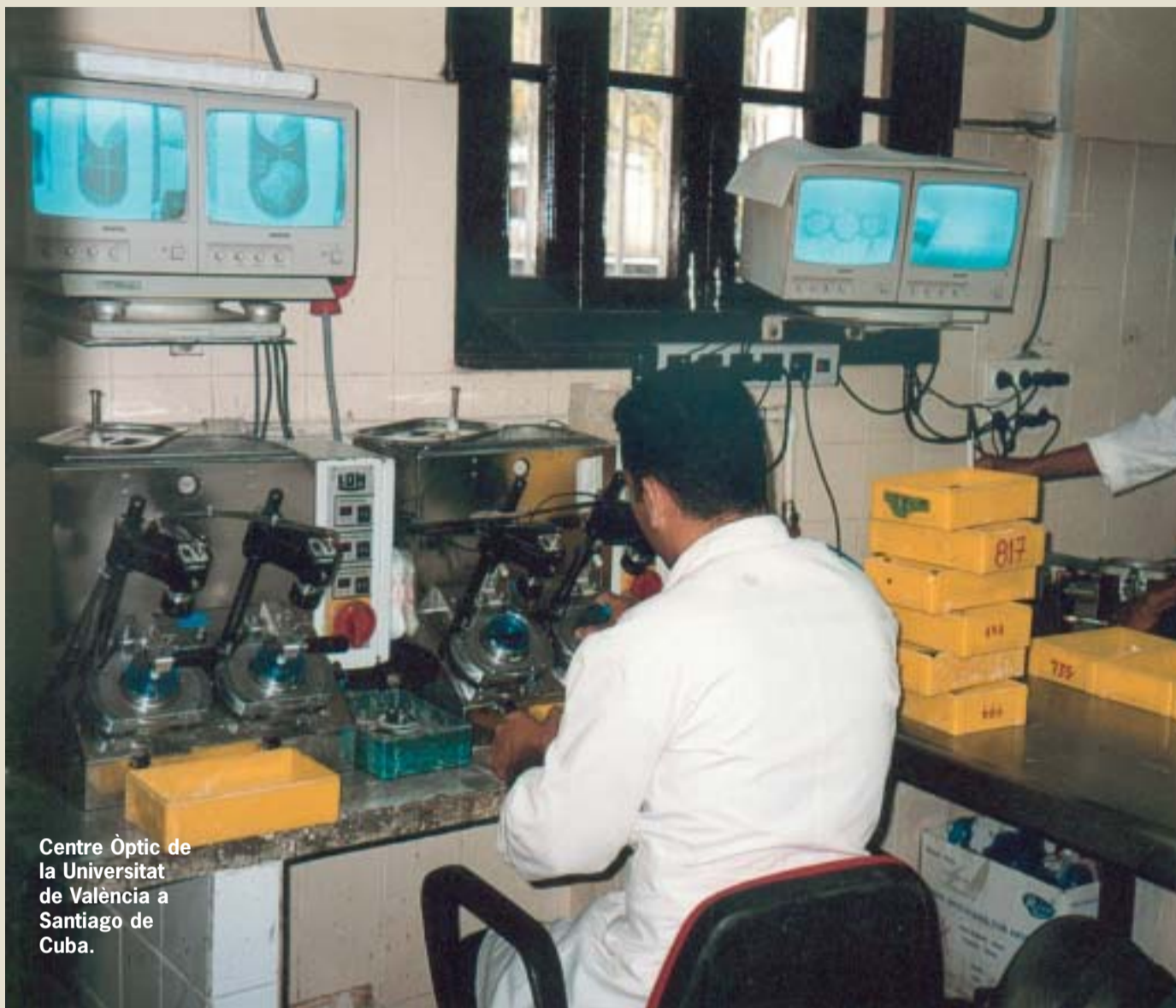
Centre Òptic de la Universitat de València a Santiago de Cuba.