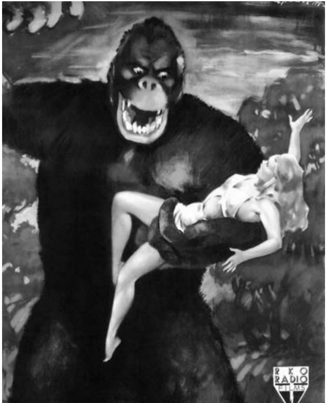
Imatge d'un cartell de la pel·lícula King Kong, del 1933.

Orientat a estudiants de totes les disciplines, el curs ha analitzat els conceptes físics en correspondència amb els continguts de les matèries de ciències de secundària –velocitat i acceleració, força, lleis de Newton...–, fent assequible la física a tothom. Usant enunciats cridaners, com ara Guia per a viatgers del temps , Somnia Frankenstein amb ovelles elèctriques? , o De Superman a Batman: ídols amb peu de fang , el curs ha servit per analitzar els principis físics que regeixen l'univers i ha posat a prova la versemblança dels arguments de les pel·lícules, novel·les i còmics del gènere. De Superman a Batman , per posar-ne un exemple, "ha fet una anàlisi crítica dels poders dels superherois, donant peu a introduir elements de cinemàtica, la part de la física que s'ocupa de la descripció del moviment dels cossos", puntualitzen Moreno i José. D'aquesta manera s'ha arribat a examinar el suposat potencial dels artilugis que utilitza Batman, o a qüestionar les habilitats de Spiderman heretades