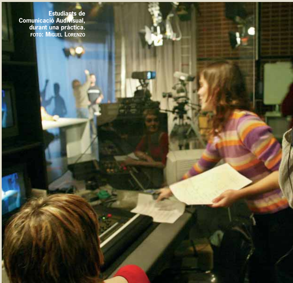
Estudiants de Comunicació Audiovisual, durant una pràctica.

seua part Lorena Lorca, es- de segon de Turisme, co- a que "ens han remarcat allò oneixim: saber idiomes és erò en la carrera no es do- lts coneixements per a do- na altra llengua... T'has de a vida tu".