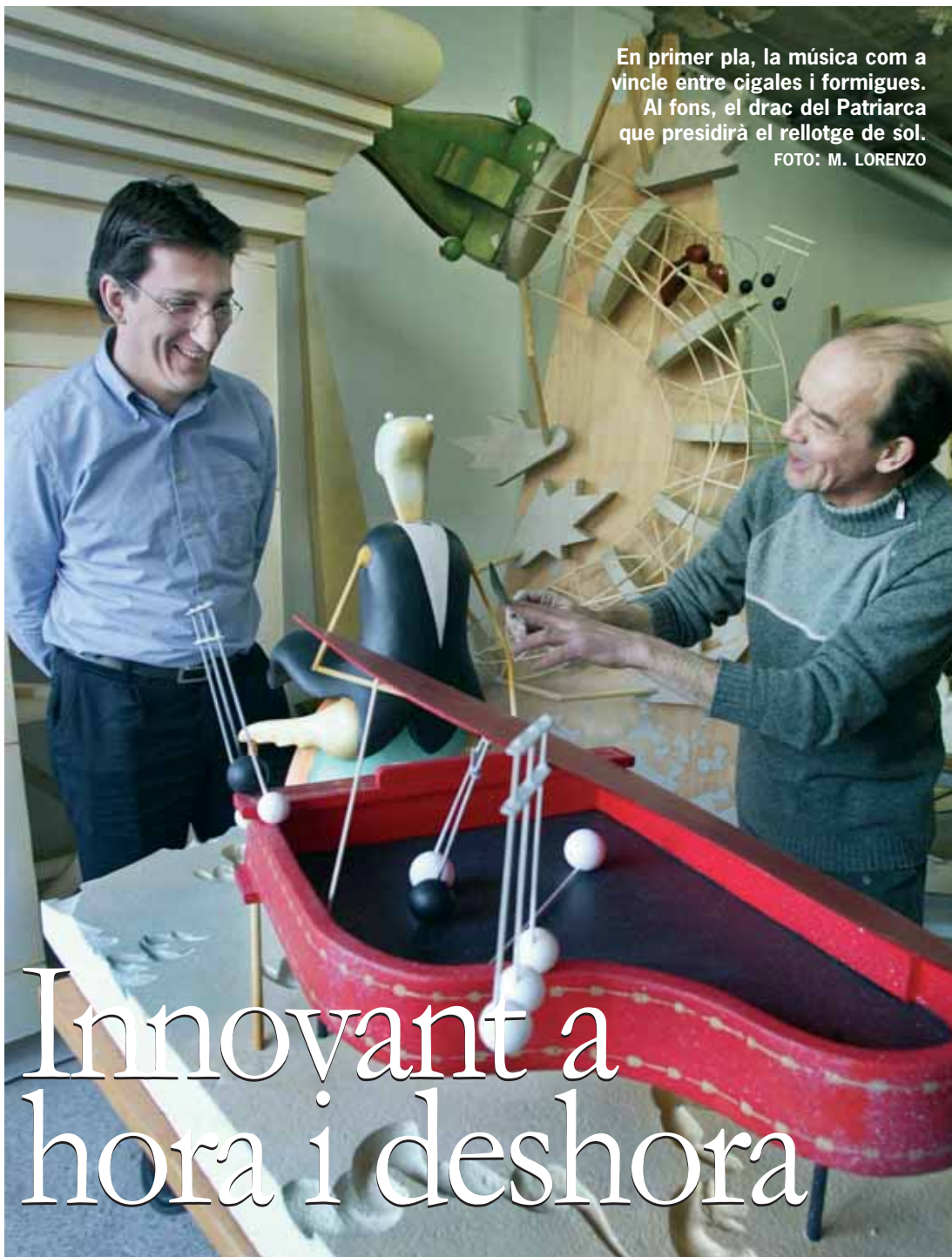
En primer pla, la música com a vincle entre cigales i formigues. Al fons, el drac del Patriarca que presidirà el rellotge de sol.