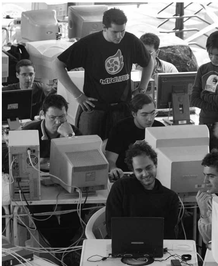
Imatge de l'anterior LinUV.