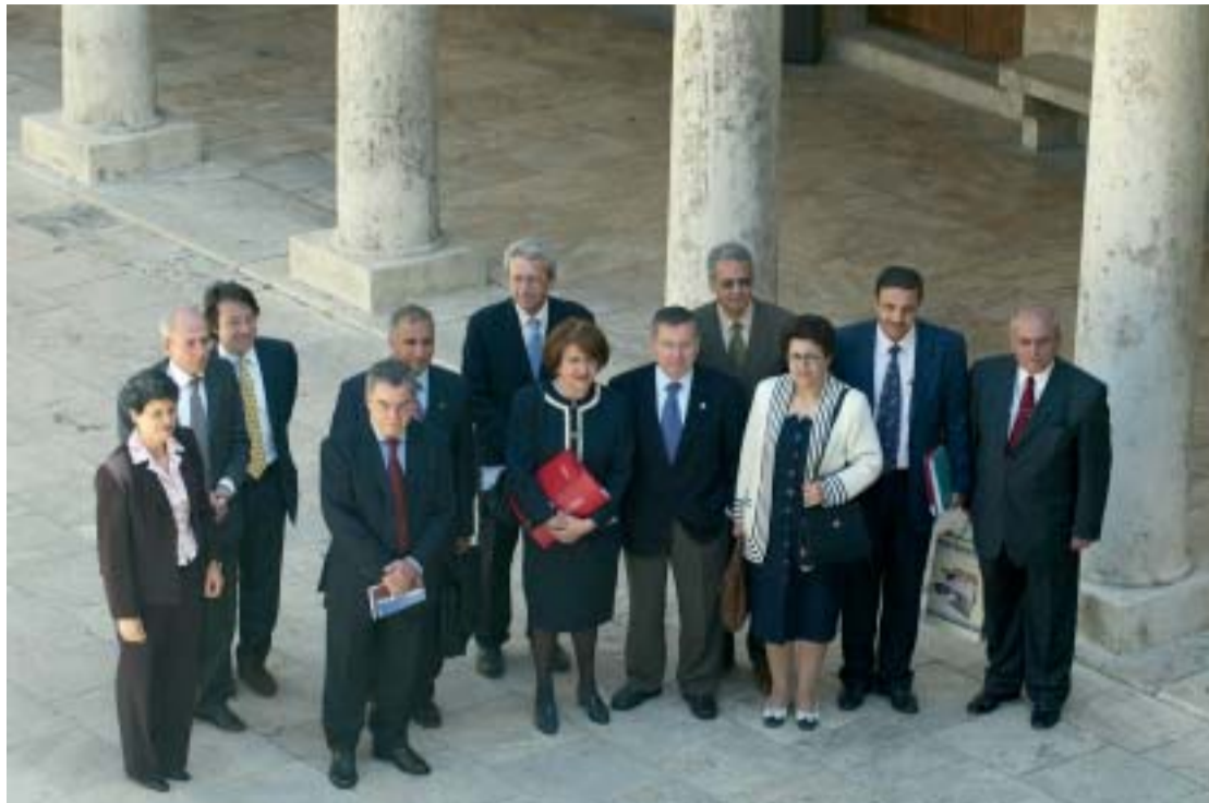
El rector de la Universitat i el degà d'Economia amb els representants de les altres universitats de la Mediterrània.

El projecte Tempus/Meda: Femmes, Travail et Formation està finançat per la Unió Europea amb 530.000 euros i tindrà una durada de tres anys. La cooperació entre països de l'àrea mediterrània es concreta en la creació d'un Màster de Postgrau en