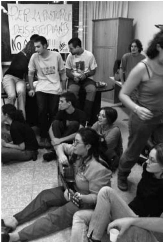
Imatge d'arxiu d'una protesta estudiantil.