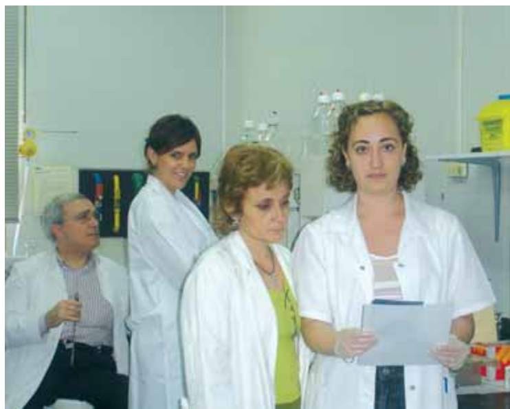
Components del grup d'investigació autors del treball.

El grup d'investigació sobre Patologia Molecular de Fongs de la Universitat de València ha aconseguit la caracterització molecular i funcional d'un nou gen essencial del fong patògen oportunista Candida albicans . El fong Candida albicans constitueix la tercera causa de mort per infecció hospitalària a països desenvolupats. De fet, Candida albicans és l'agent infecciós aïllat amb major freqüència a partir de pacients immunodeprimits (com a conseqüència, per exemple, d'una teràpia antitumoral o en transplantats sotmesos a tractament antirebuig) que han mort a causa d'una infecció fúngica. Estudis realitzats recentment als Estats Units han posat de manifest que aquest fong és, en l'actualitat, el microorganisme patògen aïllat en tercer lloc, pel que fa a la seua freqüència, a partir de sang, i que ha superat els bacteris bacil·lars Gram negatius quant a la seua incidència. Cal destacar també que Candida albicans és la tercera causa d'infeccions associades a l'ús de catèters amb la segona taxa més elevada de colonització versus infec-