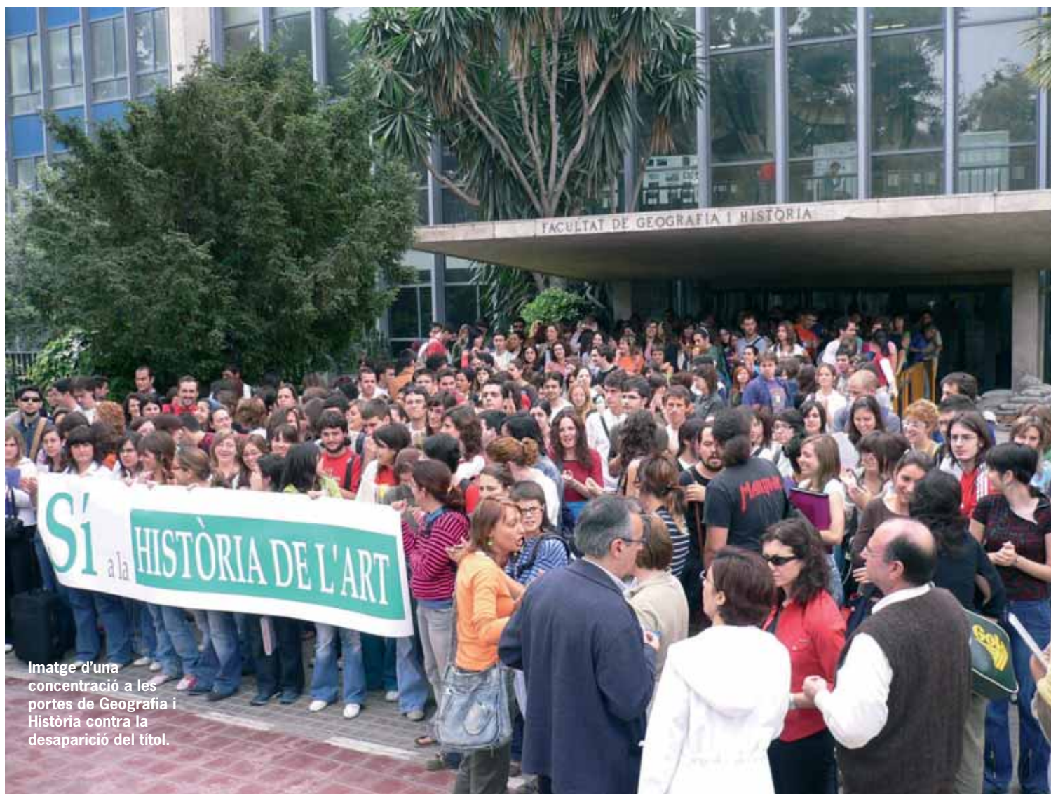
Imatge d'una concentració a les portes de Geografia i Història contra la desaparició del títol.