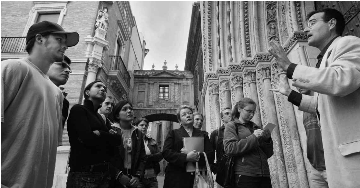
Un grup d'estudiants estrangers de valencià, durant una visita guiada pel centre històric de València.