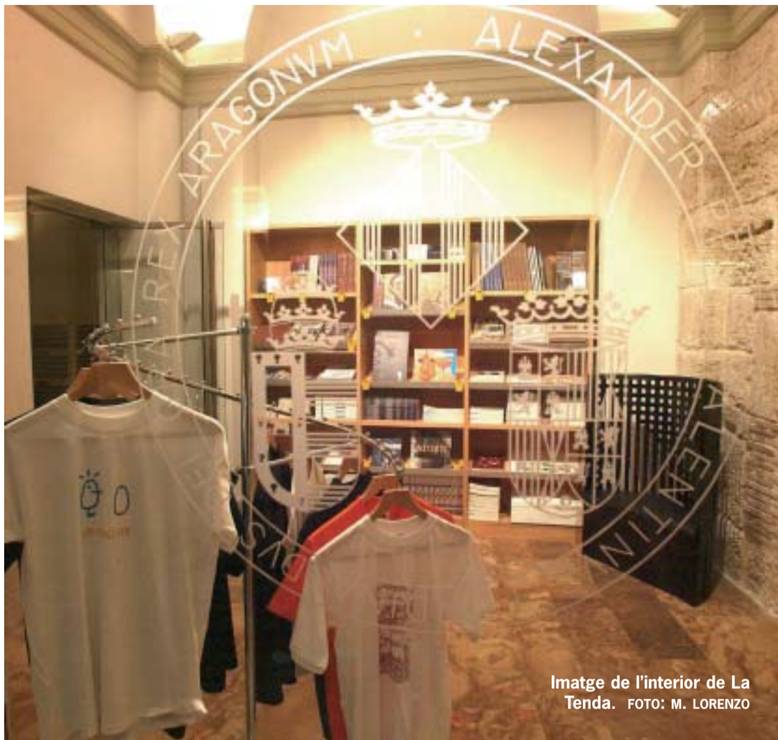
Imatge de l'interior de La Tenda.

La Tenda de la Universitat ha complit un any d'activitat i continua la seua tasca de difusió de la imatge de la institució acadèmica. Ho fa a través dels objectes més diversos. A més de la "samarreta" i el "llapis" que el seu logotip ens prometien, compta ja amb més de huit-centes referències de productes corporatius i merchandising .