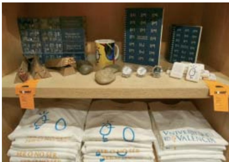
Alguns dels productes de La Tenda. Dalt, vista nocturna de la seua façana al carrer de la Nau.