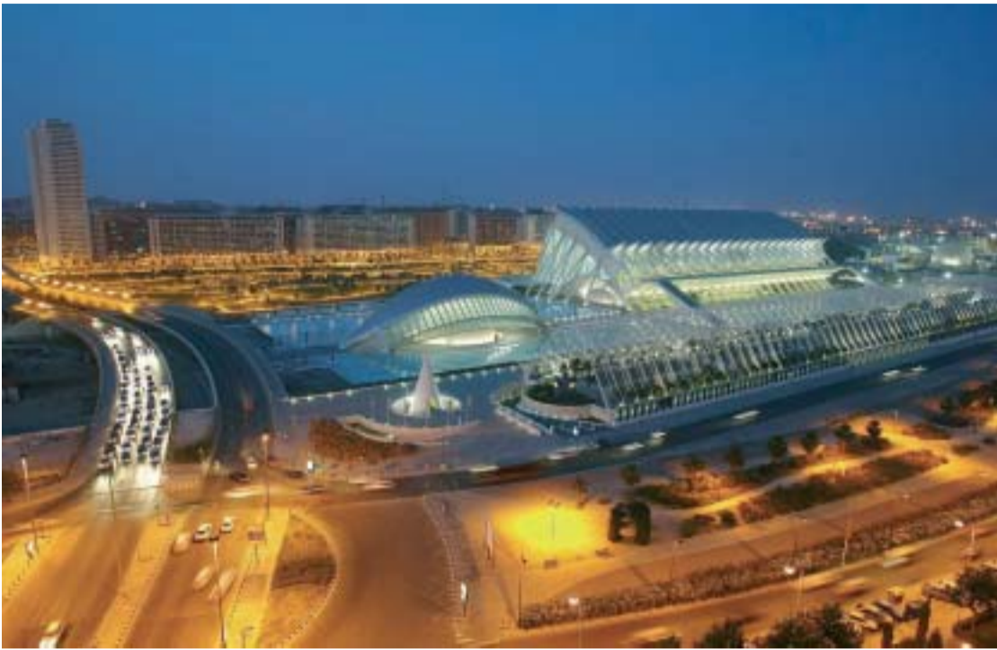
Imatge nocturna de l'entorn de la Ciutat de les Arts i les Ciències.