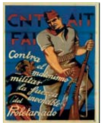
Cartell de Muro.