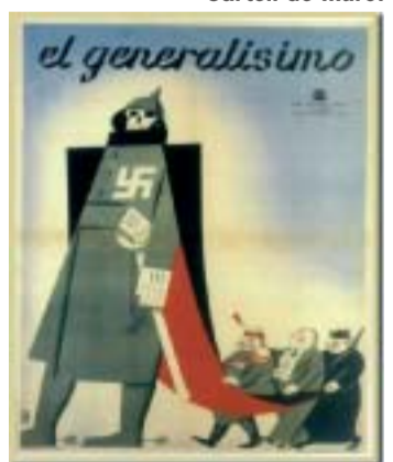
Cartell de Pedrero.