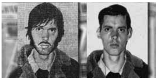
Fotogrames de les pel·lícules Síndrome laboral i La mort de ningú , dos dels films programats a L'Inquiet .