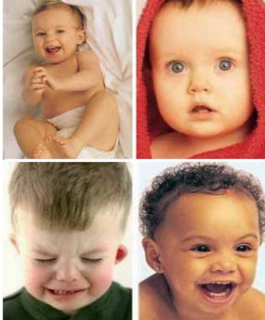
Imatges de la campanya Adopta el valencià .

Veu Pròpia ha presentat a València la seua campanya Adopta el valencià , l'objectiu de la qual és encoratjar els nous habitants del País Valencià i els nous parlants passius a adoptar el valencià com a llengua habitual en diversos espais de la seua vida diària. Veu Pròpia proporciona informació sobre els problemes i els avantatges d'adoptar el valencià, i proposa estratègies per a facilitar el procés d'adopció lingüística a les persones que el vulguen fer.