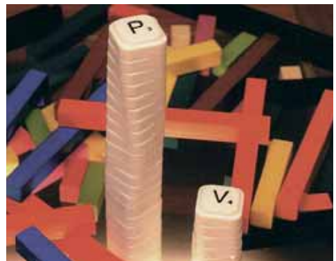
Il·lustració extreta de la portada del llibre.