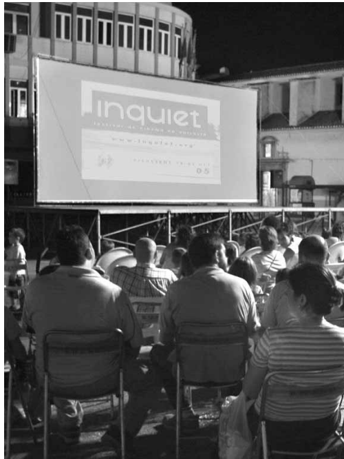
Projecció de Madagascar en valencià, el passat 5 de setembre.