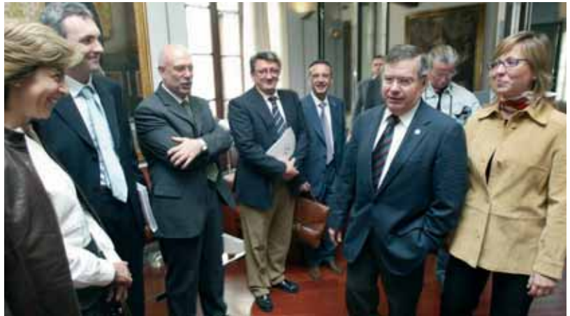
El rector, la consellera i altres organitzadors del congrés, el dia de la presentació.

congrés, tant oral com escrit, reste en la seua conclusió a l'abast de la societat. Per a la qual cosa s'acudirà a diverses vies de comunicació que estenguen el material a l'opinió pública. La quota d'inscripció general i única és de 75 euros, que inclou taxes, assistència a totes les sessions del congrés, documentació i certificació d'assistència.