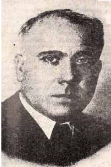
Una imatge de José Medina Echavarría publicada a Mèxic l'any 1941.

tat l'exposició de llibres, que està coordinada per Celi Aragón. Tant la conferència com l'exposició permeten recuperar la figura d'un valencià exiliat al qual fins ara no se li havia dedicat cap atenció. L'exposició fou inaugurada ahir dimecres, i els llibres i altres documents inclosos possibiliten visualitzar la trajectòria i l'obra de Medina.