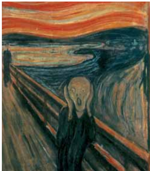
El crit, d'Edvard Munch.

Una vintena d'artistes escollits per prestigiosos crítics i galeristes, com és habitual en el certamen, es farà ressò en les seues obres dels problemes i les crisis socials del nostre temps des d'una perspectiva crítica i lliure, on cap també l'expressió ideològica. Amb el tema escollit enguany el Patronat Martínez