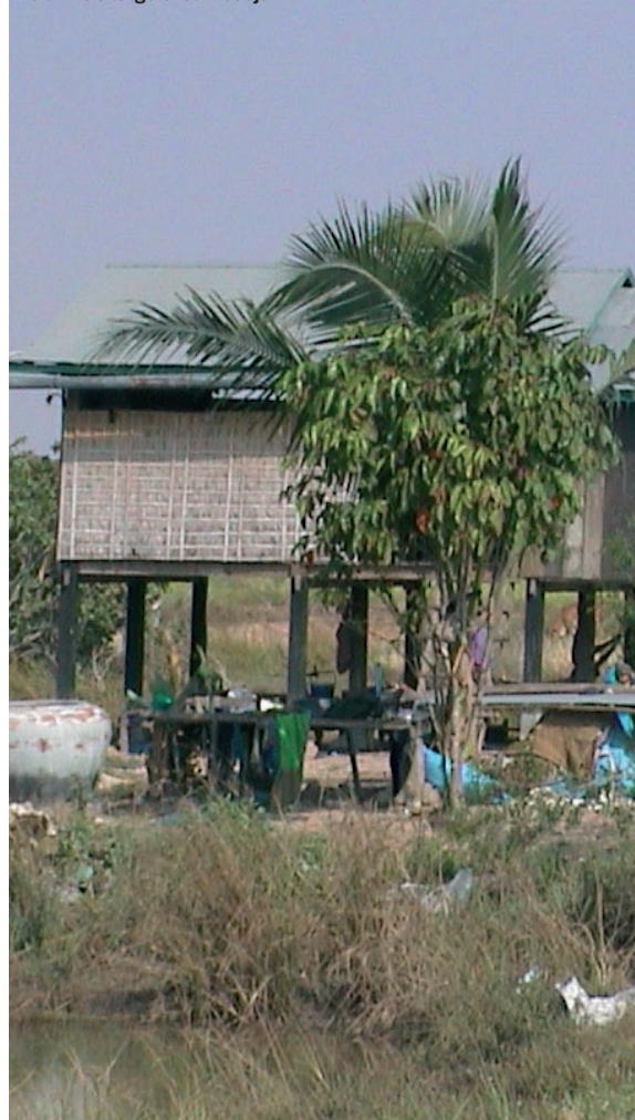
Imatge que mostra la pobresa d'un habitatge a Cambodja.

Unes perspectives, a la fi, que cal evitar treballant des d'ara mateix.