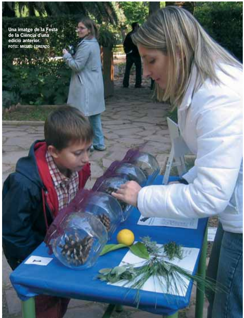
Una imatge de la Festa de la Ciència d'una edició anterior.

Demà divendres, 18 de novembre, a les 10 hores hi haurà un Taller d'Astronomia a la Facultat de Matemàtiques (Campus de Burjassot). També s'estan celebrant cursos sobre qüestions científiques de la màxima actualitat, com ara Divulgació en televisió: el gènere documental , La Il·lustració Científica , Una aproximació científica a la gastronomia , o Escenaris i actors per a la comunicació científica . Els dos darrers comencen la setmana vinent i està oberta la preinscripció, que es pot realitzar en la pàgina http://www.valencia.edu/cdciencia/cursos06.htm .