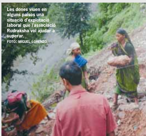
Les dones viuen en alguns països una situació d'explotació laboral que l'associació Rudraksha vol ajudar a superar.