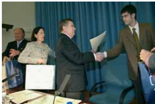
Un dels alumnes premiats, amb el rector.