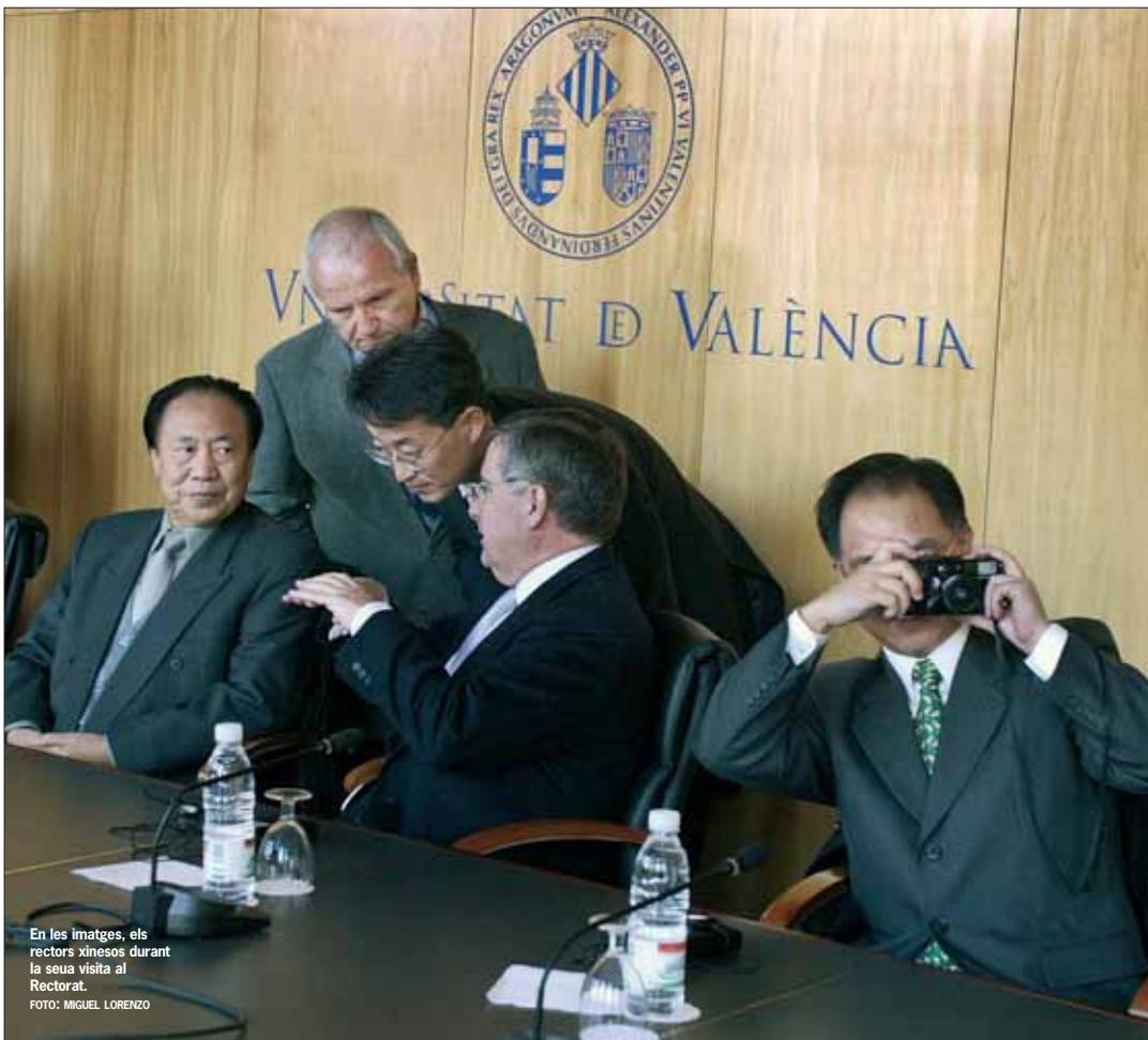
En les imatges, els rectors xinesos durant la seua visita al Rectorat.