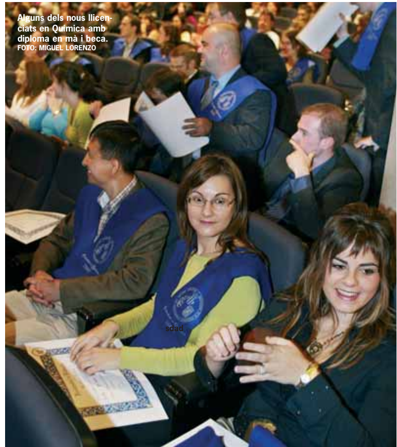
Alguns dels nous llicenciats en Química amb diploma en mà i beca.