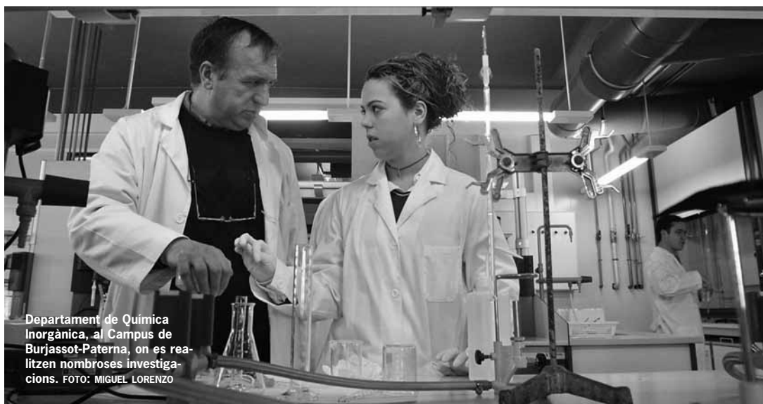
Departament de Química Inorgànica, al Campus de Burjassot-Paterna, on es realitzen nombroses investigacions.