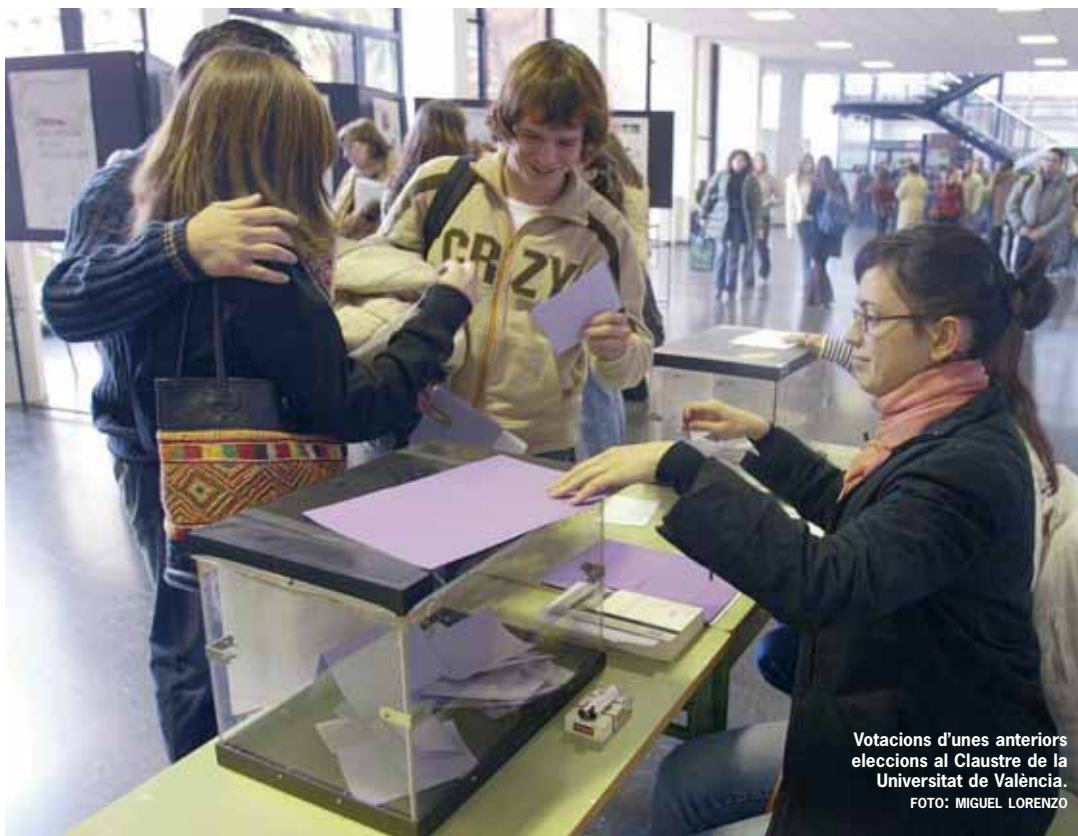
Votacions d'unes anteriors eleccions al Claustre de la Universitat de València.