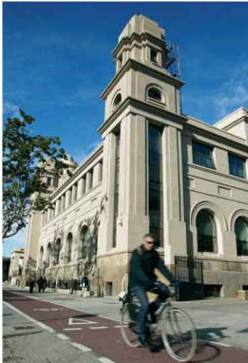
Edifici del Rectorat de la Universitat de València.