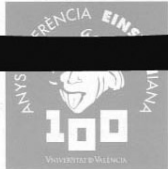
Albert Einstein en una imatge de 1935. Dalt, el logotip de la commemoració del centenari.

fotoelèctric. El treball li va valdre el Premi Nobel de Física l'any 1921. Einstein va establir una nova manera de veure el món, que va continuar desenvolupant fins a la seua mort el 1955. La seua teoria de la relativitat especial i general revolucionària acabaria sent el fonament de la física moderna. La seua teoria de la relativitat especial, que descriu la física a partir de partícules i camps, i la seua teoria de la relativitat general, que descriu la gravitació, representen noves etapes en el desenvolupament de la física.