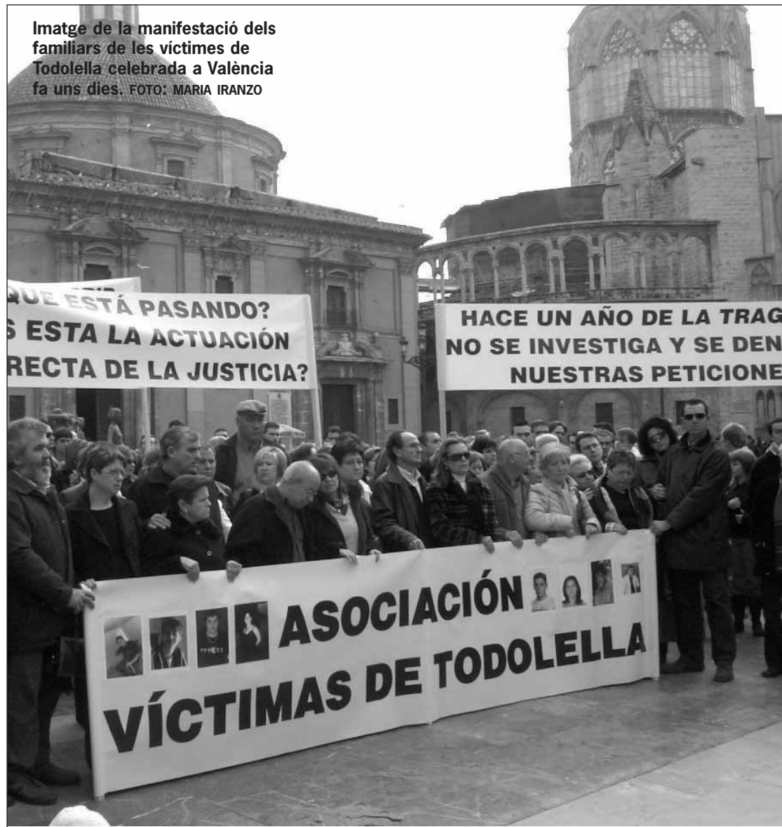
Imatge de la manifestació dels familiars de les víctimes de Todolella celebrada a València fa uns dies.

Aquella nit la jutgessa d'instrucció va incoar un procés penal sumari, el que es preveu per a la investigació dels delictes que revesteixen penes més greus. No calia buscar la causa de la mort