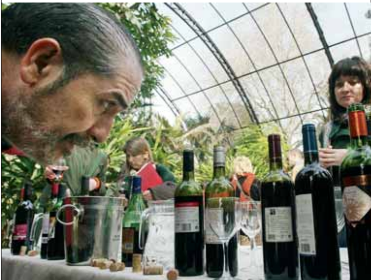
Un moment de la cata celebrada durant la jornada.