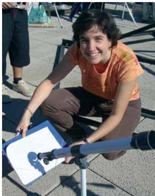
Una estudianta, durant l'eclipsi del mes d'octubre.

de manera segura. No s'ha d'observar mai directament el Sol, ni amb ulleres de sol, telescopis o prismàtics. En aquest cas, la llum de Sol es concentraria en la retina i l'ull es cremaria en fraccions de segon.