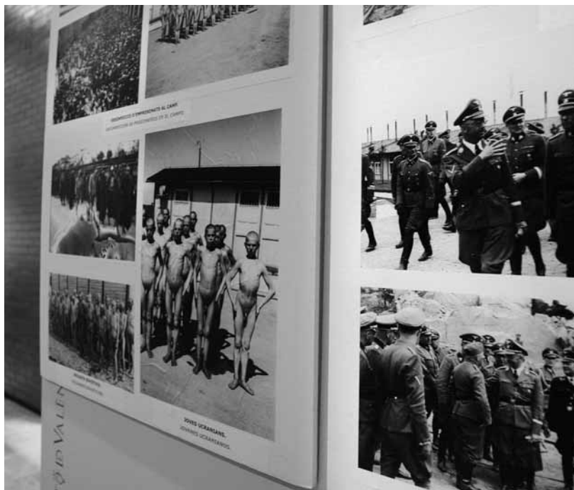
Imatge de l'exposició sobre nazisme atacada fa dues setmanes pels ultres.

La comunitat universitària està convocada el dia 30 a una concentració de protesta per a condemnar l'agressió feixista a un jove estudiant quan defenia una exposició sobre la barbàrie del nazisme a Mauthausen. L'acte ha estat convocat per la Plataforma Universitària Antifeixista, creada la passada setmana per diversos col·lectius d'estudiants de la Universitat. Els alumnes volen així defensar-se dels darrers atacs que estan sofrint les forces més progressistes per part de grups ultres.