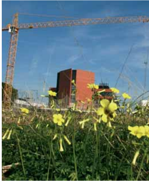
Obres al Parc Científic de la Universitat.

D'altra banda, a proposta de la Facultat de Ciències Socials, el Consell de Govern va aprovar un manifest sobre la reforma de la LOU. Segons s'afirma en el document, "la reforma de la LOU no pot ser una reforma de mínims" i "qualsevol reforma que intente millorar efectivament la situació actual de la Universitat ha de contemplar una memòria econòmica amb un compromís financer dels poders públics per augmentar la despesa en educació superior i investigació, més enllà de declaracions de bones intencions". El manifest considera fonamental dotar els òrgans de representació universitària, concretament el Claustre, de capacitat de decisió sobre els aspectes fonamentals de la vida universitària, "cosa