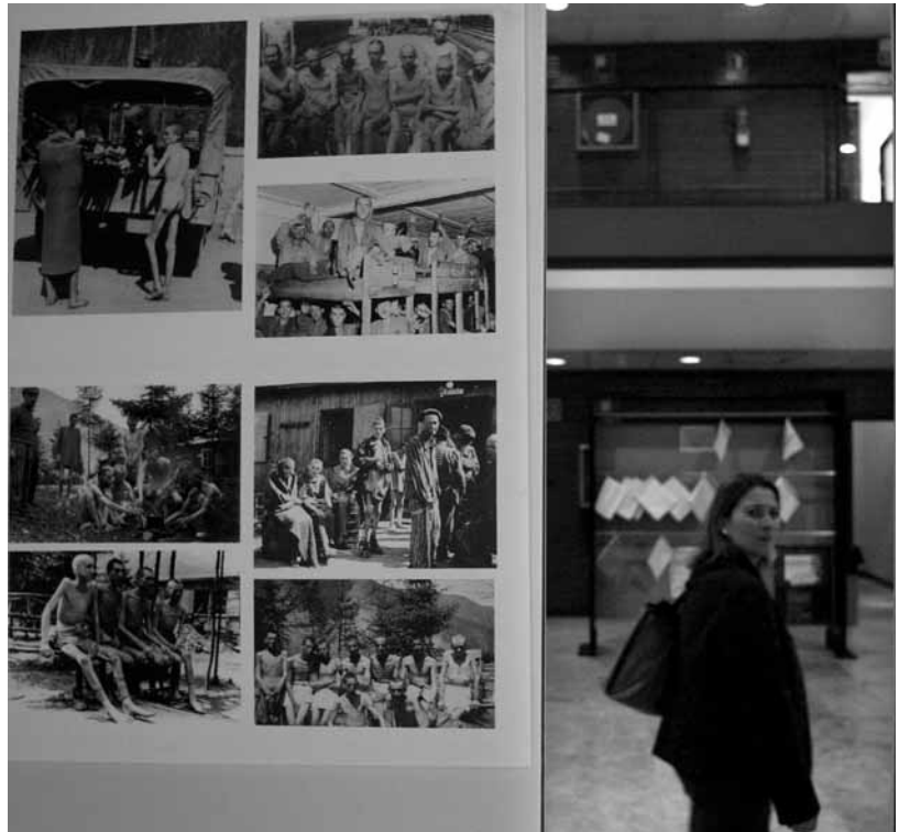
Imatge de l'exposició sobre nazisme atacada fa dues setmanes pels ultres.

El dimecres estarà dedicat a la reclusió republicana als camps d'extermini nazis. A les 10 hores, al Saló d'Actes de la Biblioteca, el cineasta valencià Pau Vergara presenta la seua pel·lícula Más allá de la alambrada , i a les 12:15 la periodista de TV3 Montserrat Armengou presentarà el seu documental El Comboi dels 927 . A les 16:30 hores, també al Saló d'Actes de la Biblioteca, oferiran el seu testimoniatge Adrián Blas i Francisco Aura, supervivents dels camps de concentració. I a les 19:30 hores, a la Sala Palmireno (Facultat de Geografia Història), es presentarà l'espectacle Versos per a la llibertat , amb poemes de Federico García Lorca, Pablo Neruda, León Felipe i Antonio Machado, en el qual es combinen música, balls i efectes audiovisuals.