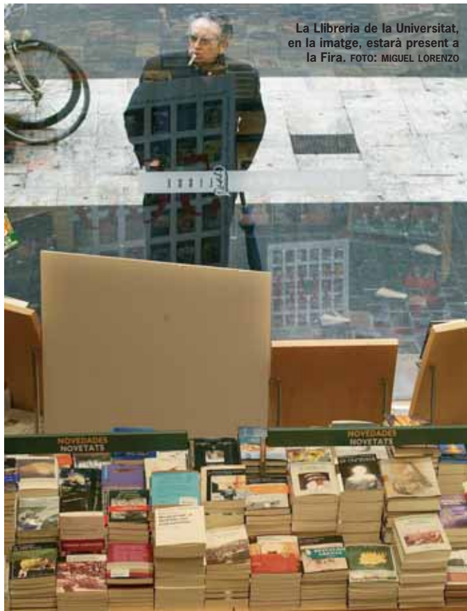
La Llibreria de la Universitat, en la imatge, estarà present a la Fira.

El dimarts dia 2 de maig es presentaran les novetats de la col·lecció Biblioteca