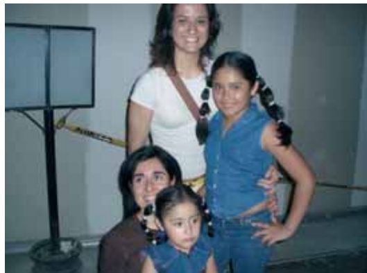
Dues de les voluntàries amb xiquetes de Nicaragua.