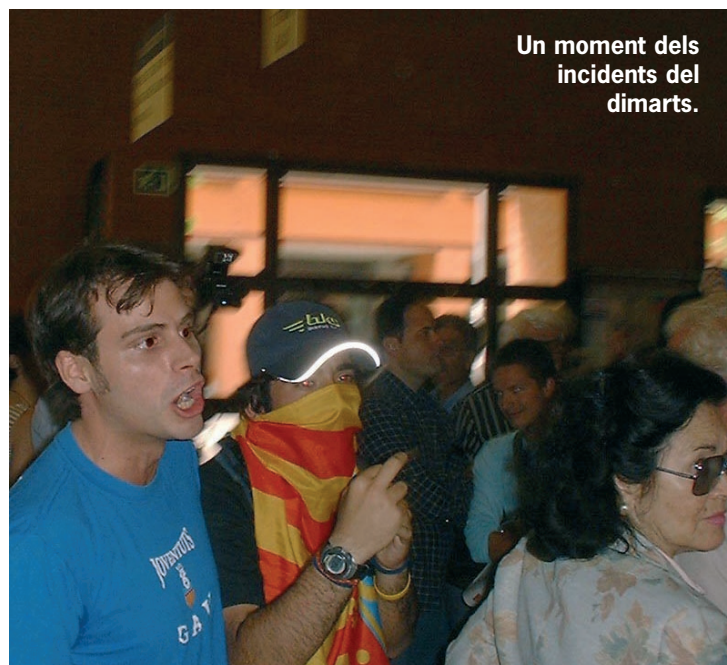
Un moment dels incidents del dimarts.