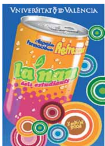
Logotip de l'edició d'enguany.

ció en Salut, Comunicació i Societat, El Món de la Discapacitació, Ciència per a Tothom,