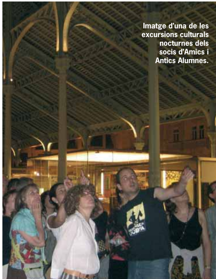
Imatge d'una de les excursions culturals nocturnes dels socis d'Amics i Antics Alumnes.

Carnet de biblioteca. Podràs traure els llibres de la Universitat sense tramitar cap altre carnet.