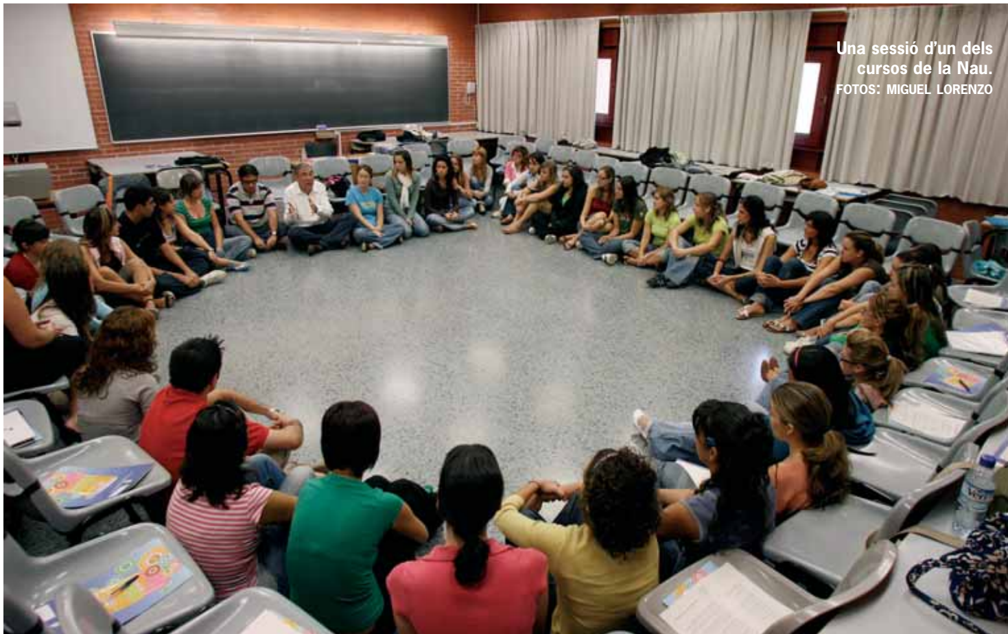
Una sessió d'un dels cursos de la Nau.