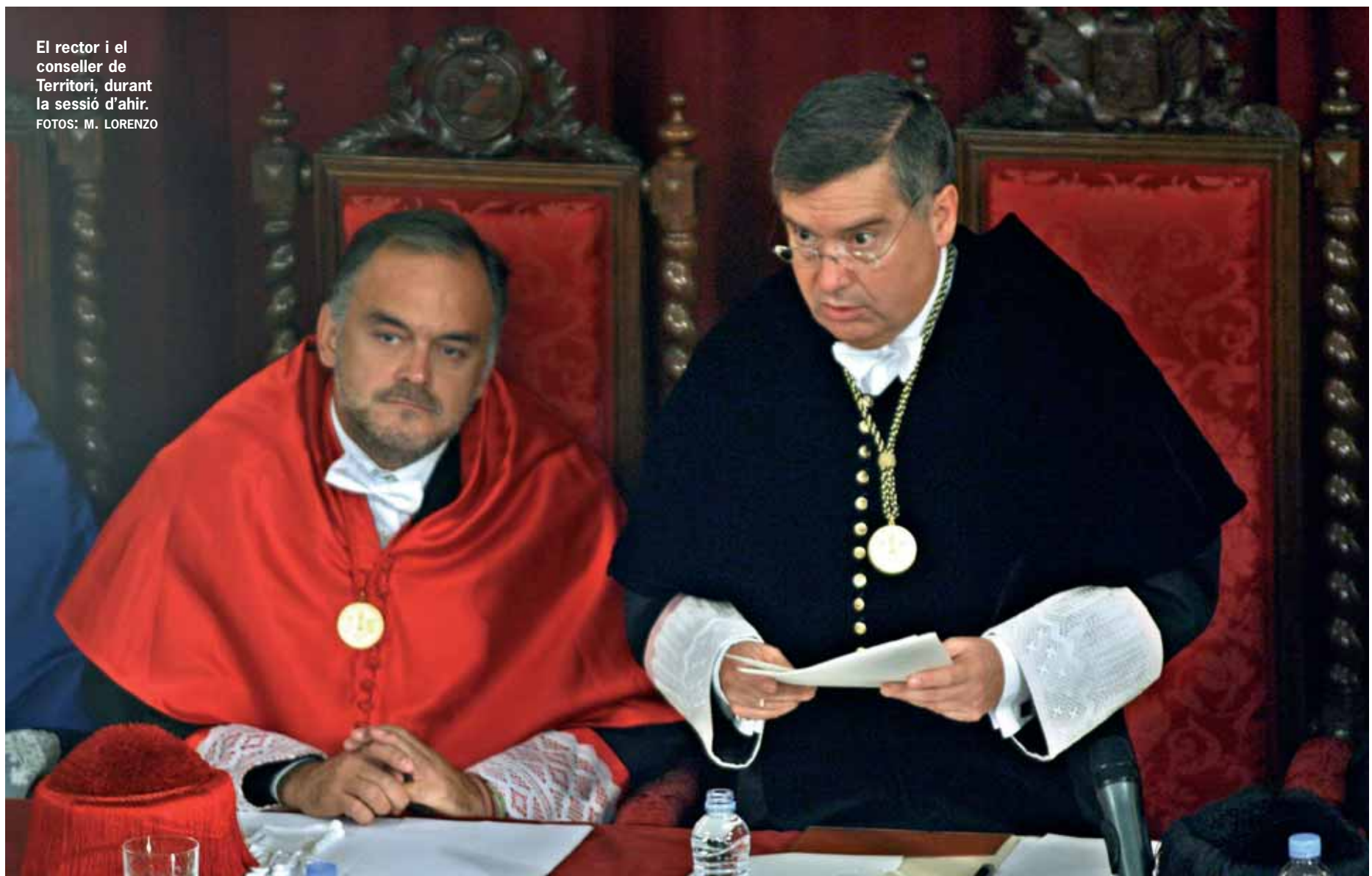
El rector i el conseller de Territori, durant la sessió d'ahir.

OBERTURA. Arranca el curs 2006-2007 amb el solemne acte al Paranimf de la Nau