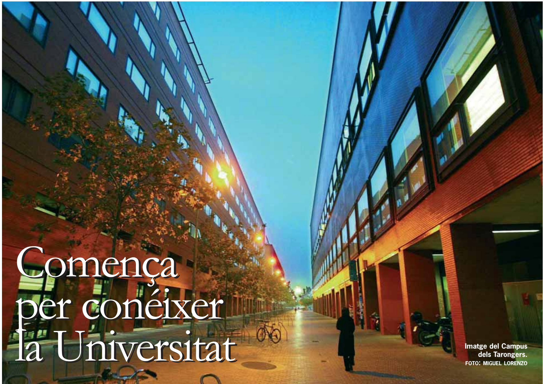
Imatge del Campus dels Tarongers.

S'OBRI EL CURS. La Universitat és una institució gran que cal conèixer per tal d'aprofitar la seua oferta