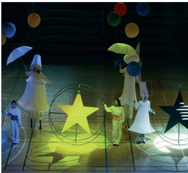
Espectacle d'inauguració del Mundial de Taekwondo.