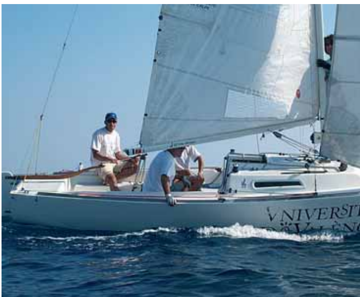
A l'esquerra, la biblioteca de Tarongers. A la dreta, curs de vela en el vaixell de la Universitat.