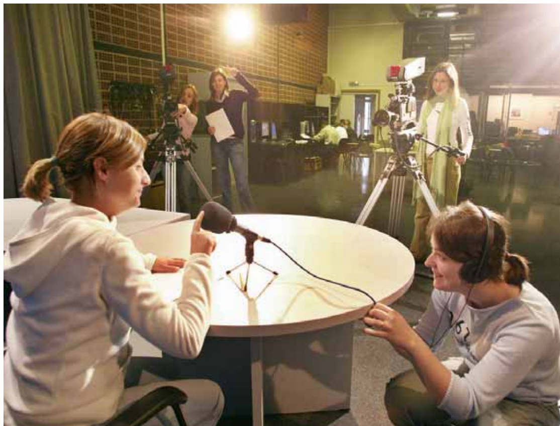
Estudiants de Periodisme graven una pràctica en un plató de televisió de la Universitat.

La Universitat de València ofereix un total de 66 titulacions de primer i de segon grau, però, a més, disposa de 32 programes oficials de postgrau, dels quals, en el curs que ara s'inicia, s'activaran un total de 25. La docència, a la Universitat de València, es troba en plena transformació per a ser adaptada al denominat procés de Bolonya, la convergència dels estudis superiors en tot Europa. Ara ja és possible estudiar en anglès moltes assignatures. A més, la Universitat és seu de l'Institut Confuci de Llengua i Cultura Xineses i té una llarga tradició en l'ensenyament d'altres llengües europees: francès, italià, alemany... Fruit d'aquesta tradició, la Universitat s'ha convertit aquest mes de setembre en centre oficial examinador de llengua italiana. Això ha sigut possible gràcies a un conveni signat amb la Università per Stranieri di Perugia que permet ser centre delegat i realitzar l'examen oficial de Llengua Italiana (CELI). De fet, el primer examen es realitzarà ja el pròxim dia 20 de novembre. A més a més, la Universitat és també centre delegat de l'Institut