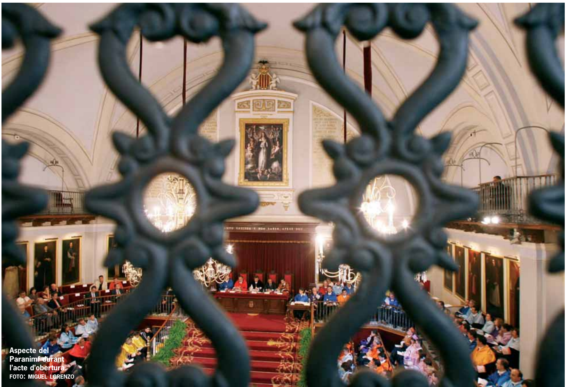
Aspecte del Paranimf durant l'acte d'obertura.

Enguany, el curs comença amb l'oferta de seixanta-sis titulacions i novetats com ara l'homologació de Ciències de la Seguretat, la creació de l'Institut Confuci de Llengua i Cultura Xineses, l'ampliació de l'oferta lectiva en anglès o l'èxit de les dobles titulacions. La Universitat ofereix a més nombrosos serveis que els estudiants han de conèixer i aprofitar al màxim. Pàgs. 6/7