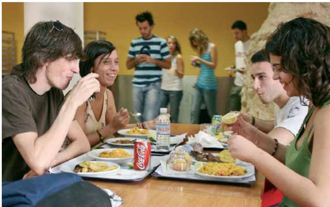
Menjador del Rector Peset. Dalt, façana del Col·legi Major Lluís Vives.