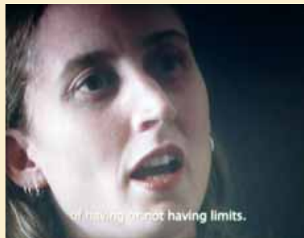
On Translation Fear-Miedo , d'Antoni Muntadas.

[...] Acollir de cor la diversitat en els sistemes educatius? Descobrir-la com una oportunitat i no com un problema? Resulta significatiu, quan ens plantegem aquestes qüestions, constatar que el ja clàssic informe de la Unesco en què es presenten els pilars de l'educació (Delors, 1996) aborda el tema de la diversitat en el marc més ampli d'una societat sotmesa a tensió per la crisi del vincle social, és a dir, per l'augment clar de les desigualtats entre països i dins d'un mateix país. La fragmentació social i la pèrdua d'uns valors integradors que podrien consti-