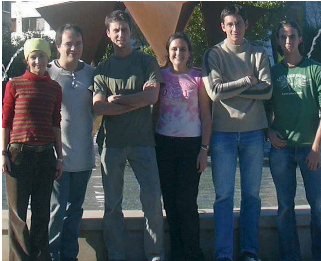
En la imatge, els estudiants de la Universitat de València que participen en el projecte de l'Estació Espacial Europea.

El projecte va ser presentat al programa educatiu Success Student Contest/Special Opportunities de l'ESA en abril del 2005. Success és una competició euro-