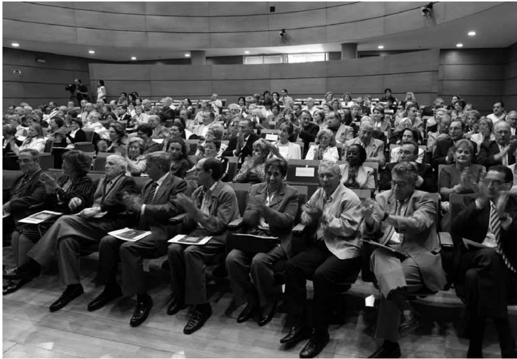
Una imatge del lliurament de diplomes als alumnes de La Nau Gran.