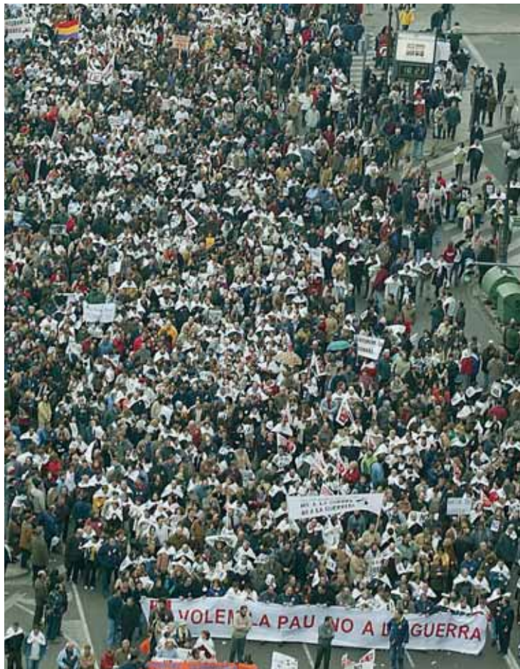
Imatge d'arxiu d'una manifestació contra la invasió d'Iraq.

Els dies 16 i 17 de novembre se celebren, al Saló d'Actes de Ciències Socials (Campus dels Tarongers), un curs de sensibilització sobre els conflictes oblidats i sobre les vies de construcció de la pau. Tota la informació i la inscripció es poden trobar a l'Institut de Drets Humans (Edifici Departamental Occidental, despatx 3P11). El curs és convalidable per un crèdit de lliure opció i està organitzat per Càritas Diocesana de València i per l'Institut Universitari de Drets Humans, de la Universitat de València. Aquest curs està destinat a estudiants, col·laboradors d'ONGs i al públic interessat en els conflictes oblidats. D'altra banda, dels dies 14 al 17 de novembre, al Saló de Graus de la Facultat de Dret (Campus dels Tarongers), tindran lloc les XII Jornades de Dret Internacional Humanitari. Aquestes jornades estan impulsades per la Creu Roja, amb el patrocini de la Universitat de València. Tota la informació sobre les jornades es pot aconseguir a la Secretaria del Departament de Dret Internacional (despatx 3.p03), o al telèfon 96 382 85 51. Aquestes jornades sobre dret internacional humanitari se centraran en els con-