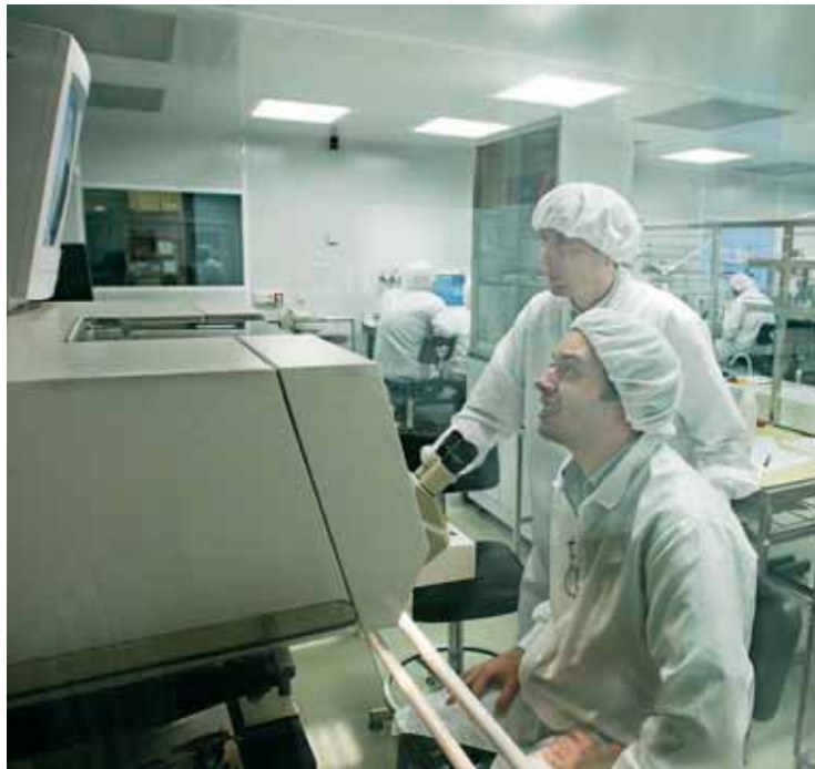
Investigadors de la Universitat de València.

Els CIBER es constituïran com a consorcis públics amb entitat jurídica pròpia. Aquests centres comptaran amb un finançament estable durant les anualitats 2007 al 2010 i cadascun estarà integrat per una selecció de grups d'investigació pertanyents a diversos organismes d'investi-