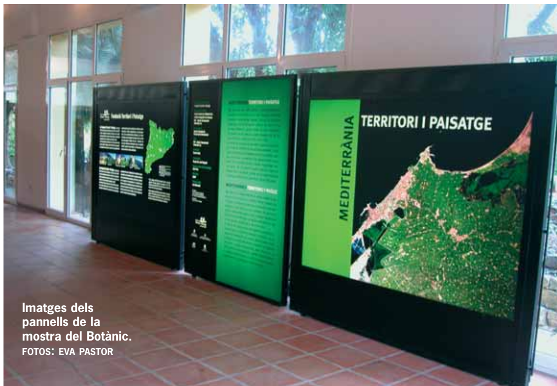
Imatges dels panells de la mostra del Botànic.