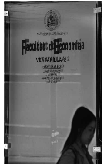
Cartell de la facultat.

Amb aquesta competició la Facultat d'Economia de València, i les seues homòlogues de les universitats d'Alacant i Jaume I de Castelló, pretenen estimular l'estudi de les ciències econòmiques entre els joves. Les proves van consistir a resoldre qüestions numèriques, contestar preguntes teòriques i realitzar un comentari de text sobre actualitat econòmica. La