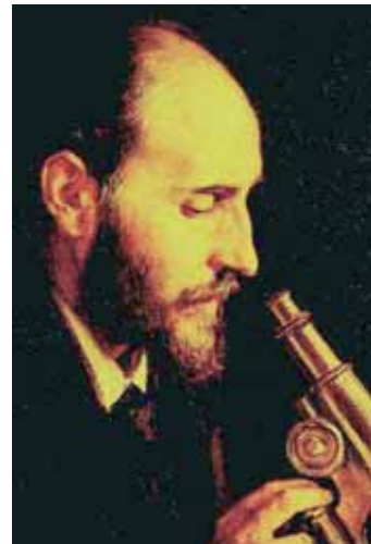
Dalt, acte d'investidura conjunt de les universitats de València, Jaume I i Alacant de Muhammad Yunus, celebrat el passat juny. Al centre, el químic suís Kurt Wüthrich. A baix, Amartya Sen durant la seua estada a la Universitat de València, i una imatge d'arxiu de Santiago Ramón y Cajal, de qui ara es commemora el centenari el seu premi Nobel.