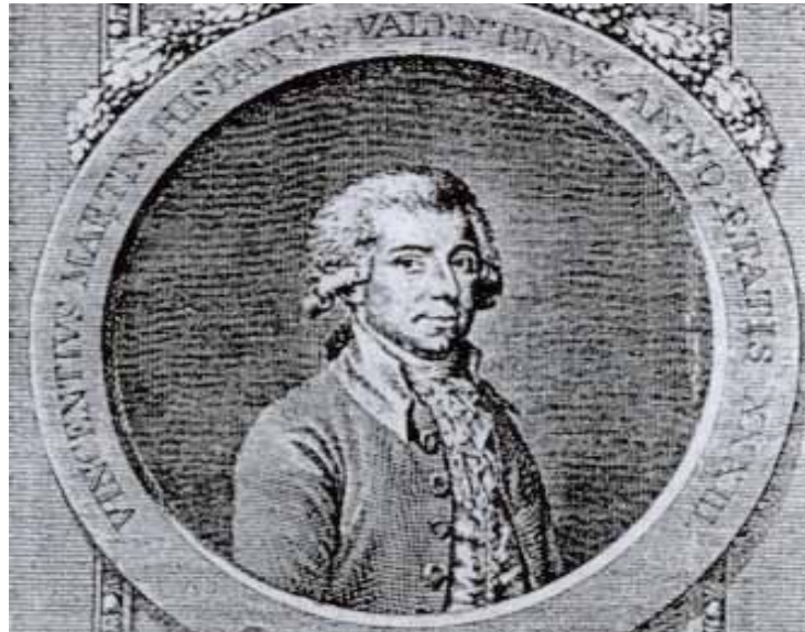
Gravat del segle XVIII de Martín i Soler.