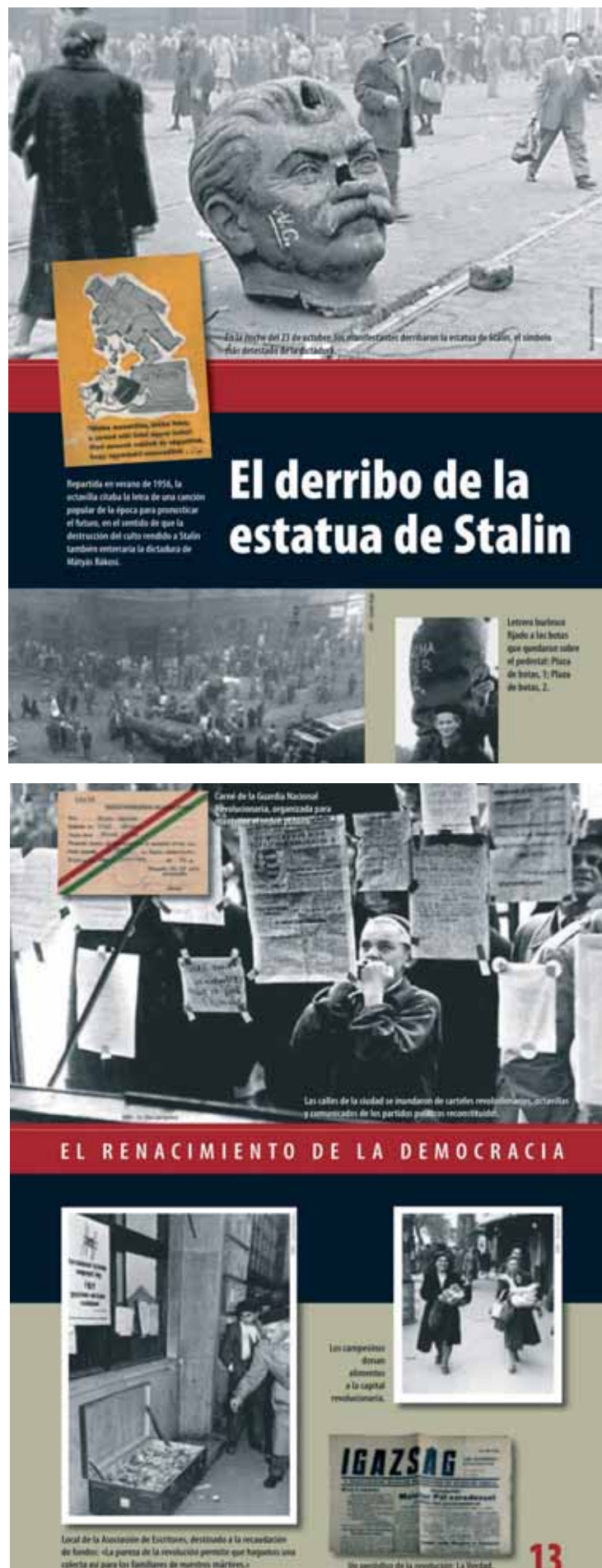
Alguns dels panells de l'exposició.

Els panells exposats a Dret viatjaran posteriorment a altres ciutats. Es tracta d'una iniciativa itinerant del Ministeri d'Afers Exteriors d'Hongria.