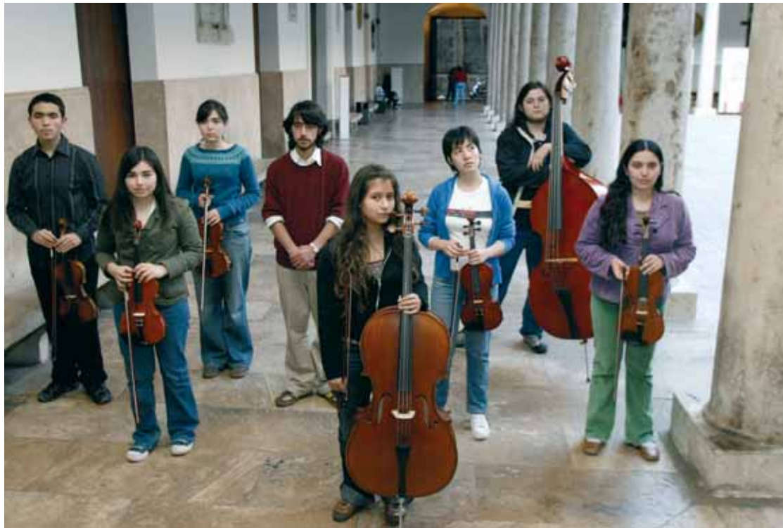
Els músics xilens, al Claustre de la Nau de la Universitat de València.