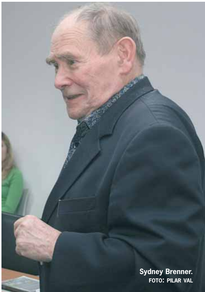
Sydney Brenner.

Sydney Brenner, que va compartir el premi Nobel amb John E. Sulston i H. Robert Horvitz pels seus descobriments sobre la