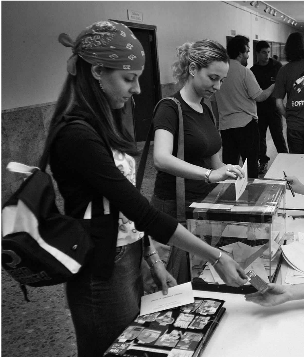
Estudiants voten en una anterior convocatòria electoral.

Els estudiants que no puguin estar presents el dia de les eleccions per a emetre el seu vot també podran fer-ho abans, però com a molt tard el dia 29 a les 14 hores. Per a la qual cosa hauran de depositar la seua papereta en el corresponent deganat o direcció que tinga la responsabilitat del col·legi electoral. La papereta haurà d'anar dins d'un sobre tancat, sense cap inscripció, acompanyat d'una fotocòpia d'un carnet d'acreditació. En aquesta modalitat de votació no serà necessari l'ús de la papereta impresa. Serà suficient indicar-hi el nom de la candidatura o el del cap de llista.