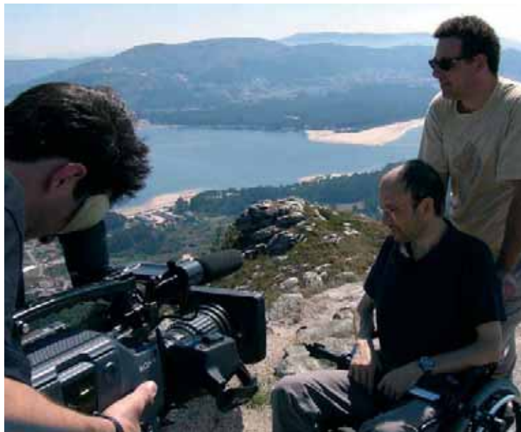
Imatge del rodatge a Galícia de la pel·lícula Las alas de la vida .

Aquest objectiu l'han aconseguit sobradament. L'èxit els segueix des que van presentar la pel·lícula en públic al Festival de Valladolid, on fa uns mesos va aconseguir el primer premi en la modalitat de pel·lícula documental. A més, ha estat reiteradament elogiada per la crítica i els comentaris en els principals mitjans de comunicació del país corroboren la seua qualitat. Ara arriba el moment d'escoltar el públic, i demà divendres dia 24 s'estrena a València als cinemes Albatros, per a do-