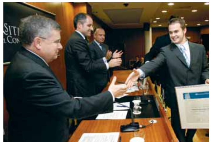
El rector i Camps en el lliurament del premi a un estudiant.