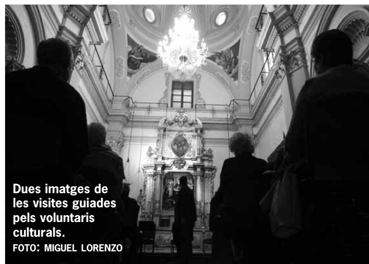
Dues imatges de les visites guiades pels voluntaris culturals.

I és que, a més de les visites guiades on es mostra l'edifici de la Nau, els voluntaris culturals informen sobre les exposicions que es duen a terme en les diverses sales i que acullen propostes tan diverses com ara les col·leccions patrimonials i la memòria universitària, la creació contem-