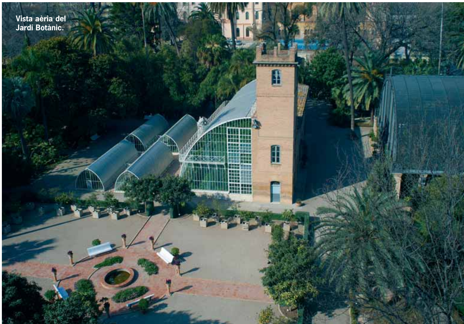
Vista aèria del Jardí Botànic.