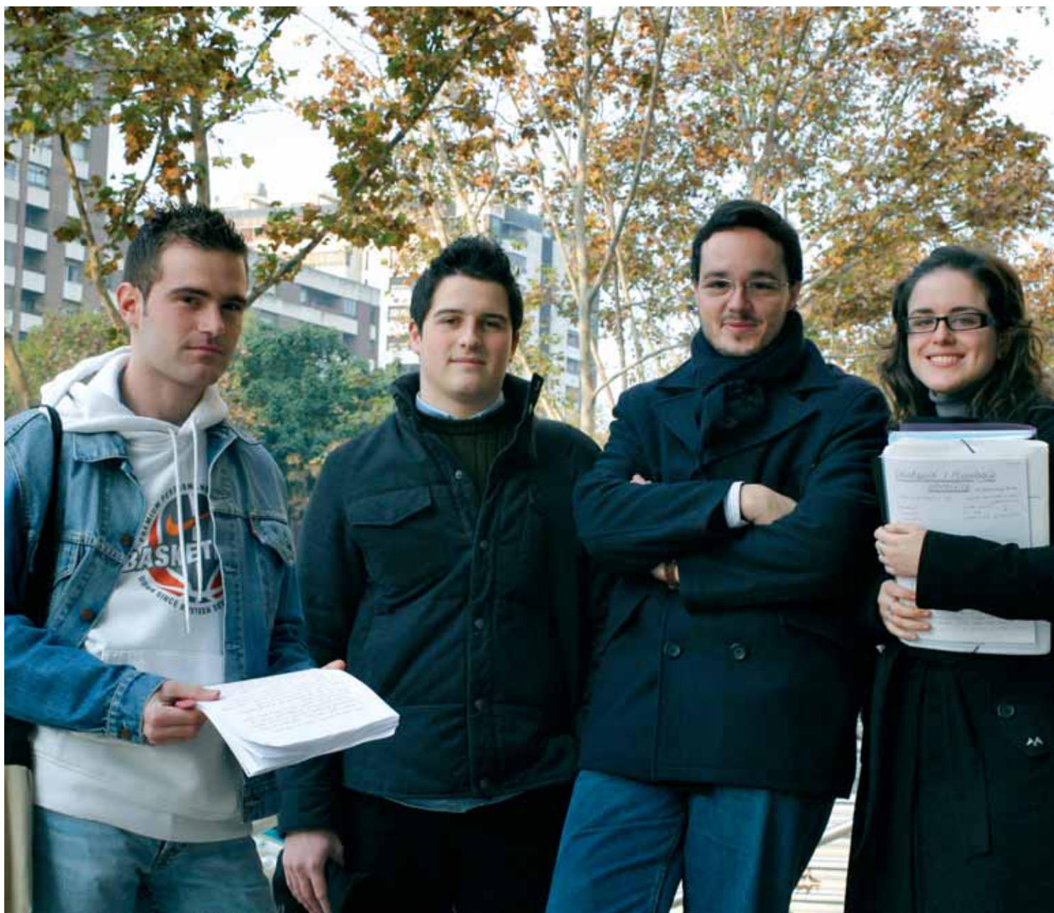
Estudiants d'Odontologia premiats.

PREMIS. El Consell Social premia l'Associació d'Estudiants d'Odontologia