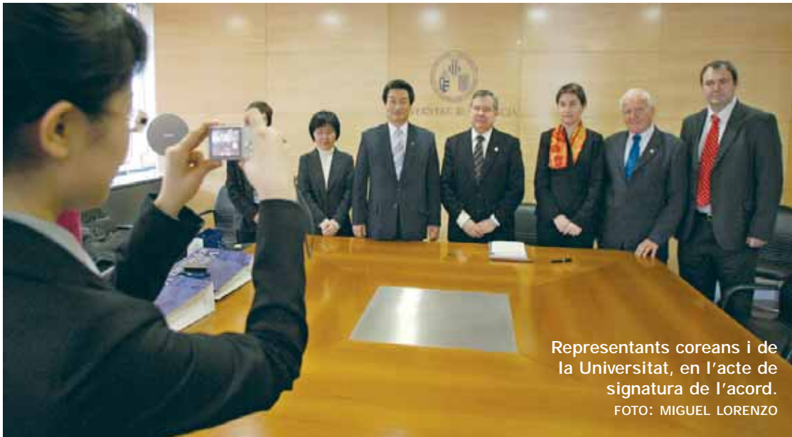
Representants coreans i de la Universitat, en l'acte de signatura de l'acord.