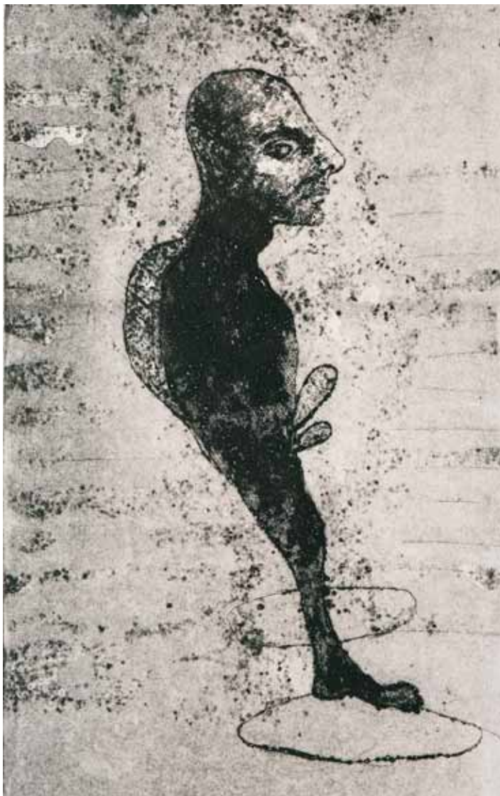
Una pintura de Hani Alqam, que s'exposarà a La Nau.

El lema de l'encontre, de tolerància i solidaritat, aporta