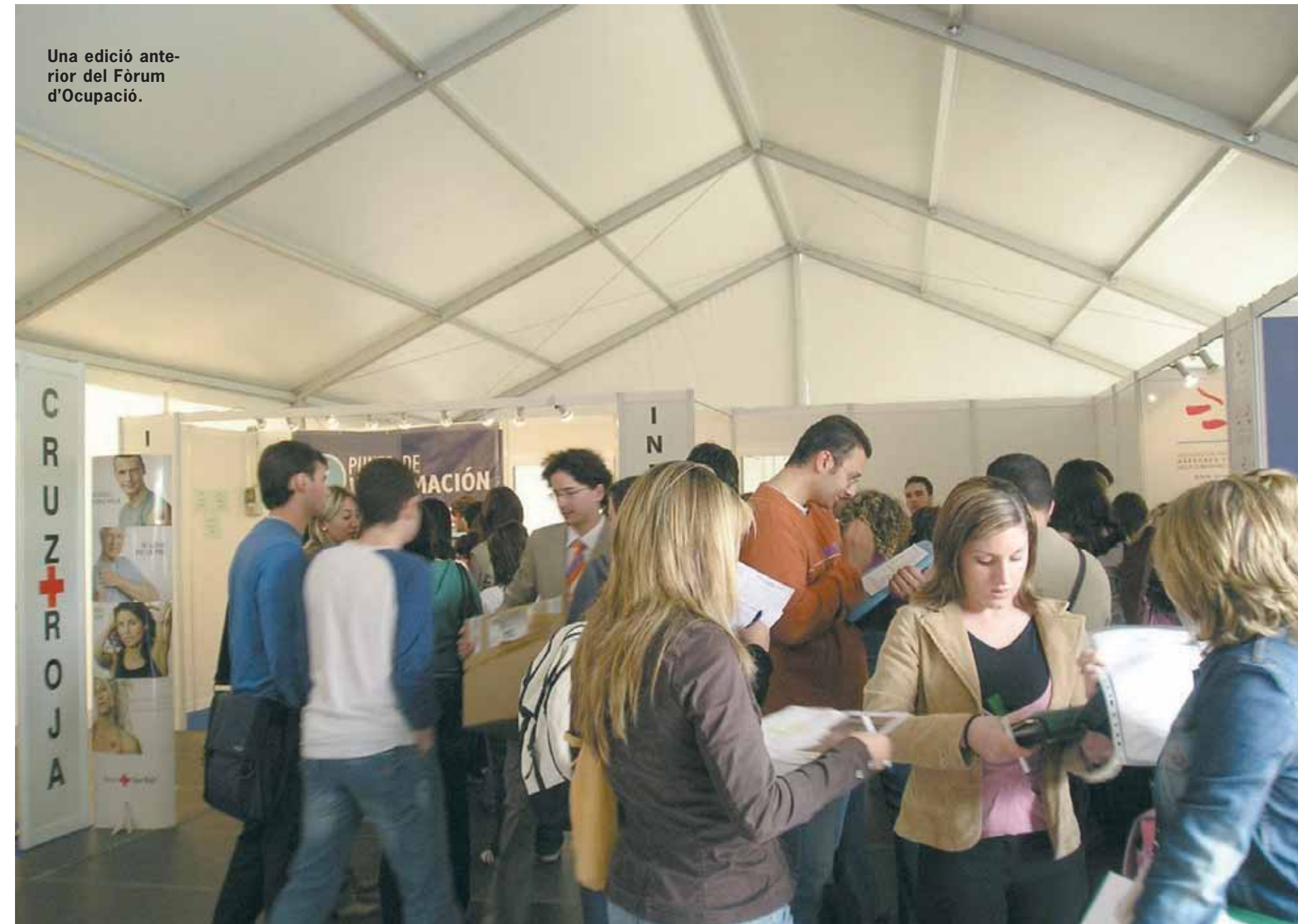
Una edició anterior del Fòrum d'Ocupació.

Prop de cinquanta empreses participaran la pròxima setmana en el Fòrum de l'Ocupació. Enguany se celebra la tercera edició d'aquest encontre que reuneix empreses i institucions amb estudiants d'últims cursos i recent titulats. L'objectiu és que aquests últims aprofiten aquesta possibilitat d'encarar el seu futur laboral. Aquest fòrum ha estat concebut com un lloc de trobada i les activitats estan pensades perquè els alumnes coneguen de primera mà les empreses, els responsables de recursos humans i a més puguen lliurar el currículum i participar en reunions o entrevistes.