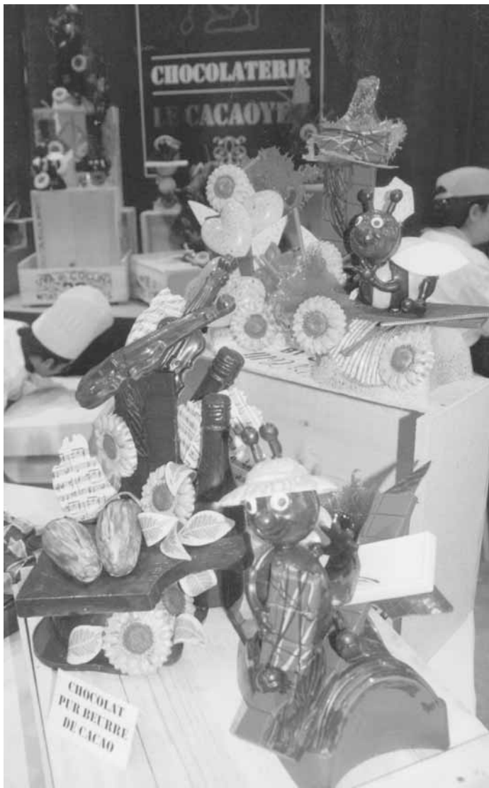
Imatge d'una xocolateria francesa.

La setmana està organitzada en diversos nivells. Per a tots els públics hi ha un curs sobre elaboració de la xocolata. Es tracta d'aprendre a fer xocolate amb l'ajuda de xocolaters experts. Les dates d'aquest curs són entre el 19 i el 25 de febrer. El lloc, el carrer Menor del Museu de les Arts i les Ciències. També hi haurà una exposició titulada Món xocolate . Estarà oberta els dies 24 i 25 de febrer, de 12 a 13:30 hores, i de 17 a 18, també al