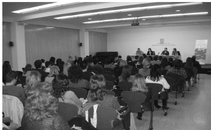
Una de les sessions del fòrum celebrat a Gandia.