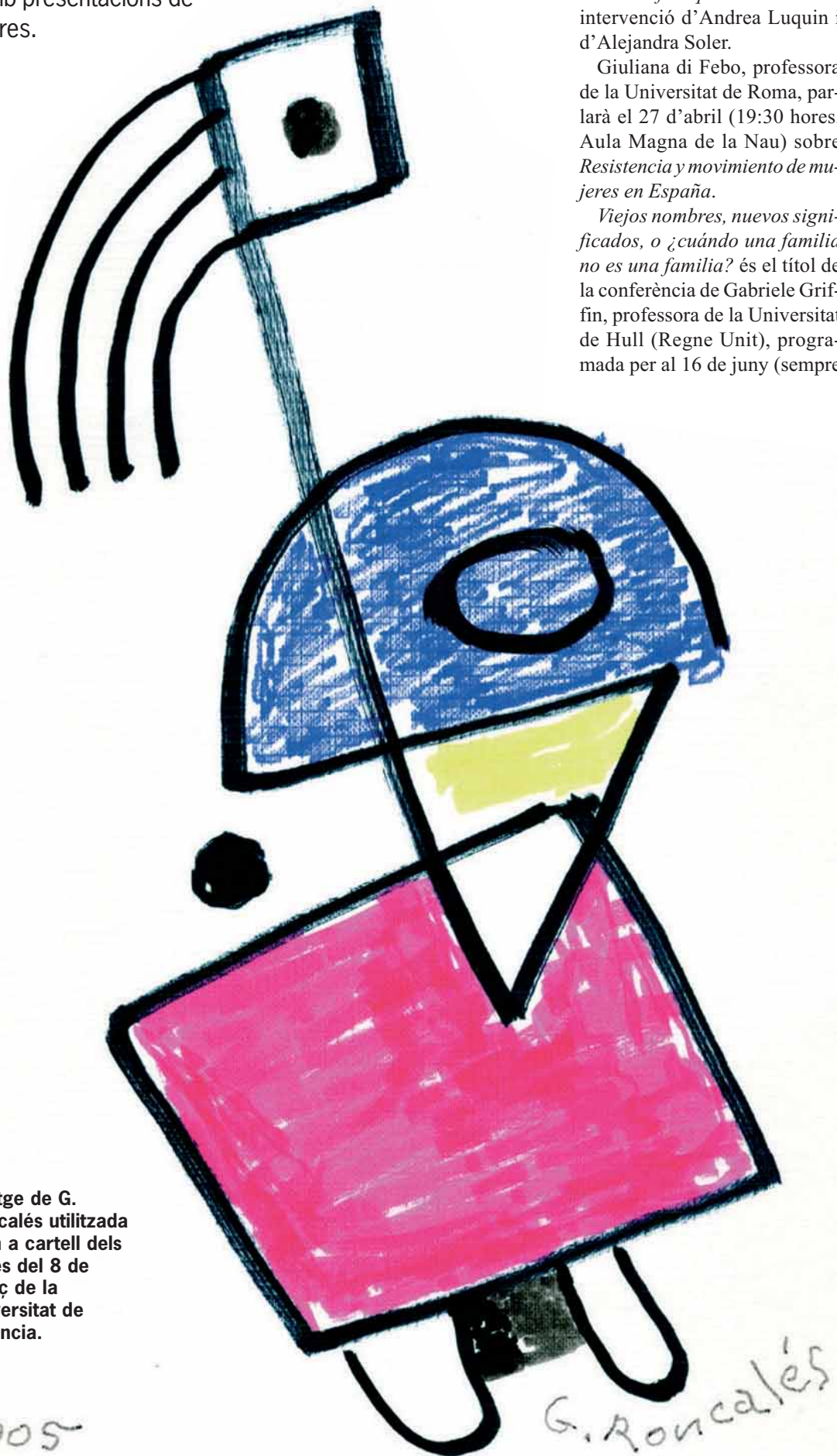
Imatge de G. Roncalés utilitzada com a cartell dels actes del 8 de Març de la Universitat de València.