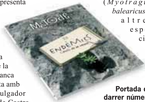
Portada del darrer número.

( Myotragus balearicus ) i altres espècies