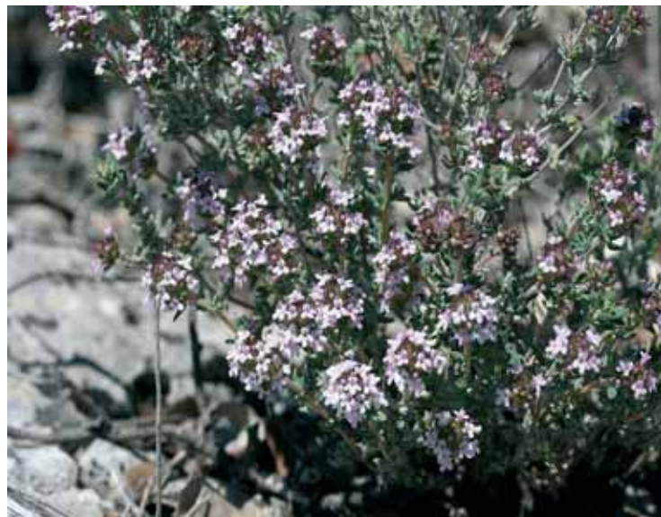
Timó, una de les plantes endèmiques del paisatge valencià.

Aquesta setmana s'ha obert la matrícula per al nou cicle d'eixides del Jardí Botànic. Un any més el Jardí ofereix per al primer semestre de l'any sis excursions d'un dia i dos viatges per a conèixer de prop la natura. Escapades per a tota la família acompanyats de guies de camp i botànics que ho contaràn tot sobre el paisatge, les plantes i el terreny que es recorre. Les eixides d'un dia s'enceten amb un passeig per la serra Cortina, a la Marina Baixa, el diumenge 11 de març. Allí es gaudirà de la vegetació mediterrània composta pel timó, cua de gat, argelaga, estepa blanca i romer, entre molts altres. La resta d'eixides seran al barranc dels Horts, la Murta, les Estepes