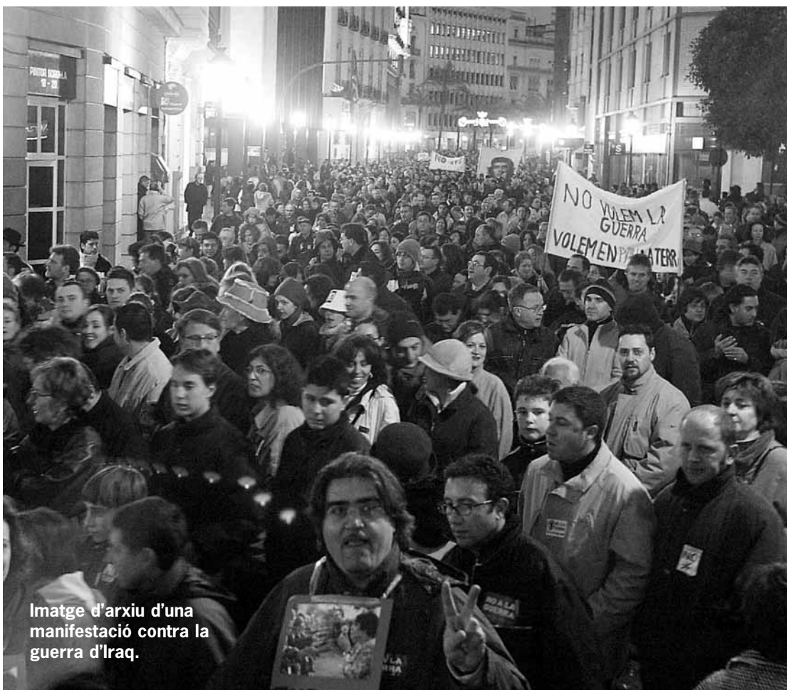
Imatge d'arxiu d'una manifestació contra la guerra d'Iraq.