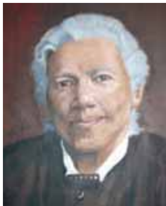
Harriet A. Jacobs

Norte, que atestiguan que las sombras de la esclavitud se alargan incluso hasta allí. Escrita l'any 1859 per Harriet I. Wilson. La segona té com a títol Peripecias en la vida de una joven esclava, escritas por ella misma , del 1861, de Harriet A. Jacobs, que s'edita juntament amb Un relato verdadero de esclavitud de John S. Jacobs. L'última, pel moment, és ¿Nimiedades para la eternidad? Pioneras en la escena estadou-