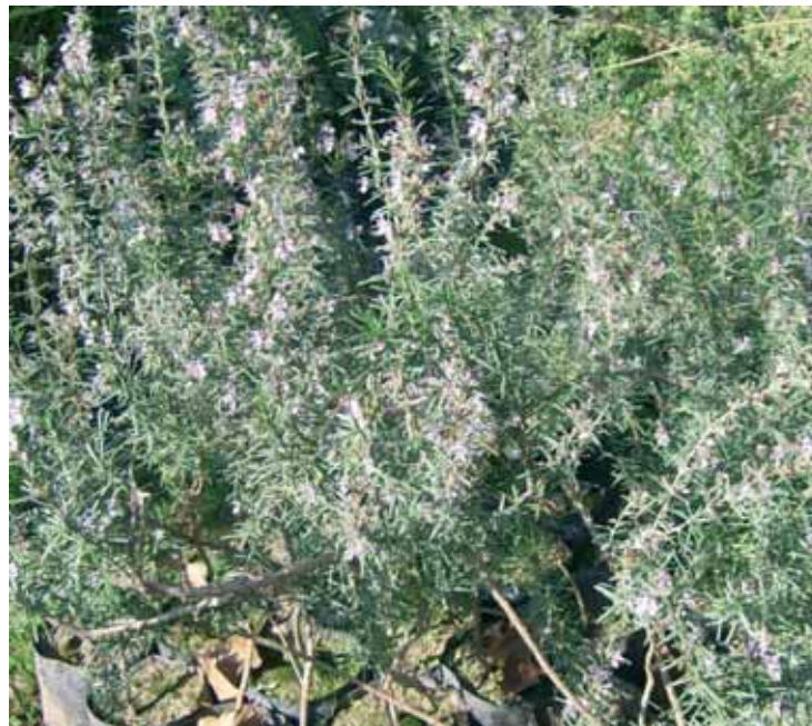
Una planta de romer, espècie típicament mediterrània.

La inscripció és gratuïta i la sol·licitud del curs s'ha d'enviar o bé al director de l'Estació