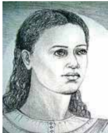
Harriet I. Wilson.