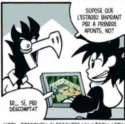
NOTA: DESCONFIA SI ESCOLTES UN MÒDEM ACTIU