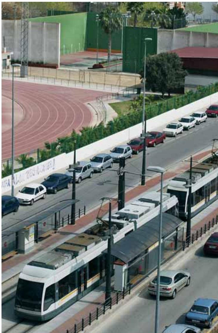
Un tramvia, al costat d'instal·lacions universitàries.

conveni signat l'any passat per la Universitat de València i Metrovalència. En aquella ocasió la iniciativa estava dirigida únicament