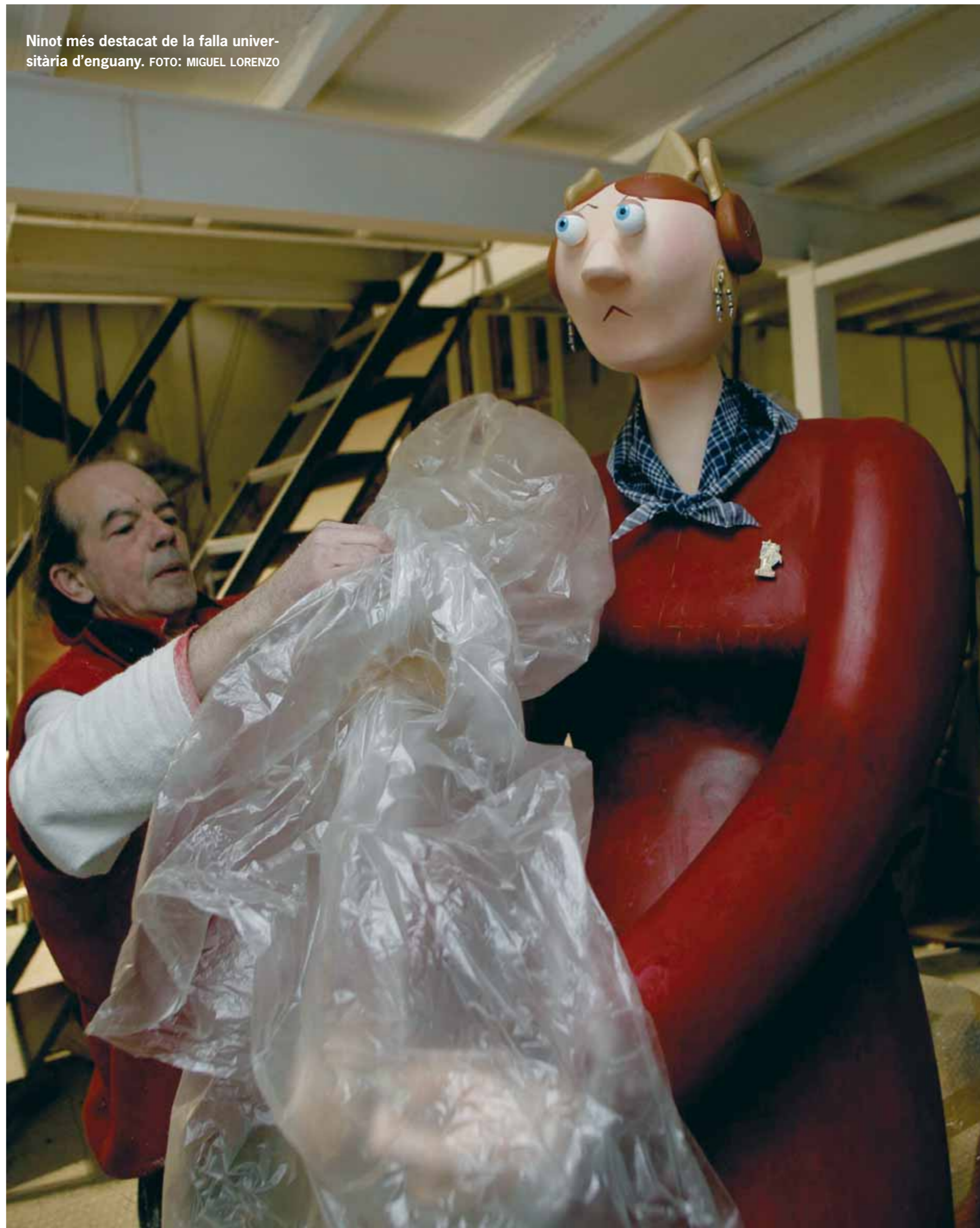
Ninot més destacat de la falla universitària d'enguany.

Dia 19 de març a les 19 hores. Cavalcada del Foc, organitzada per la Junta Central Fallera, amb l'assessorament de l'Associació d'Estudis Fallers i la Colla de Dimonis de Massalfassar. Gran desfílada-correfoc amb colles de dimonis de tot el País Valencià, la Cordà de Paterna i altres actuacions de teatre de carrer. La Cavalcada del Foc recupera i actualitza la que es va celebrar en temps de la Segona República, inspirada en el bestiar i en l'imaginari popular valencià, i té com a objecte preparar ritualment la ciutat per a la gran Nit de la Cremà de les Falles.