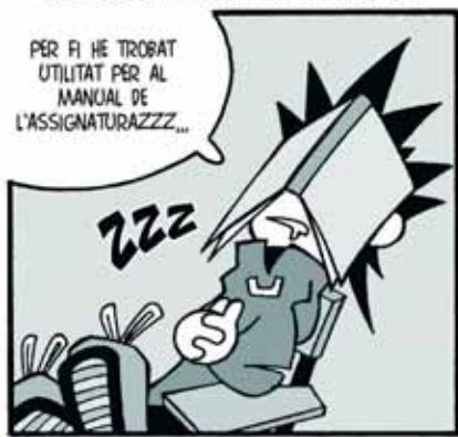
GRAU 3: ELS TEUS ALUMNES S'ADORMEN