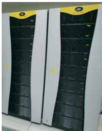
Supercomputador Cèsar de la Universitat.

El fet de disposar de suficient capacitat de càlcul és un actiu clau per al desenvolupament científic i tecnològic d'un país. El Ministeri d'Educació i Ciència ha creat la Xarxa Espanyola de Supercomputació, consistent en una estructura distribuïda de supercomputadors, per tal de donar suport a les necessitats de supercomputació dels diversos grups de recerca espanyols. Els no-