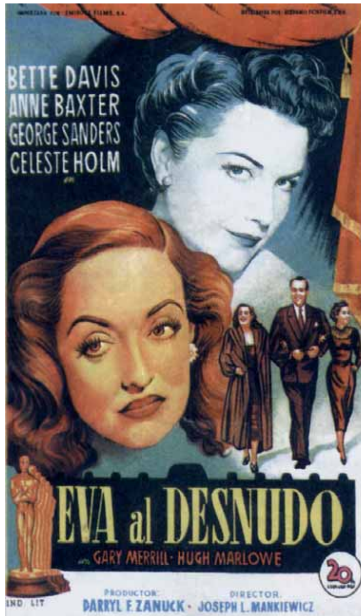
Cartell de la pel·lícula All about Eve .

CINEMA A LA NAU. També hi ha activitats a l'Aula Magna de l'edifici històric de la Nau: La memòria filmada. Fotografia i documental a Espanya (que ja s'ha realitzat); una marató surrealista (27 i 28 d'abril) per analitzar aquest corrent artístic en el cinema amb la presència d'especialistes en la matèria; unes jornades de cultura japonesa (30 d'abril, 2 i 4 de maig) que analitzen la imatge de la dona; i una visió sobre els paral·lelismes entre cinema i literatura: La memòria dels llocs , l'espai com