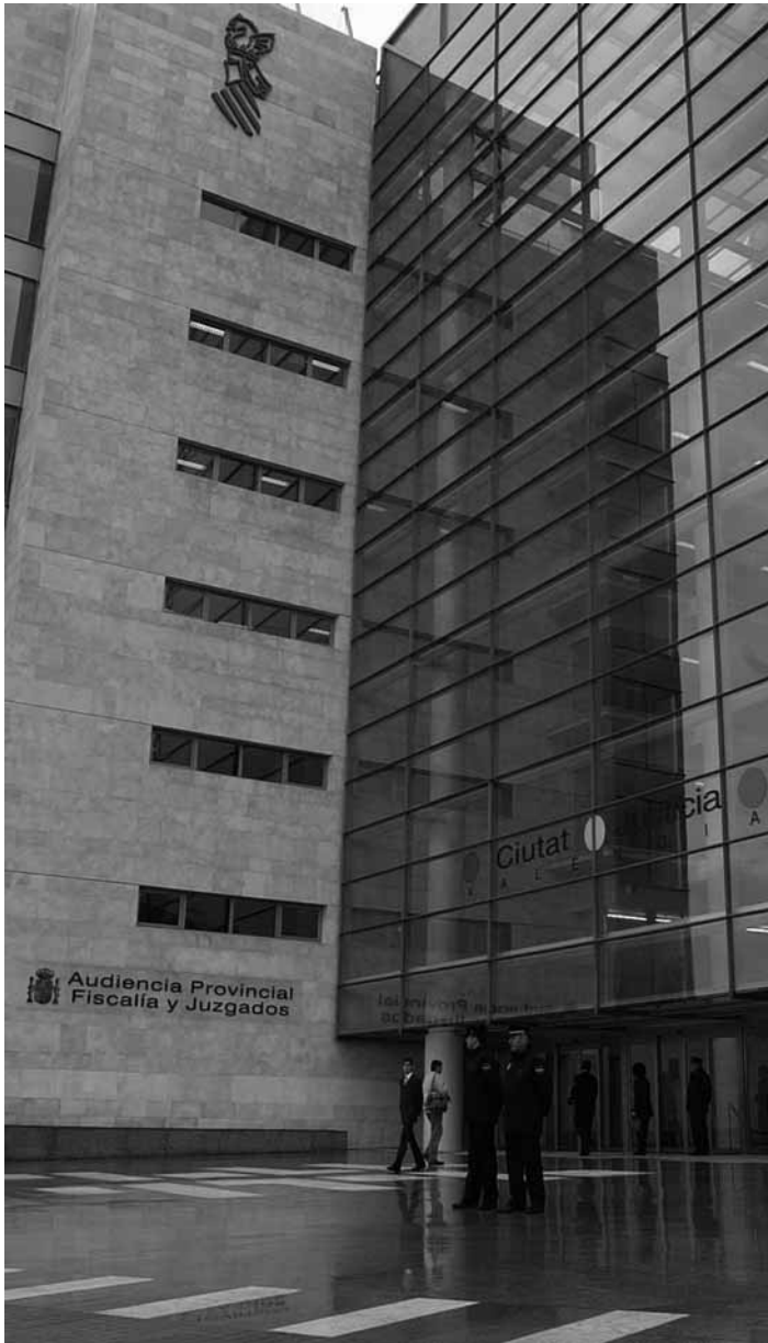
Imatge de la Ciutat de la Justícia.

La sentència absolutòria reconeix que hi havia un enfrontament ideològic entre les dues parts, cosa que incidí en l'arbitrarietat a l'hora d'assenyalar els encausats. La jutgessa destaca la falta de proves, així com les contradiccions en els testimonis acusadors.