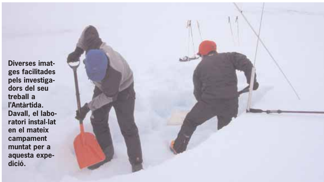
Diverses imatges facilitades pels investigadors del seu treball a l'Antàrtida. Davall, el laboratori instal·lat en el mateix campament muntat per a aquesta expedició.