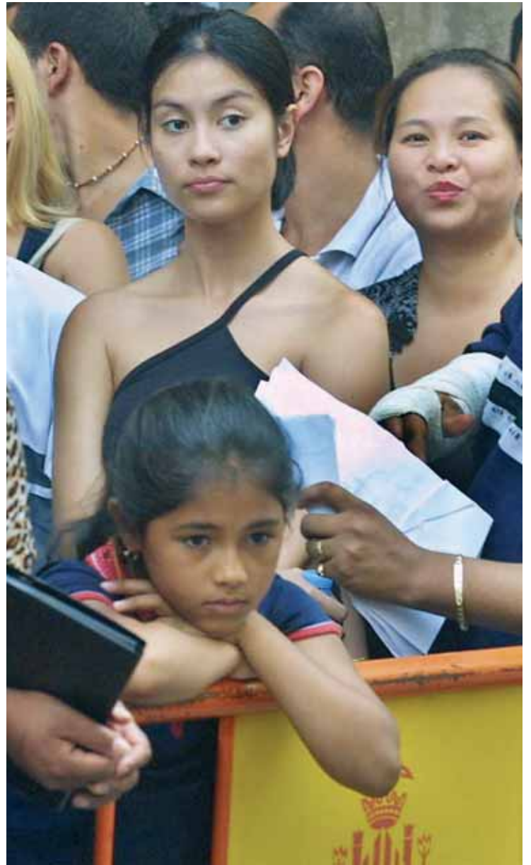
Imatge d'arxiu d'una cua d'immigrants per a regularitzar papers.

Tots els participants en el congrés tenen a la seua disposició una oferta lúdica intercultural, que va des dels tradicionals sons medievals valencians fins els ritmes africans, espectacle de l'Índia, dansa hindú, ritmes llatino-americanos... A més d'un passeig pel barri de Russafa, lloc on es constata la presència del flux migratori a València.