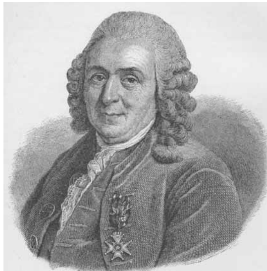
Carl von Linné.

Les activitats previstes pel Botànic per als dies de Pasqua al voltant d'aquest tema es desenvoluparan el dimarts dia 10, dimecres 11, dijous 12 i divendres 13 d'abril. L'horari serà de 10 a 14 hores. El preu de tota la setmana és de 72 euros, però per als que preferisquen participar dies solts