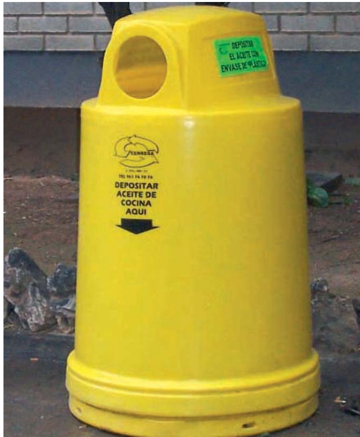
Contenidor per a reciclar oli, ubicat a Burjassot.

L'empresa gestora, Cenresa, una vegada filtrat, transporta l'oli fins la planta de Reciclatge d'Olis i Greixos SL a Reus, per a la fabri-