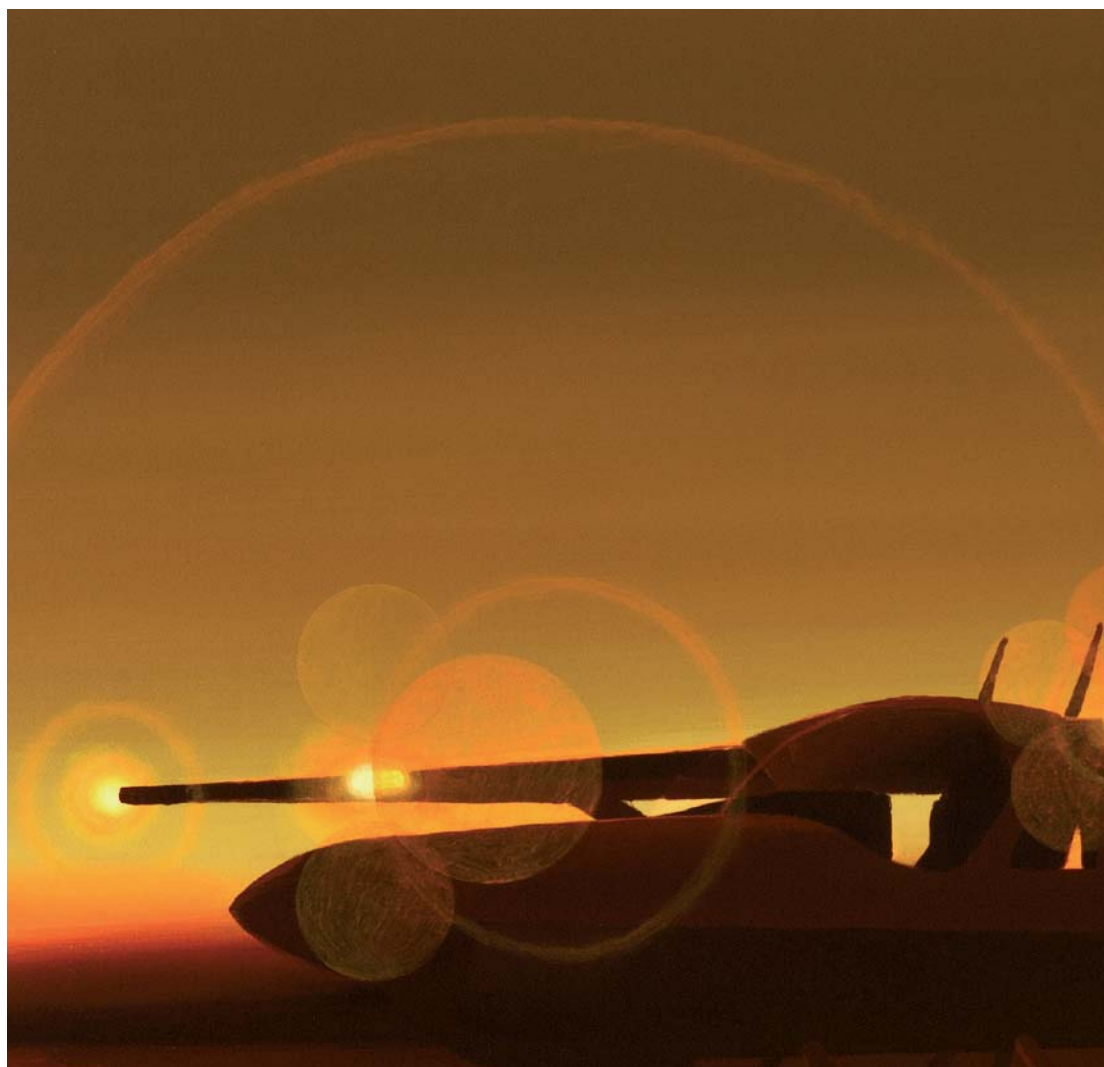
Dues imatges potents de l'exposició de Joël Mestre al Rector Peset.

Linaje (Galeria Isabel Ignacio de Sevilla, 2006).