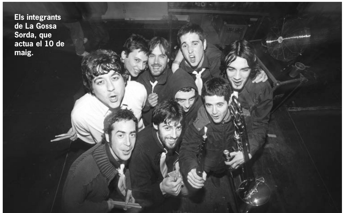
Els integrants de La Gossa Sorda, que actua el 10 de maig.

Un dels principals atractius de la Setmana és l'obra teatral Non