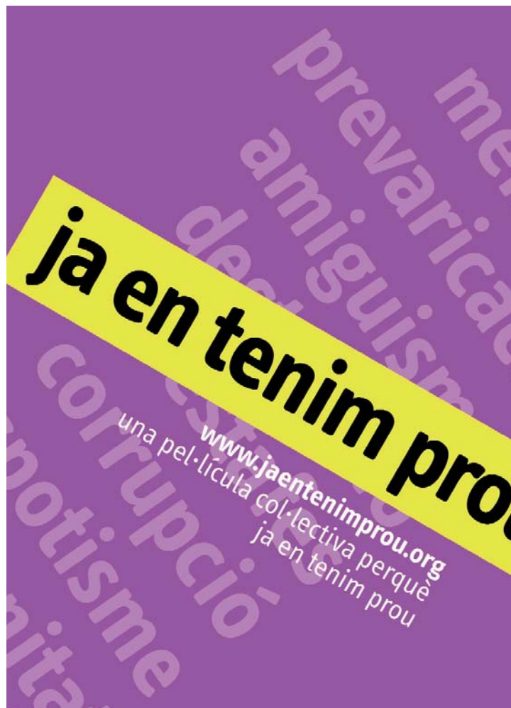
Cartell de promoció del documental.

Aquestes consideracions porten el rector a demanar a la Junta