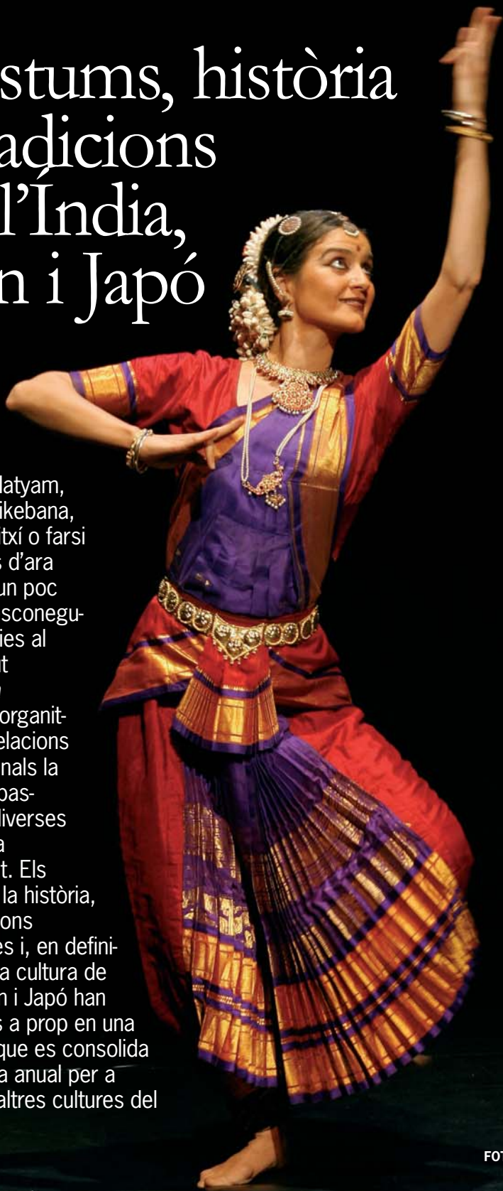
Una ballarina de dansa bhangra.

Bharata Natyam, bhangra, ikebana, kendo, taitxí o farsi seran des d'ara paraules un poc menys desconegudes, gràcies al recorregut D'Orient a Occident organitzat per Relacions Internacionals la setmana passada en diverses seus de la Universitat. Els costums, la història, les tradicions mil·lenàries i, en definitiva, la rica cultura de l'Índia, Iran i Japó han estat més a prop en una iniciativa que es consolida com a cita anual per a conèixer altres cultures del món.