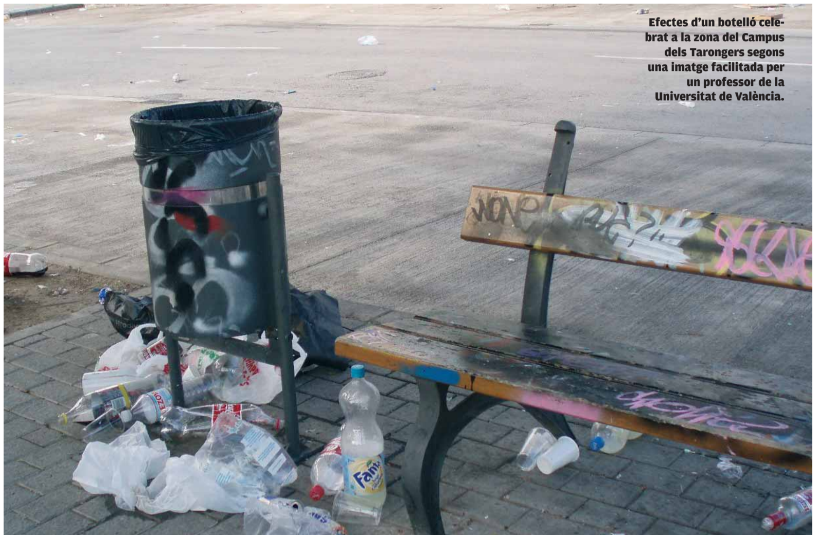
Efectes d'un botelló celebrat a la zona del Campus dels Tarongers segons una imatge facilitada per un professor de la Universitat de València.

L'estudi no deixa dubte sobre una altra qüestió: els alcohòlics són malalts que experimenten un desig constant de prendre alcohol. Aquesta dependència és curable, però necessita d'ajuda i de molt d'esforç per part del