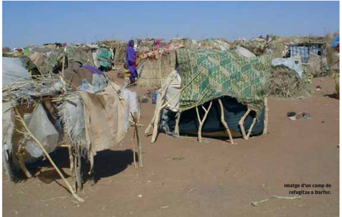
Imatge d'un camp de refugitats a Darfur.

Estudiants Sense Fronteres ha volgut "atraure l'atenció de l'opinió pública valenciana i especialment dels joves universitaris per aquestes catàstrofes humanitàries" i, amb aquest objectiu, va organitzar el que ha estat el seu primer acte com a ONG al campus de la Universitat de València. La jornada de debat Conflictes Oblidats es va celebrar el passat dia 26 d'octubre al Col·legi Major Lluís Vives, amb un enorme èxit d'assistència i un alt nivell d'exposició a càrrec dels seus participants. Una plausible