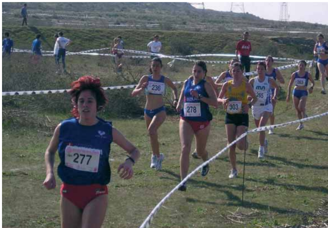
Un dels nous màsters tractarà sobre el rendiment esportiu.