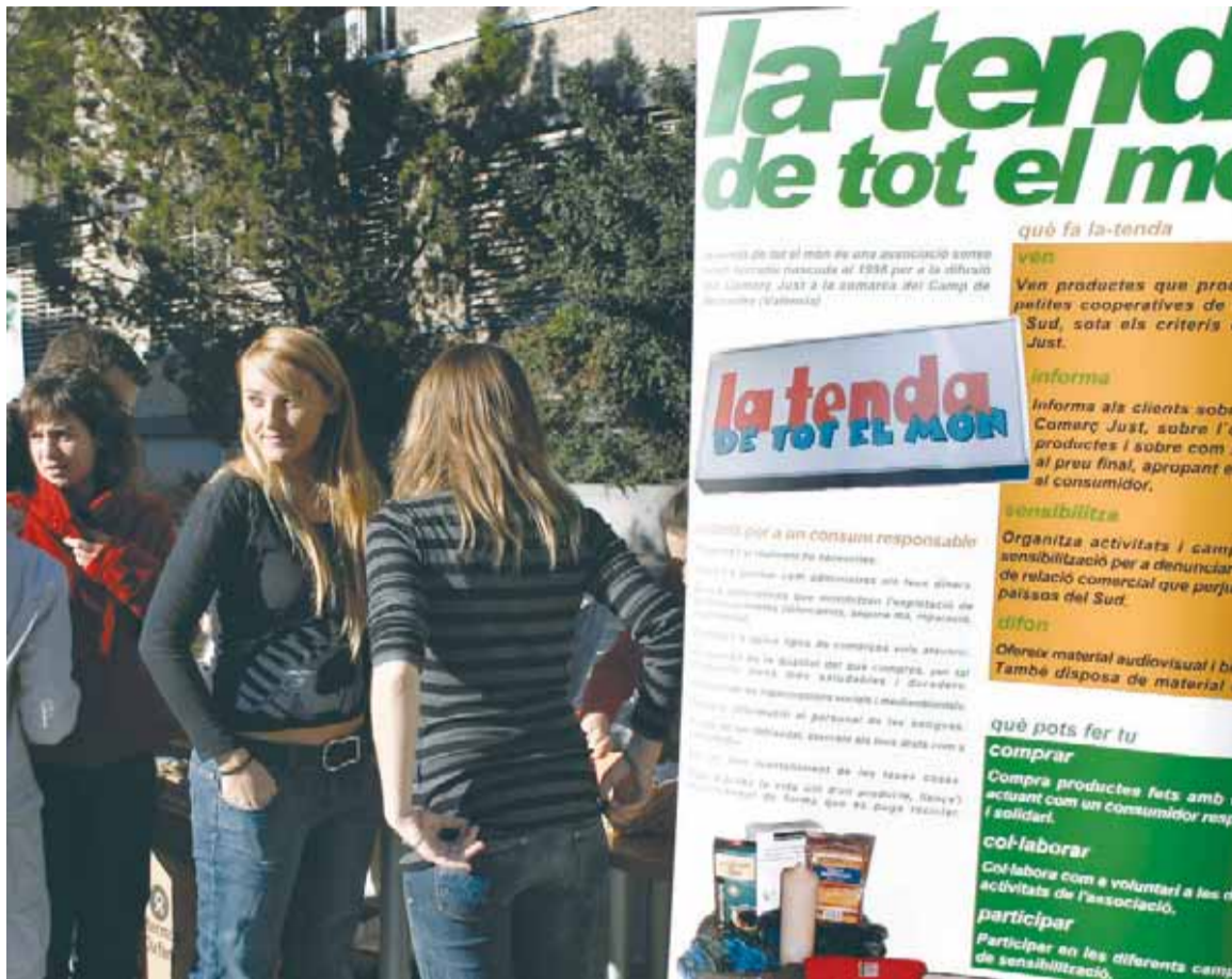
Estudiants visiten els panells dissenyats per a la Setmana del Medi Ambient.