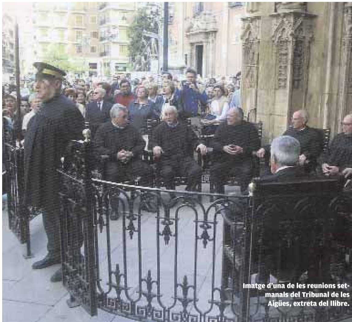
Imatge d'una de les reunions setmanals del Tribunal de les Aigües, extreta del llibre.

DVD DE LA FCAFE. El Taller d'Audiovisuals de la Universitat de València ha realitzat el primer devedé informatiu d'un centre de la institució. Es tracta del dedicat a la Facultat de Ciències de l'Activitat Física i l'Esport. El devedé va estar presentat el passat dimarts en un acte a la Facultat de Ciències de l'Activitat Física i l'Esport. Es pot consultar en l'adreça mms://147.156.41.66/IN-cen_fcafe-val .