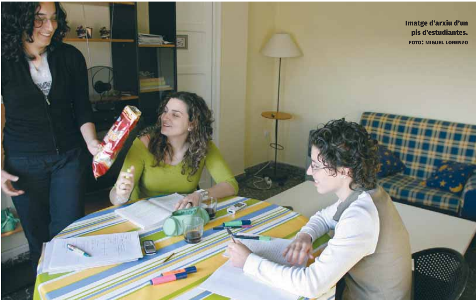
Imatge d'arxiu d'un pis d'estudiantes.

INICIATIVA. Acció-Vivenda proposa als estudiants la possibilitat de compartir pis