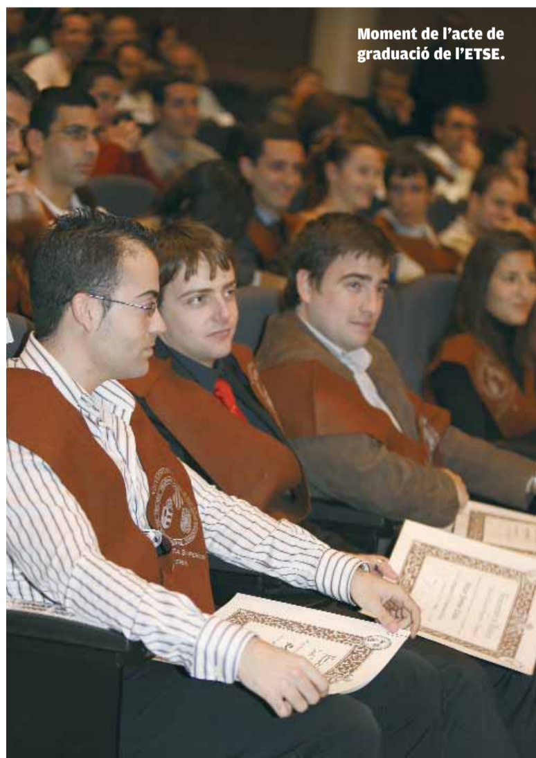
Moment de l'acte de graduació de l'ETSE.

■ L'ETSE va entregar uns premis que estan patrocinats pel Rotary i pel Col·legi Oficial d'Enginyers