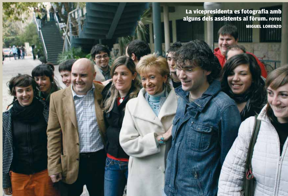
La vicepresidenta es fotografia amb alguns dels assistents al fòrum.

Posteriorment, el rector va presentar al president els membres de l'equip de direcció de la Universitat de València i Francisco Camps va signar en el llibre d'honor. La visita del president va acabar amb una reunió al despatx del rector.