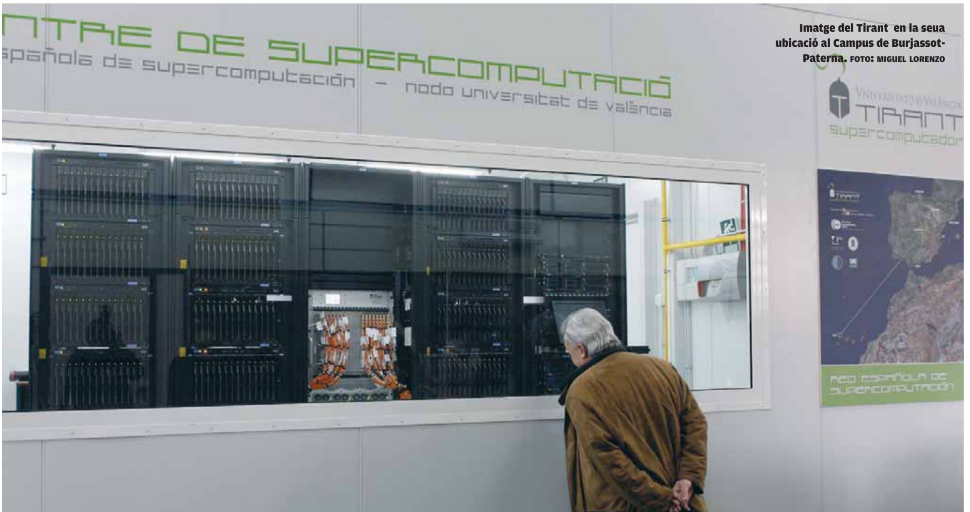
Imatge del Tirant en la seua ubicació al Campus de Burjassot-Paterna.

INFORMÀTICA. Inaugurat un superordinador capaç de fer 4,5 bilions de càlculs per segon