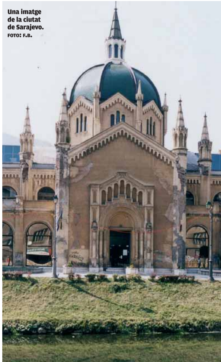
Una imatge de la ciutat de Sarajevo.

Segons els organitzadors de la Setmana, la península balcànica constitueix un dels racons "més atractius, suggeridors i diversos, però també més desconeguts -més sotmesos als tòpics i estereotips negatius- de tot Europa". Les distàncies geogràfiques i culturals que han separats balcànics i espanyols, continuen els promotors, "són cosa del passat, i ho seran més encara quan es completarà la integració d'aquells països en la Unió Europea".