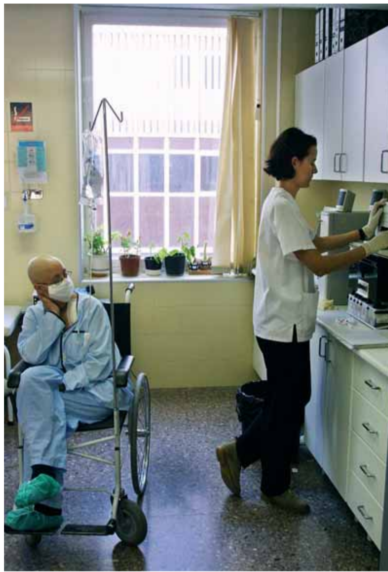
Un pacient espera ser atès, en una imatge d'arxiu.

La nova seu estarà situada enfront de l'antic heliport (davant del pavelló C). La superfície de la parcel·la és