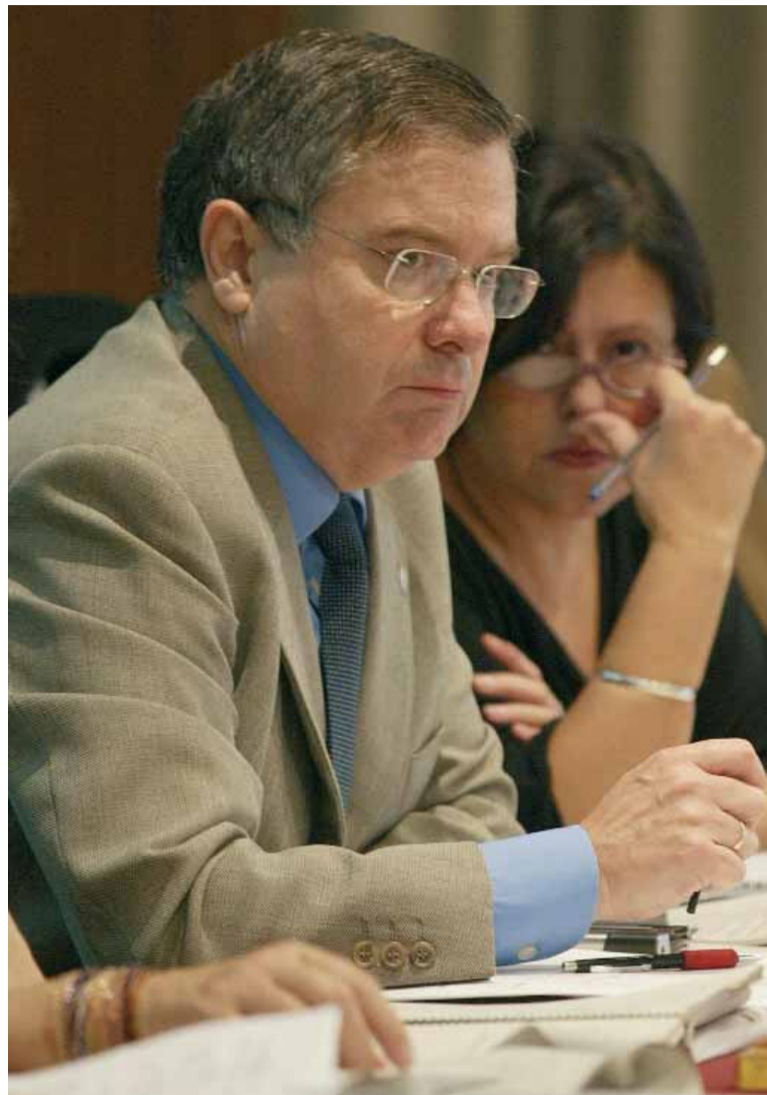
El rector, durant un Claustre, en una imatge d'arxiu.

El rector va eixir al pas de les crítiques d'alguns mitjans de comunicació que parlaven d'un suposat sobrefinançament de les universitats valencianes. En aquesta línia va oferir dades sobre la inversió pública,