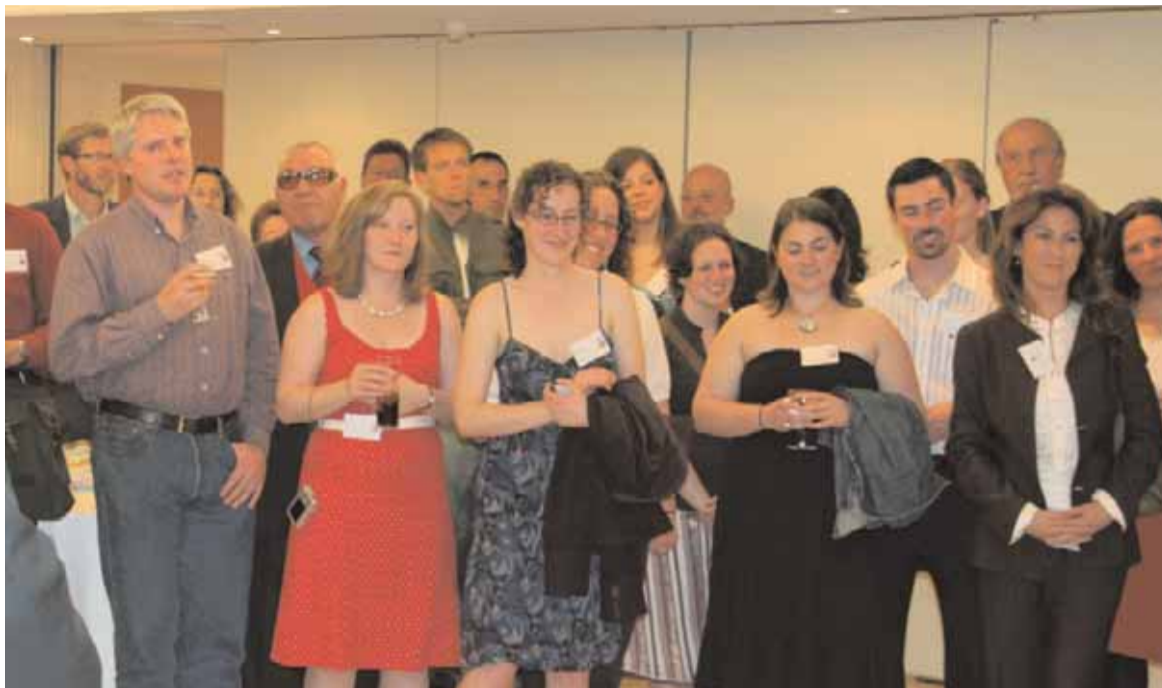
Una imatge de la festa dels becaris Fulbright.

PROGRAMA FULBRIGHT. El Programa Fulbright és el nom pel qual es coneix la Comissió d'Intercanvi Cultural, Educatiu i Científic entre Espanya i els Estats Units d'Amèrica. Aconseguir una beca Fulbright va ser el somni de molts universitaris, sobretot en els anys de sequera de beques a Espanya. No eren només els diners, sinó el prestigi i el futur el que garantia l'assoliment d'una beca Fulbright. La relació de becaris espanyols que han destacat en les arts, les lletres, la universitat, la política,