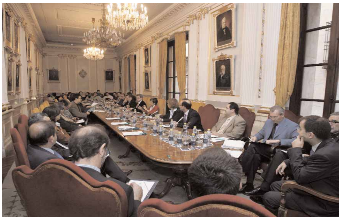
Un moment de la reunió a la sala de juntes de l'edifici de la Nau.