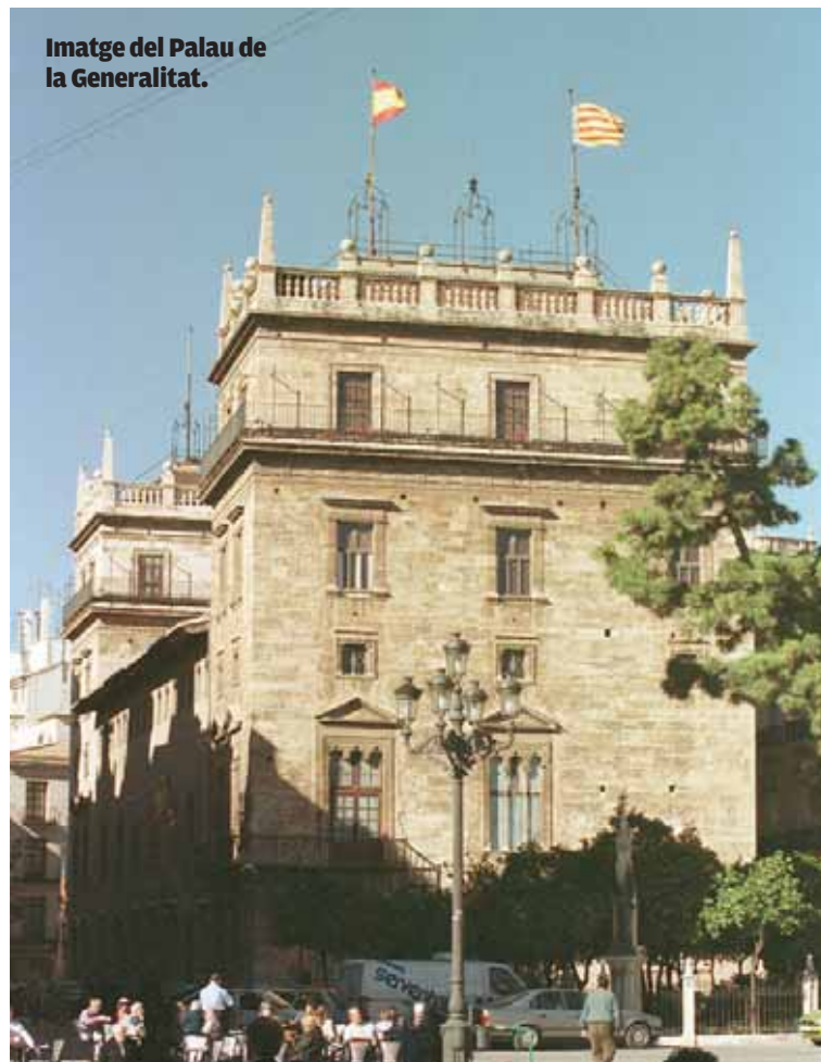
Imatge del Palau de la Generalitat.

Així mateix, el rector ha indicat que els rectors de les cinc universitats públiques han demanat una entrevista amb el president de la Generalitat, Francisco Camps, amb caràcter d'urgència per a dissipar qualsevol dubte sobre el compliment dels acords signats amb el Govern valencià i poder tranquil·litzar la comunitat universitària.