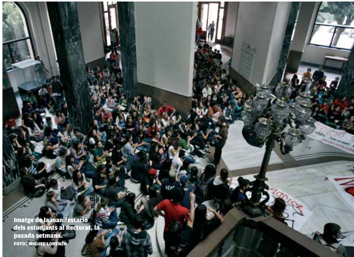
Imatge de la manifestació dels estudiants al Rectorat, la passada setmana.

Entre les raons que els han dut a iniciar aquestes actuacions els estudiants mobilitzats exposen que aquest és "un procés imposat en el qual s'ha negat la participació al conjunt de la comunitat universitària i especialment als estudiants en particular", tal com expliquen des de l'Assemblea de Tarongers. Els estudiants demanen com a primera mesura la convocatòria d'un referèndum vinculant on puguen participar