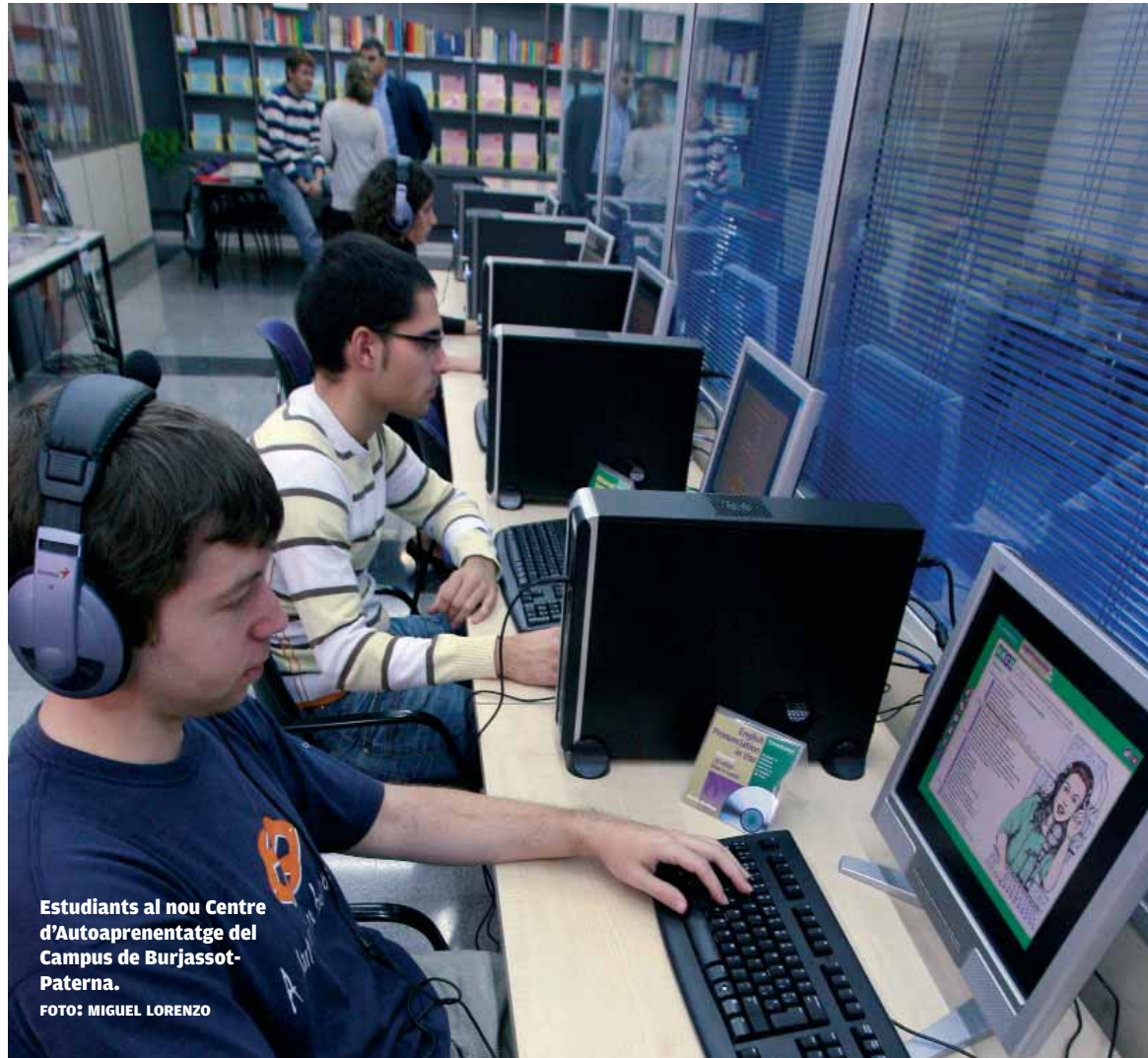
Estudiants al nou Centre d'Autoaprenentatge del Campus de Burjassot-Paterna.

L'ESPERIT DE BOLONYA. La idea emana del famós procés de Bolonya i