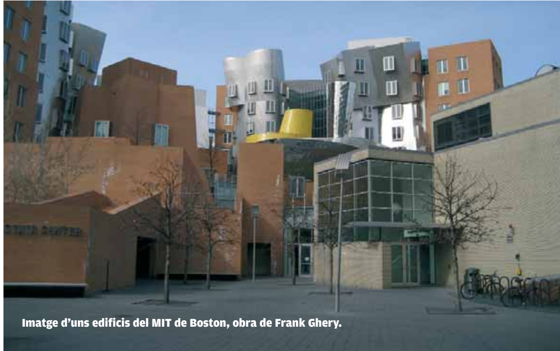
Imatge d'uns edificis del MIT de Boston, obra de Frank Gehry.

Després de mesos de treball, els primers resultats han estat bastant esperançadors, demostrant-se que