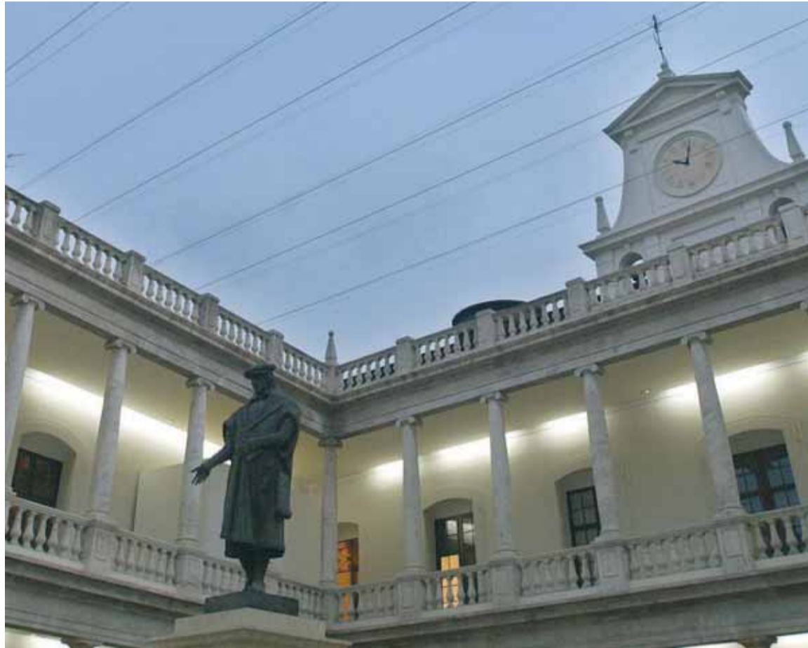
Imatge de l'edifici històric de la Universitat del carrer de la Nau.

Les inversions directes es redueixen (-10,66%) i comprenen les previsions per atendre les obres en curs.