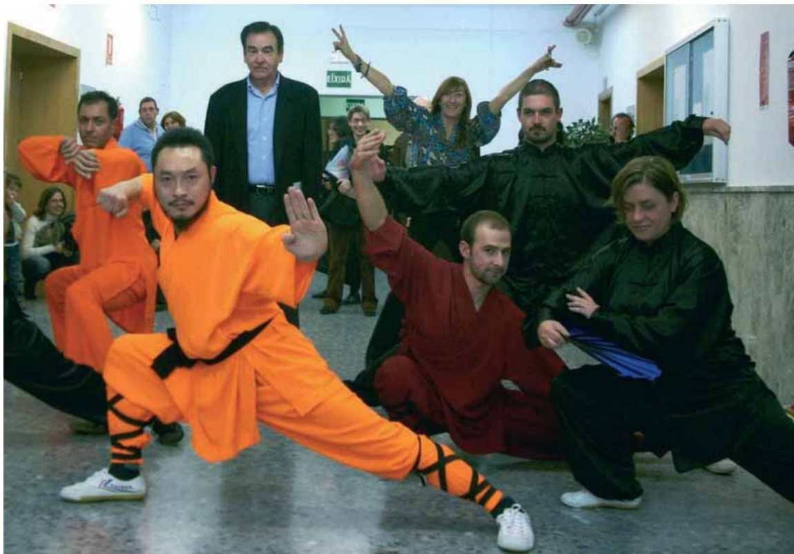
Una exhibició d'arts marçials durant la celebració del primer aniversari de l'Institut Confuci.