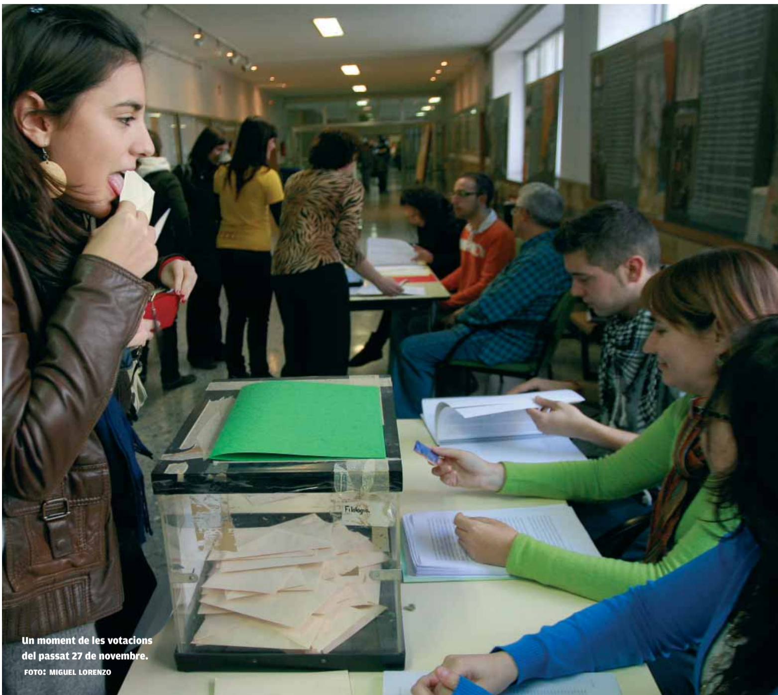
Un moment de les votacions del passat 27 de novembre.

se situava així en el 12,45%, pràcticament idèntic al dels últims comicis: 12,62%.