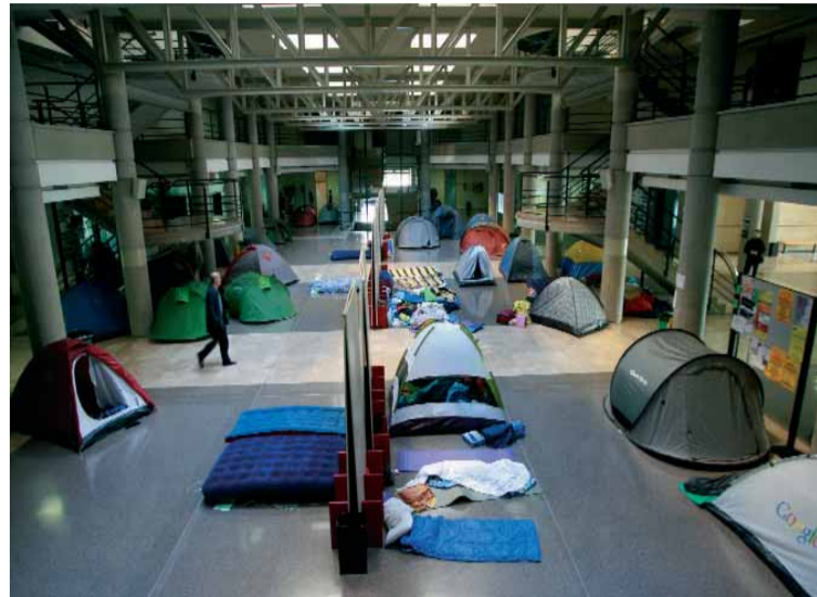
Imatge d'una de les acampades dels estudiants antiBologna.

Segons la versió del degà, les esmentades persones intentaven entrar a la facultat sense identificar-se. Per això els membres de seguretat del centre els van prohibir l'accés. Cada vegada que els professors intentaven abandonar el recinte, els concentrats pretenien accedir-hi de manera agressiva. La situació es va prolongar durant quasi una hora, fins que el degà va optar per demanar l'ajuda de la policia per tal que es permetera abandonar el recinte als set