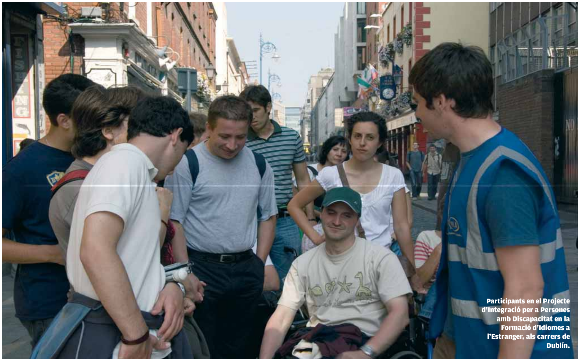
Participants en el Projecte d'Integració per a Persones amb Discapacitat en la Formació d'Idiomes a l'Estranger, als carrers de Dublín.

VOLUNTARIAT. Un grup d'estudiants va viatjar a Dublín amb alumnes discapacitats per ajudar-los amb l'anglès