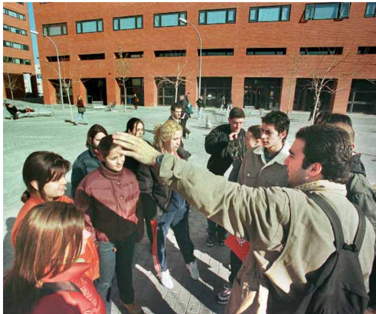
Estudiants del programa Conéixer, en una foto d'arxiu.