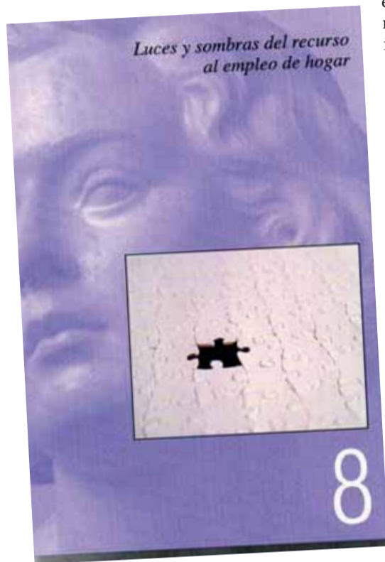
Portada del llibre.

rístiques de les àrees receptores que actuen d'efecte "crida", com els canvis sociodemogràfics i les implicacions que aquest corrent migratori té sobre el model nacional d'ocupació i sobre les activitats que ocupen majoritàriament les persones immigrants de manera clarament diferenciada per raó de gènere. La creixent participació femenina en el mercat de treball, els nous models d'organització de la família, el progressiu envelliment de la població o les insuficients polítiques públiques de provisió de serveis socials, entre altres, són aspectes de les societats receptores que expliquen la geografia generitzada de les migracions internacionals.