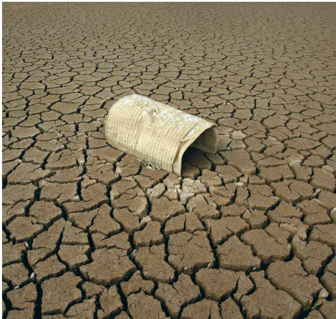
Una imatge d'arxiu d'una etapa de sequera a les comarques de Castelló.