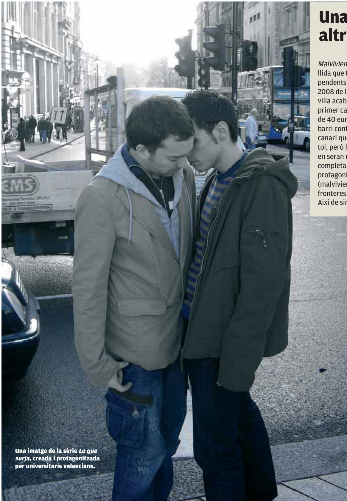
Una imatge de la sèrie Lo que surja , creada i protagonitzada per universitaris valencians.