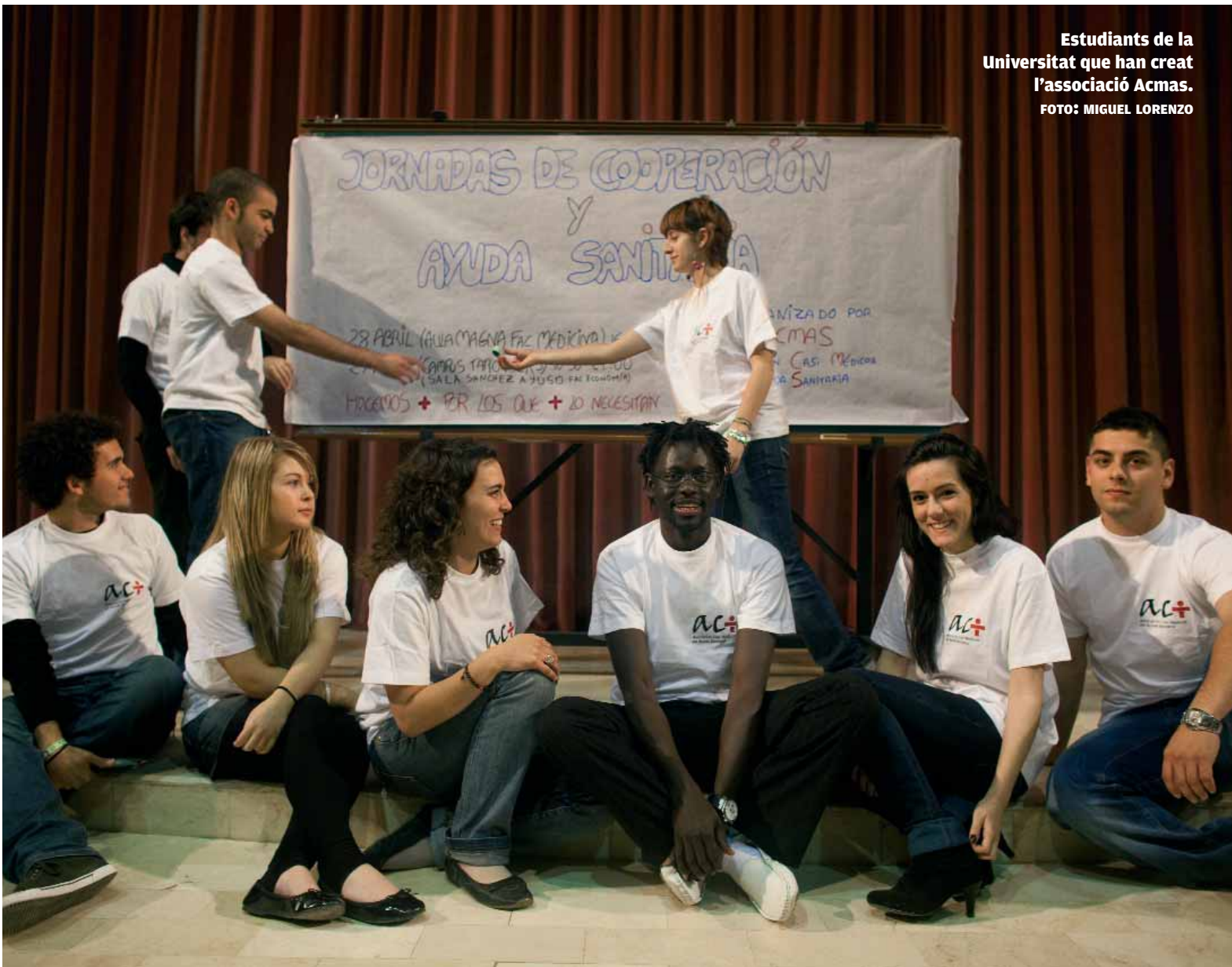
Estudiants de la Universitat que han creat l'associació Acmas.