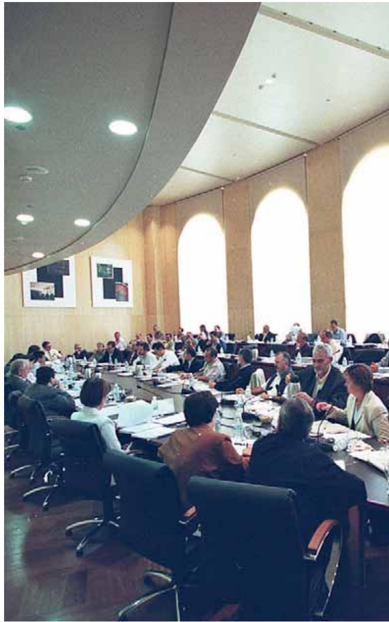
Una anterior reunió del Consell de Govern.

El gerent de la Universitat va explicar que, a causa d'aquests retards, la Universitat ha hagut de forçar al màxim la seua capacitat d'endeutament i s'ha vist obligada a ajornar, durant alguns mesos, els seus pagaments a proveïdors, tot recorrent a operacions financeres. Oltra va assenyalar que a pesar "dels esforços de contenció de la despesa corrent per part de la Universitat reflectits en l'informe, cal advertir que aquesta situació