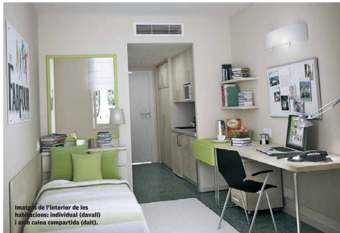
Imatges de l'interior de les habitacions: individual (davant) i amb cuina compartida (dalt).