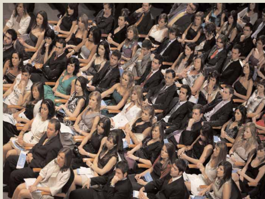
GRADUACIÓ DELS ESTUDIANTS DE MEDICINA I ODONTOLOGIA. Estudiants de la Facultat de Medicina i Odontologia van celebrar el passat dijous l'acte de llicenciatura. La cerimònia es va celebrar al Palau de la Música de València.

El seu objectiu és impulsar iniciatives emprenedores en la comunitat universitària, donant a conèixer casos de bones pràctiques promoguts des de la Universitat de València que conjuguen tecnologia i benestar, com ara els projectes d'investigació que realitza l'ERI Polibiennestar i la formació que ofereix el Màster en Domòtica i Llar Digital, així com les activitats que les empreses desenvolupen en aquest àmbit, com és el cas d'Integració Digital, juntament amb les línies de finançament i els serveis europeus de suport a les pimes.