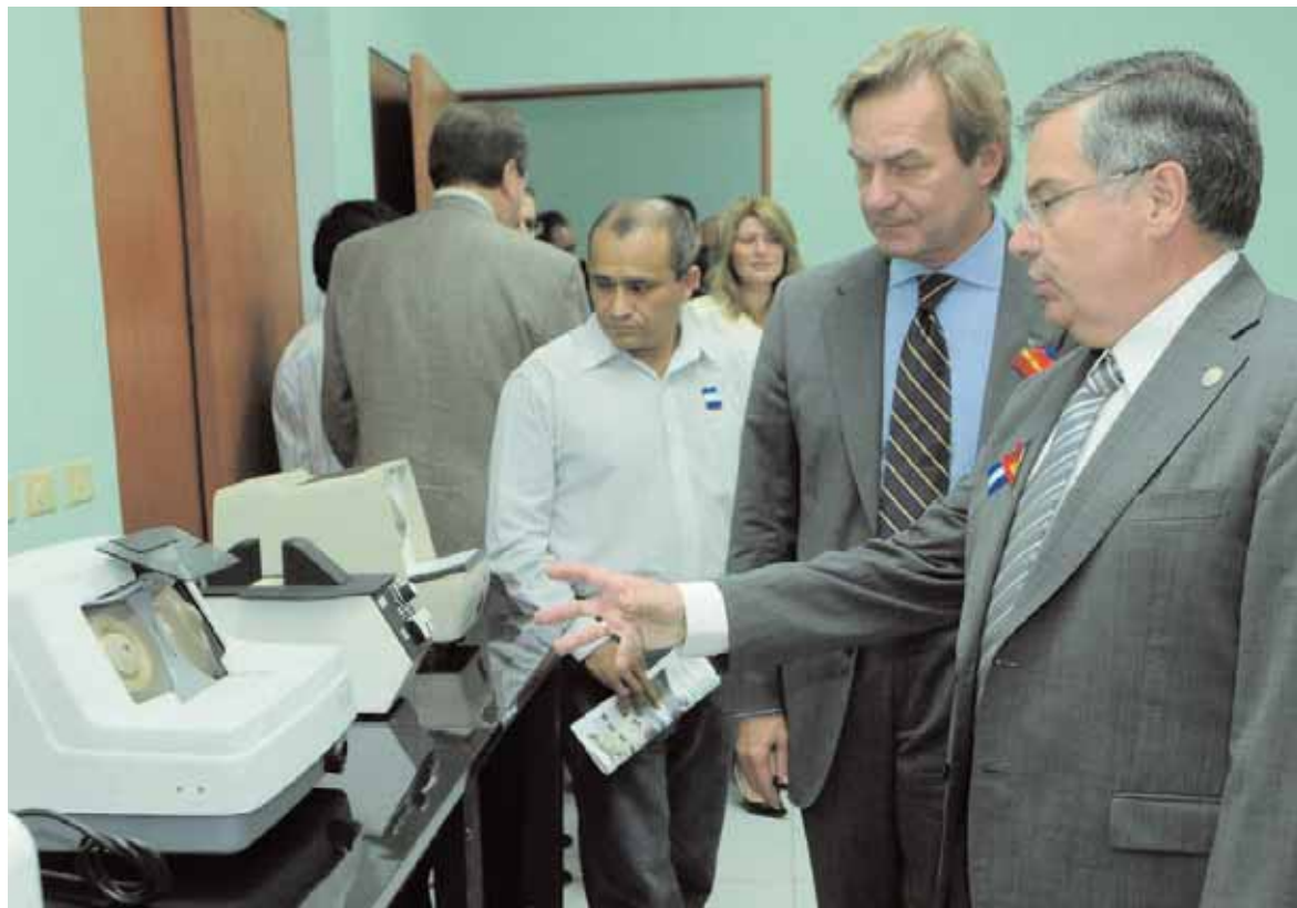
El rector durant la seua visita al Centre Auditiu i Òptic València.

El rector inaugura el Centre Òptic i Auditiu al país centreamericà