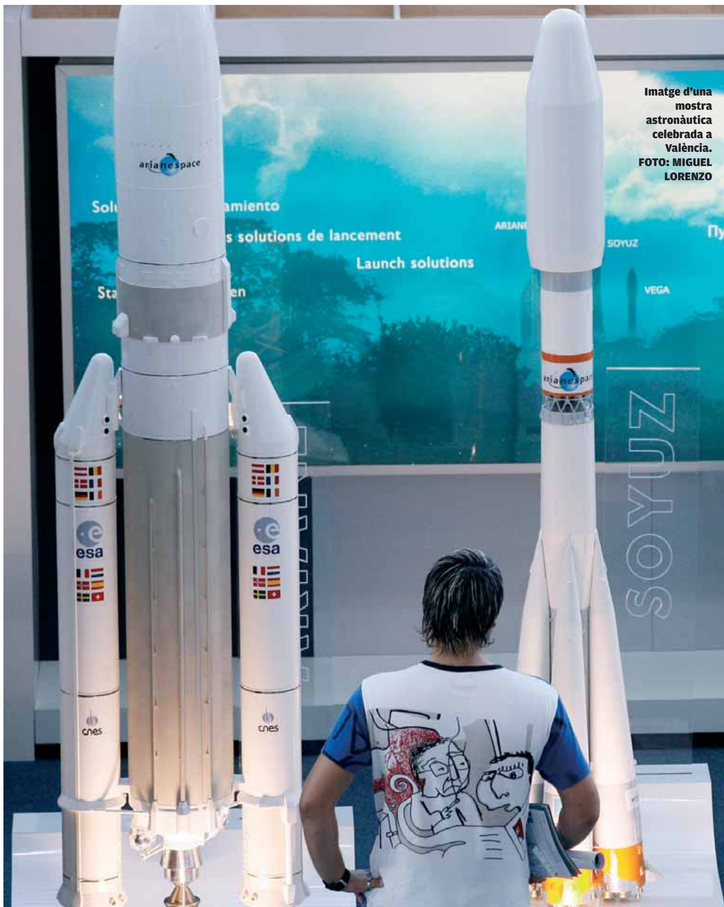
Imatge d'una mostra astronàutica celebrada a València.