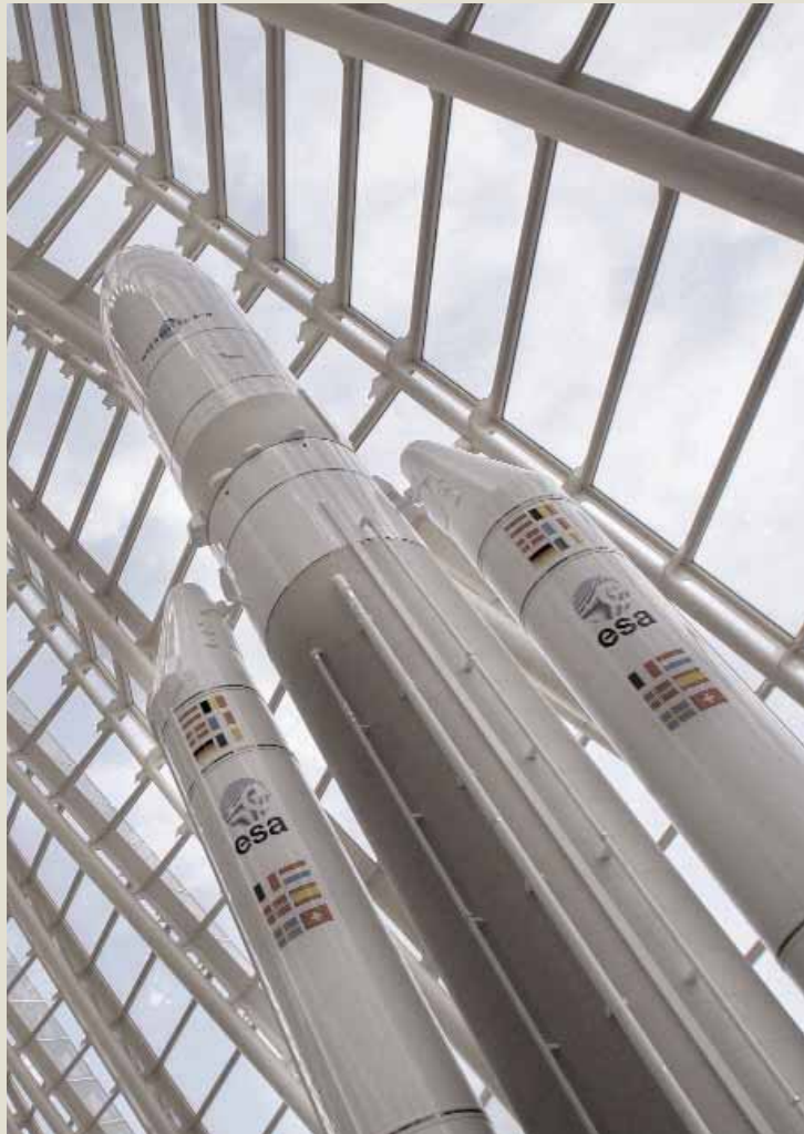
Un coet exposat en un encontre d'astronàutica en què va participar la Universitat.

Un altre acord molt rellevant del Consell de Govern de dimarts passat va ser l'aprovació del procediment d'accés a la Universitat per a majors de 40 anys mitjançant l'acreditació d'experiència laboral o professional. Aquest procediment és conseqüència d'un real decret de novembre del 2008. Per a poder accedir a la Universitat per aquest procediment és necessari complir 40 anys abans de l'1 d'octubre de l'any en què es presenten al procés de selecció; no posseir cap titulació acadèmica que habilite per accedir-hi per altres vies; estar en possessió del graduat escolar o