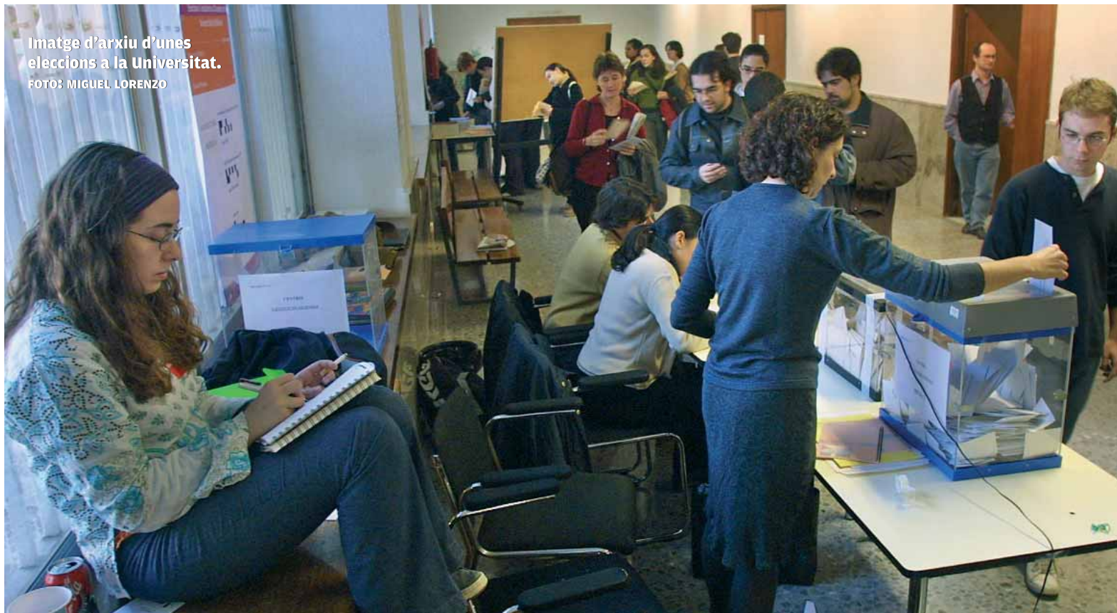
Imatge d'arxiu d'unes eleccions a la Universitat.

COMICIS. Primera setmana de campanya per als quatre candidats, que hui tornen a veure's en un debat