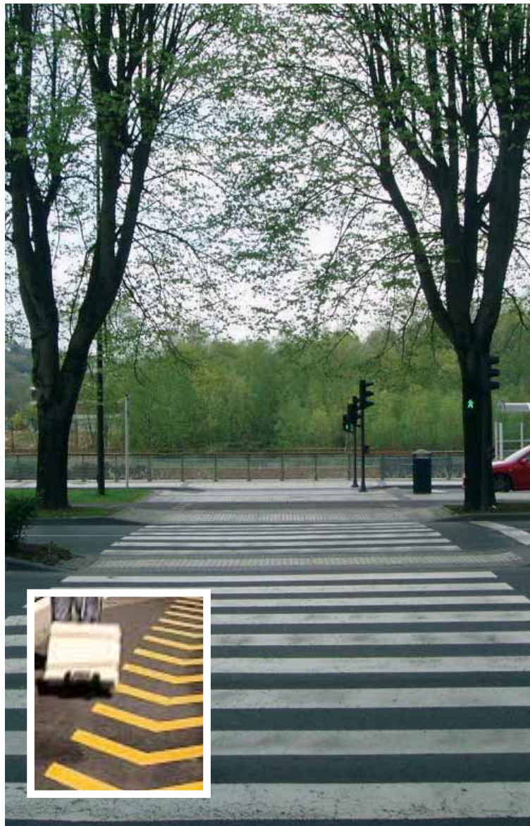
Marques viàries. En el requadre, una imatge de les marques Chevron.

Aquest tipus de senyalització viària ja ha sigut testat en trams concrets de ciutats dels Estats Units, Japó o Gran Bretanya, amb una gran