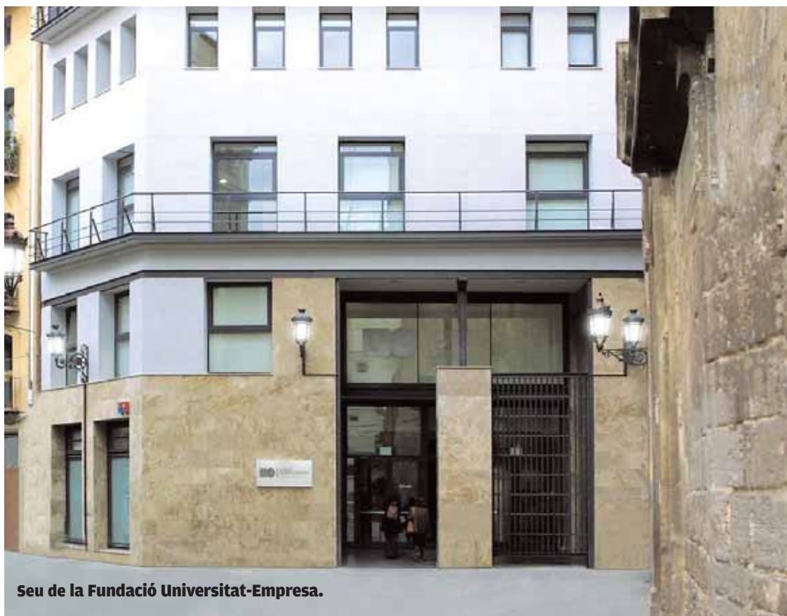
Seu de la Fundació Universitat-Empresa.

Es lloga habitació. Xic/a. Es lloga habitació en un pis amb tres dormitoris a estudiant responsable. Completament reformat amb mobiliari nou. Només no fumadors. Davant la parada de Jesús amb excel·lent connexió a les facultats a Burjassot, Tarongers, Blasco Ibáñez i Politècnica. Habitacions moblades, ample saló amb balcó, saleta menuda, bany i cuina amb electrodomèstics nous. C/Sant Rafael 40. Preu a convindre. Tel. 96 371 09 83 (Felicitats Barrio).