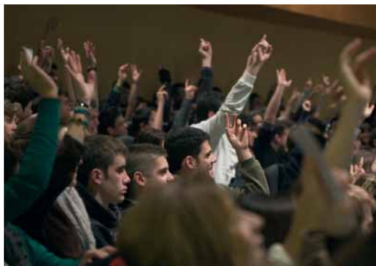
Els espectadors van estar molt participatius.