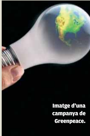
Imatge d'una campanya de Greenpeace.

El total de l'energia que es preveu consumir enguany en tots els centres de la Universitat és de més de 56.000 kWh amb un increment respecte a l'any 2009 de l'11,59% degut als nous edificis. Però amb el programa que s'ha posat ara en marxa es pretén reduir el consum fins a poc més de 51.000 kWh, i només un increment respecte a l'any anterior d'un 1,50%.