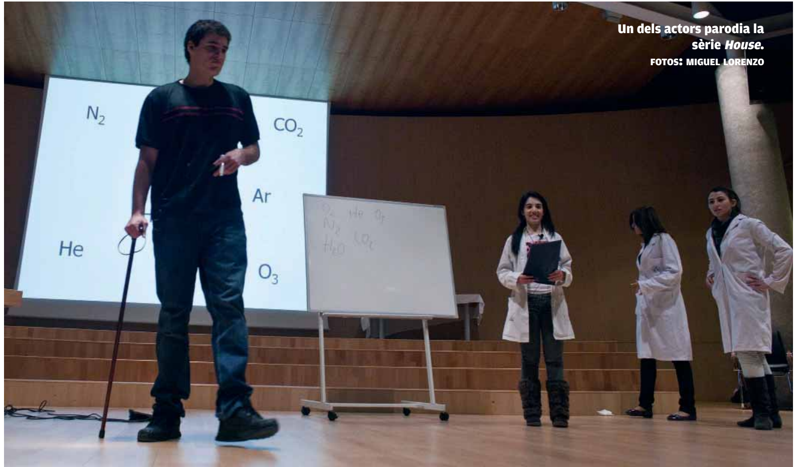
Un dels actors parodia la sèrie House .