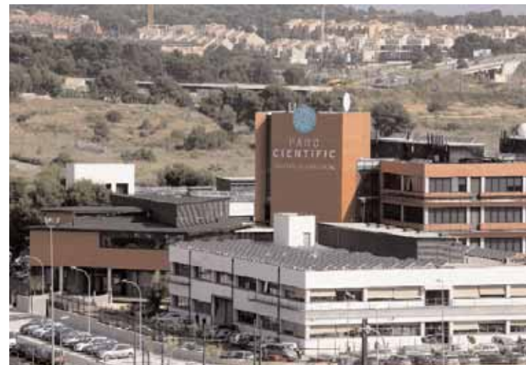
Instal·lacions del Parc Científic.

El curs és fruit de l'acord signat entre el Parc Científic i la Fundació Incyde de les Cambres de Comerç i es desenvolupa mitjançant una atenció personalitzada a les empreses a través de tutories individualitzades que ofereixen més de cent assessors d'Incyde. El programa Consolidació i Desenvolupament