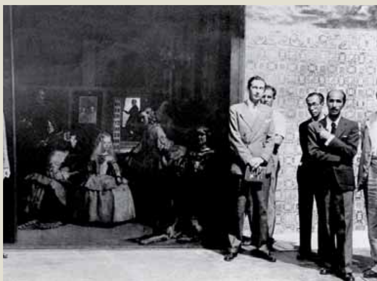
Algunes de les imatges que es podran contemplar a l'exposició sobre el patrimoni artístic espanyol salvat durant la guerra civil.

xer els espais per les fotografies de la mostra". A més, recorda que el pintor valencià Josep Renau, com a director general de Belles Arts, va crear la Junta del Tresor Artístic, l'organisme encarregat del procés d'evacuació de les obres, i conta l'anècdota que durant el trasllat del patrimoni a València es va produir l'únic accident de la forçosa evacuació: "Concretament, al camió que transportava El 2 de maig i Els afusellaments del 3 de maig , de Goya, li va caure damunt un balcó a Benicarló, com a conseqüència d'un bombardeig, i ambdós llenços van sofrir un esquinç important, però els quadres van ser restaurats a Peralada, el 1938".