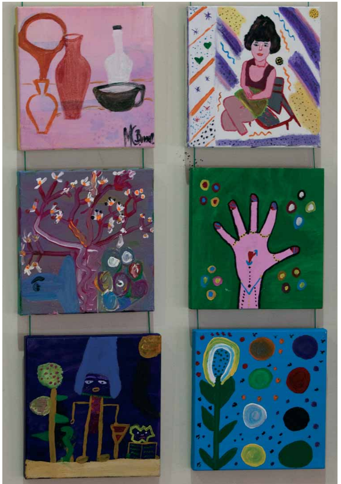
Alguns dels dibuixos exposats a Dret realitzats per dones recluses de Picassent.

Finalment, l'edifici històric de la Nau serà de nou la seu, divendres 26, de l'acte de cloenda on es tindrà l'oportunitat de gaudir de la música clàssica amb el quartet femení Adventus musicae , que interpretarà obres de dones compositoras.