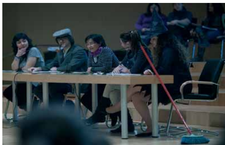
Una de les escenes imita un programa de televisió.