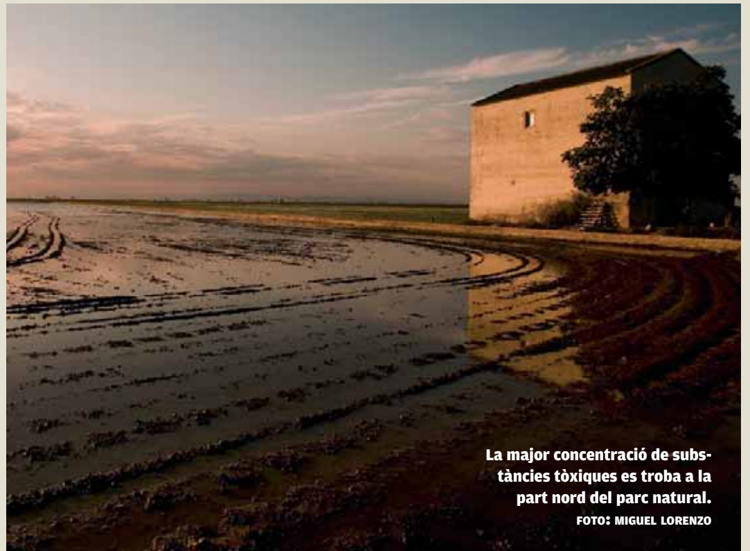
La major concentració de substàncies tòxiques es troba a la part nord del parc natural.

L'estudi alerta de conseqüències en la fauna i la salut humana