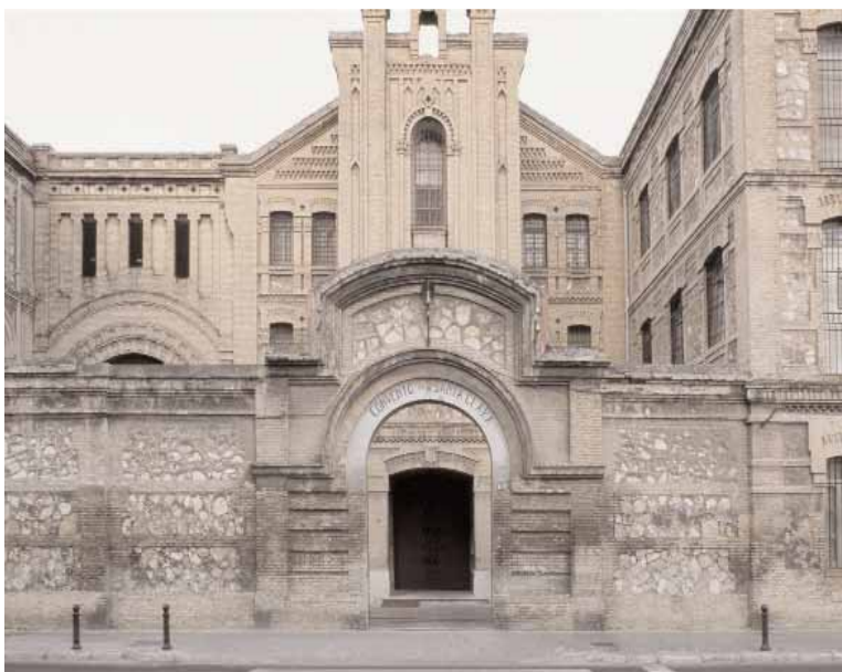
Dues de les imatges de l'exposició Cartografies silenciades .

ESPAIS DE REPRESSIÓ SILENCIATS. Així, la plaça de bous de València va ser durant uns mesos habilitada com a camp de classificació de presoners i el convent de Santa Cla-