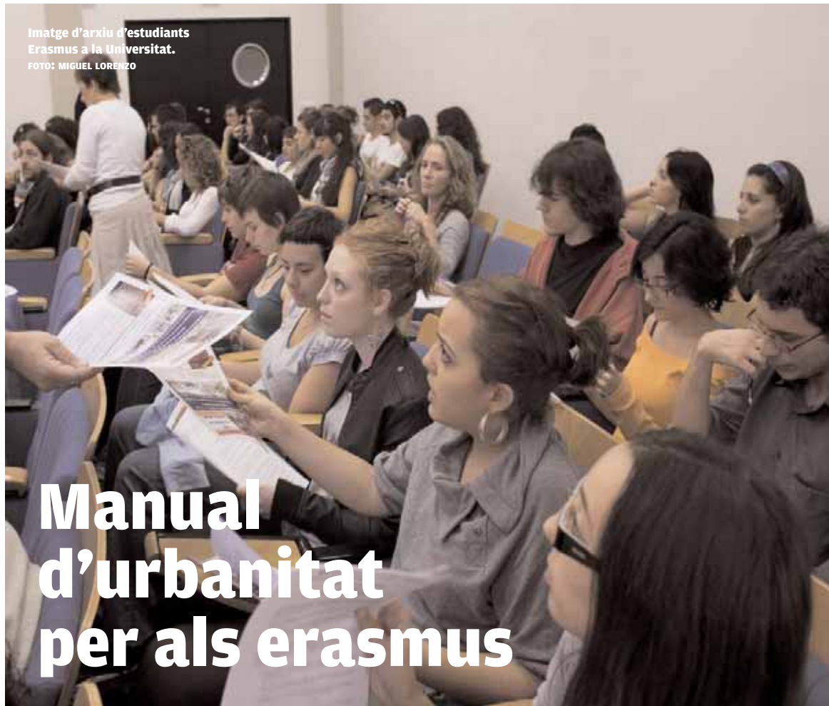
Imatge d'arxiu d'estudiants Erasmus a la Universitat.

DESCOMpte EN EL VALÈNCIA OPEN 500. La Ciutat de les Arts i les Ciències acollirà, entre el 30 d'octubre i el 7 de novembre, la segona edició del València Open 500. Els millors tennistes del moment es donaran cita novament a la ciutat. Estudiants, professors i personal d'administració i serveis de la Universitat de València gaudiran d'un 10% de descompte en la compra d'entrades per a totes les jornades del torneig, un total de tretze en nou dies. I els dies 2 i 3 de novembre tot el col·lectiu de la Universitat de València, prèvia presentació del carnet universitari, aconseguirà una entrada gratuïta comprant-ne una altra. Els dos descomptes seran aplicables únicament en les taquilles de l'Open 500, que ja estan obertes al recinte de la Ciutat de les Arts i les Ciències. Més informació: www.uv.es/sesport .