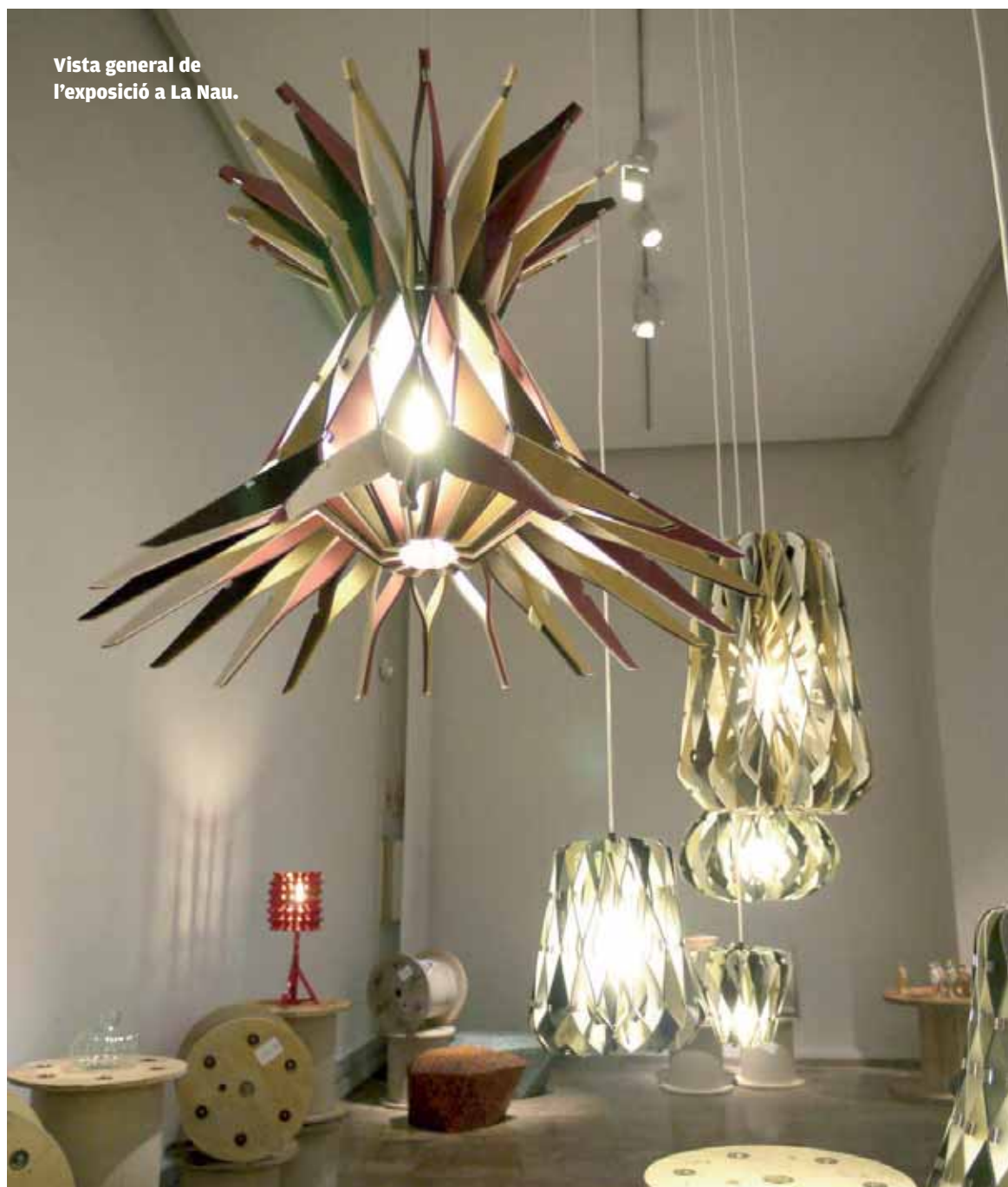
Vista general de l'exposició a La Nau.

En el si de la València Disseny Week, l'ADCV organitza, en col·laboració amb la Universitat de València, l'exposició Unint punts. Disseny llatinoamericà i disseny espanyol , que