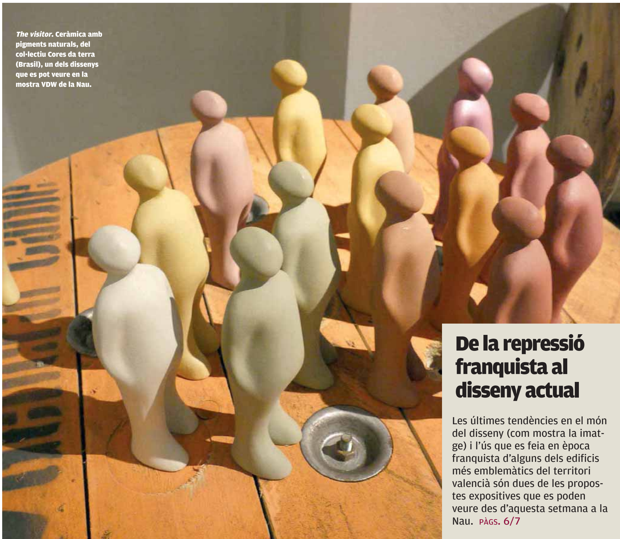
The visitor. Ceràmica amb pigments naturals, del col·lectiu Cores da terra (Brasil), un dels dissenys que es pot veure en la mostra VDW de la Nau.