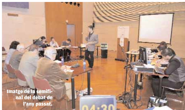
Imatge de la semifinjal del debat de l'any passat.

La competició té com a objectiu fomentar l'ús de la paraula entre l'estudiantat sota el format d'un enfrontament dialèctic entre diversos equips, en el qual s'haurà de defensar una posició a favor o en contra sobre un tema d'actualitat, on es valoraran capacitats com ara