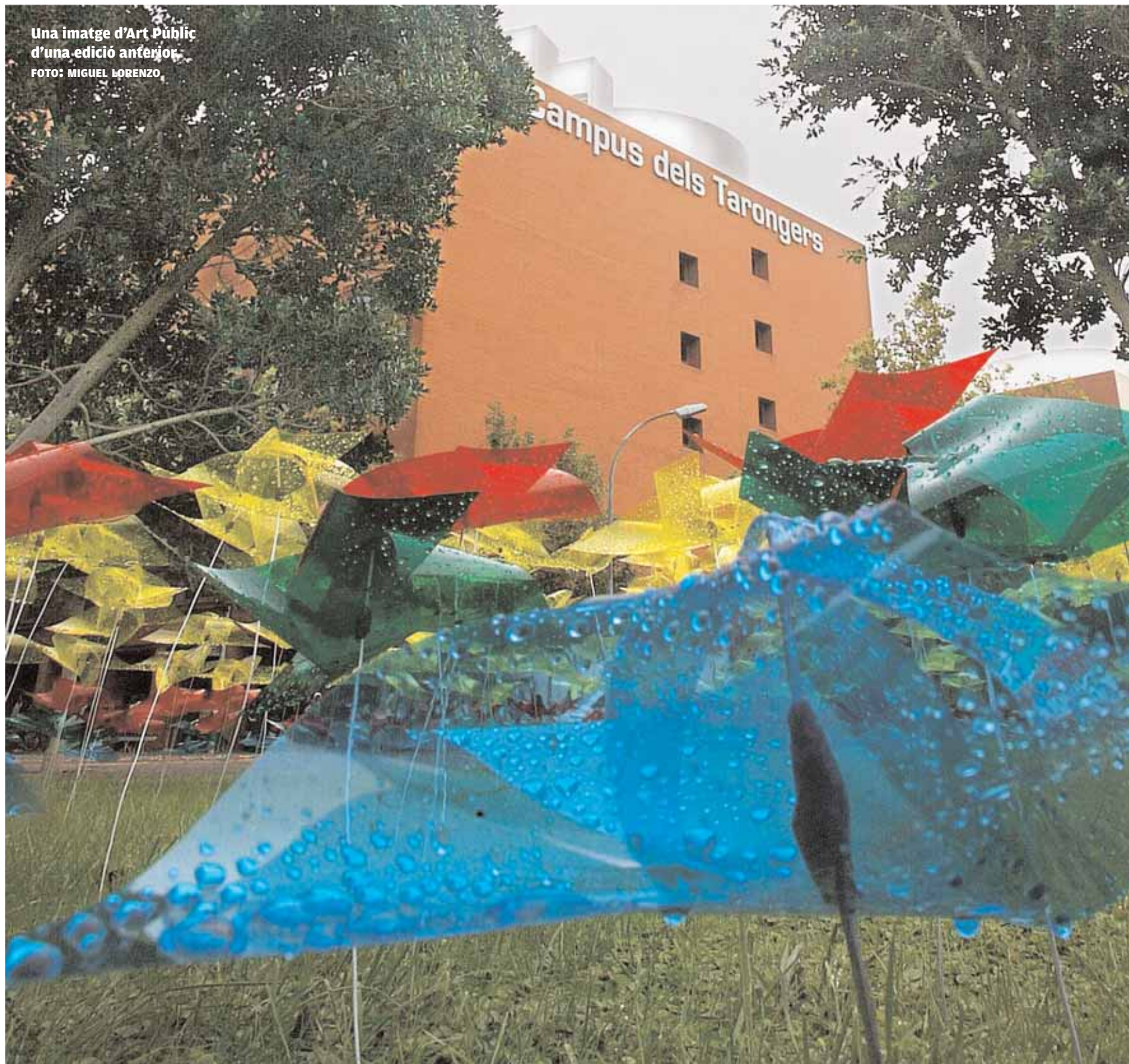
Una imatge d'Art Públic d'una edició anterior.

A més a més, també hi haurà exposicions en altres espais de la institució.