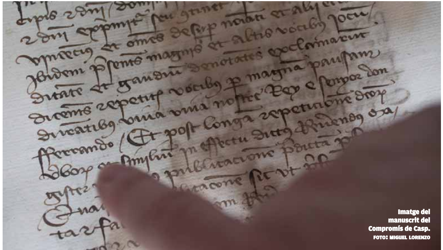
Imatge del manuscrit del Compromís de Casp.

El Servei de Biblioteques i Documentació de la Universitat de València procedirà a la seua restauració, l'objectiu primordial de la qual es ba-