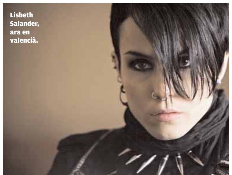
Lisbeth Salander, ara en valencià.

La programació per a les dates de les pel·lícules i les ciutats on es projecten es pot consultar en l'agenda de NOU DISE (pàg. 10 o www.uv.es/noudise ) o en la web del SPL: www.uv.es/spl .