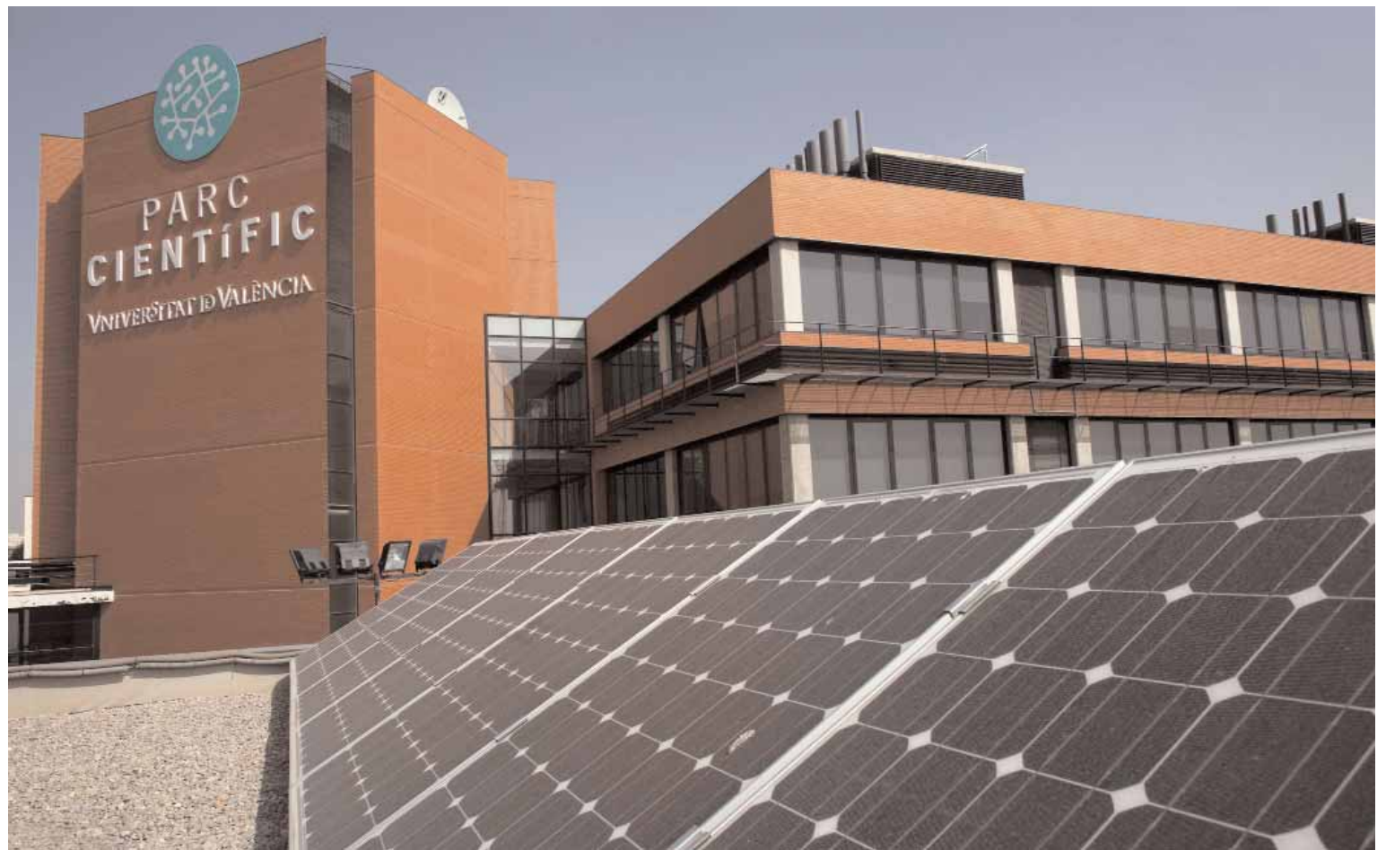
Una imatge del Parc Científic de la Universitat de València.

Les institucions incloses han estat etiquetades d'acord amb la seua excel·lència investigadora en tres nivells diferents segons l'impacte a nivell mundial de la seua producció científica. A més, s'hi ha inclòs la posició a escala mundial, regional i nacional de les institucions per producció científica -en quantitat de documents científics. Basant-se íntegrament en la dimensió investigadora de les institucions, l'Informe Mundial SIR 2010 combina quatre indicadors que revelen els nivells de pro-