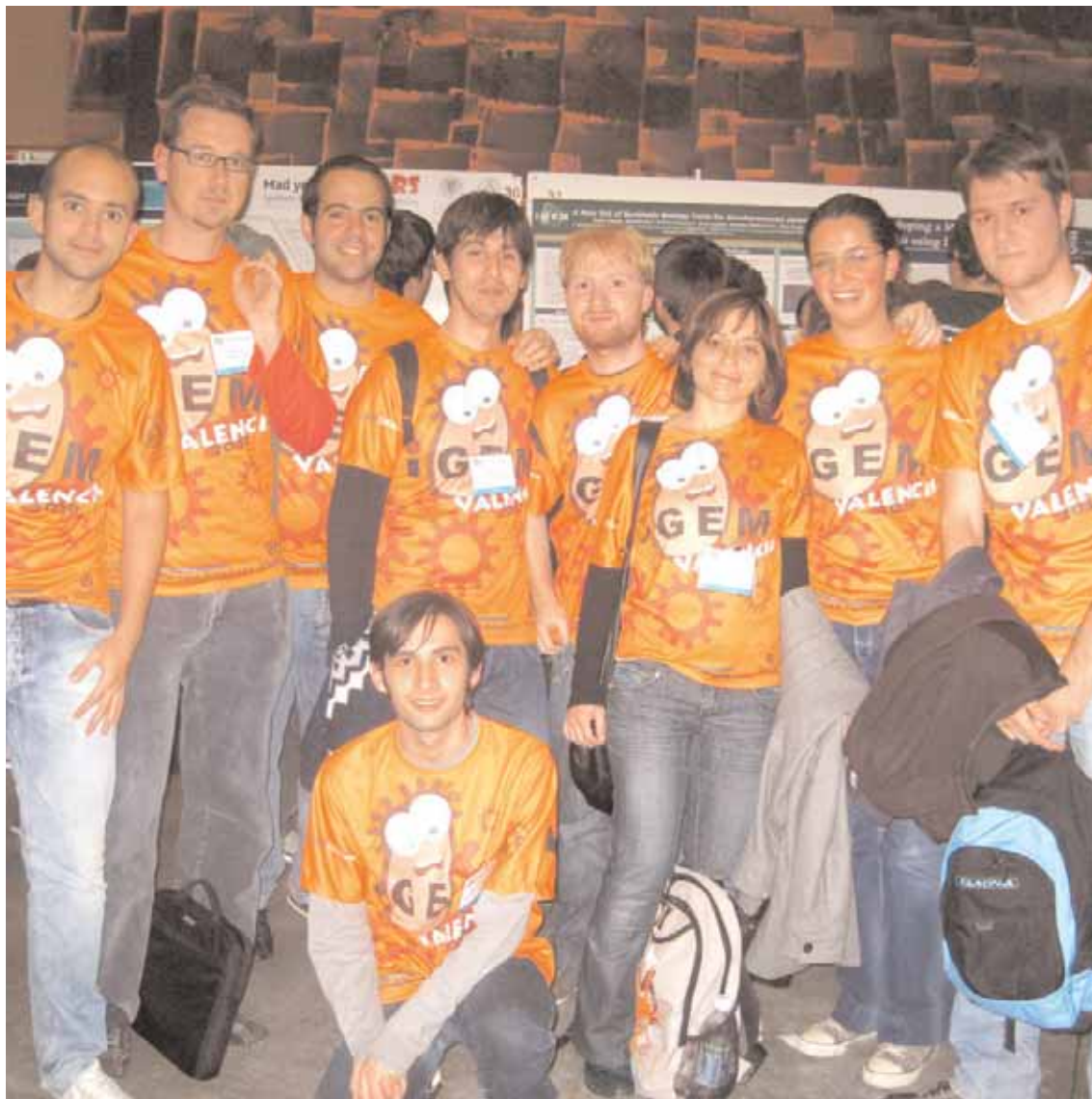
Els estudiants valencians premiats en el certamen celebrat a Boston.

Aquesta trajectòria marcada pels èxits ha propiciat que la biologia