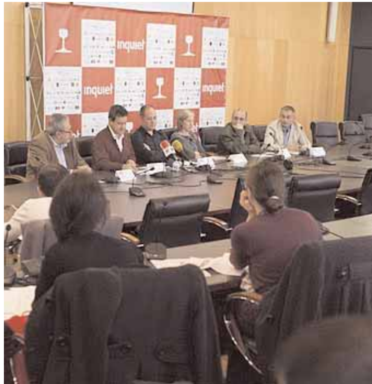
Un moment de la presentació del festival.

El programa del festival es desenvoluparà fins el 27 de novembre. Du-