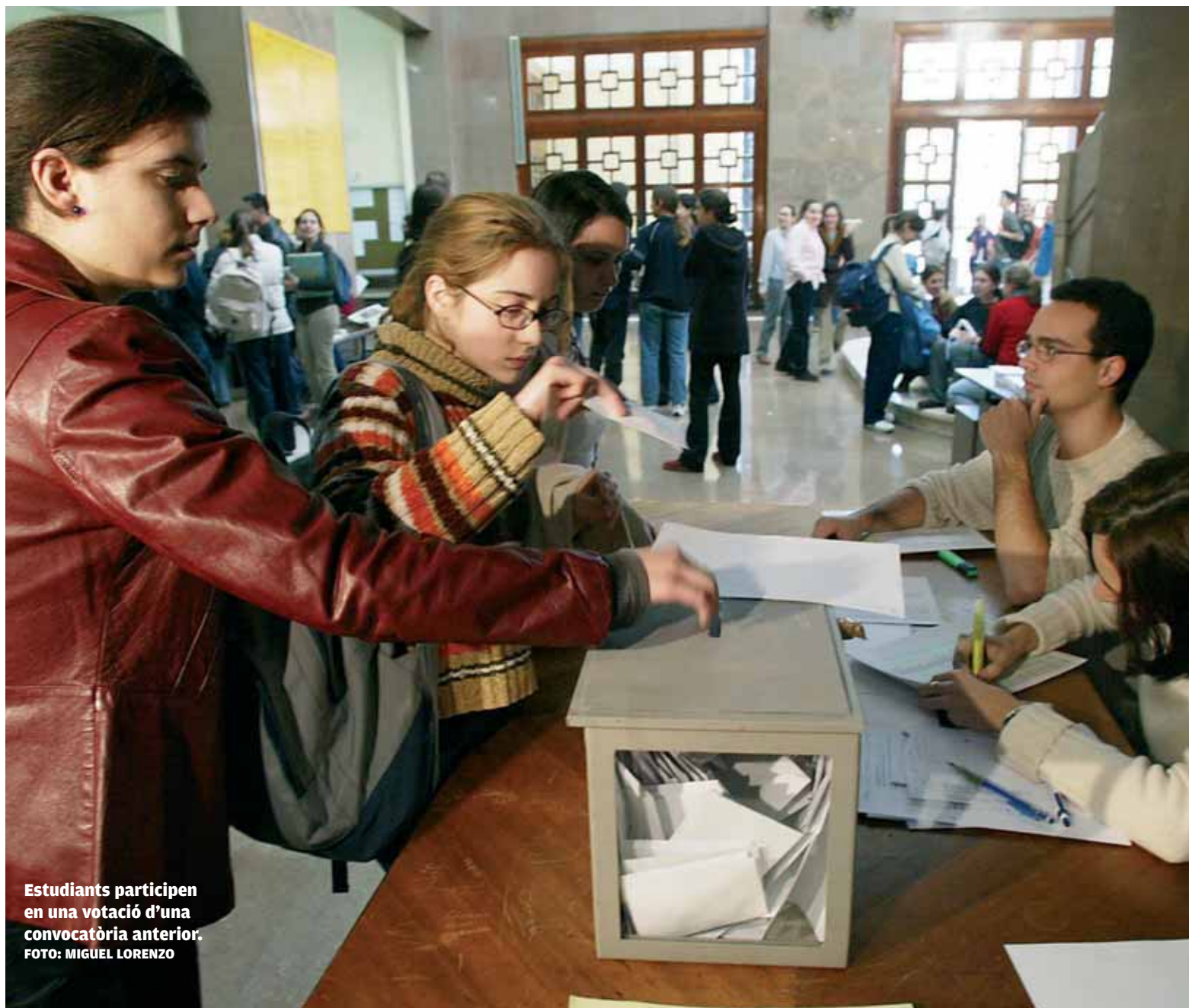
Estudiants participen en una votació d'una convocatòria anterior.

Un total de 50.021 estudiants (segons el cens provisional) estan citats amb les urnes el proper dijous (25 de novembre). Hauran de triar els seus representants al Claustre, el màxim òrgan de representació de la Universitat. Les votacions se celebraran en tots els centres de la institució i el termini per a la presentació de les candidatures va concloure aquest dimarts, dia 16. Els estudiants tenen 75 representants al Claustre, que es compon d'un total de 300 escons. Economia tornarà a triar el major nombre d'estudiants.