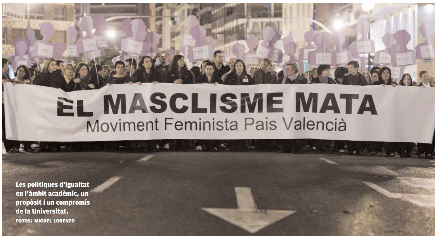
Les polítiques d'igualtat en l'àmbit acadèmic, un propòsit i un compromís de la Universitat.