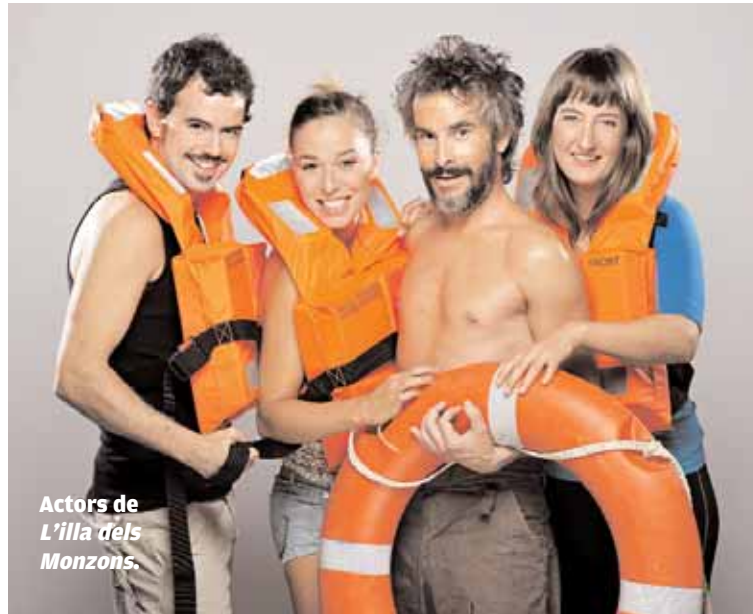
Actors de L'illa dels Monzons .

En L'illa dels Monzons un naufrag espera, debades, que el rescaten. Un grup de naturistes il·luminats hi desembarca amb ànsies de refundar el món i fugir dels fums i les enveges de la civilització occidental. Per l'illa desfila una galeria de prínceps blaus fracassats, parelles que s'esfondren, gripaus encantats, gnoms de la sort i conductors amb tics psicòtics, tots amb els seus desitjos i les seues frustracions, tots il·luminats amb un humor sarcàstic i tendre, irònic i surrealista.