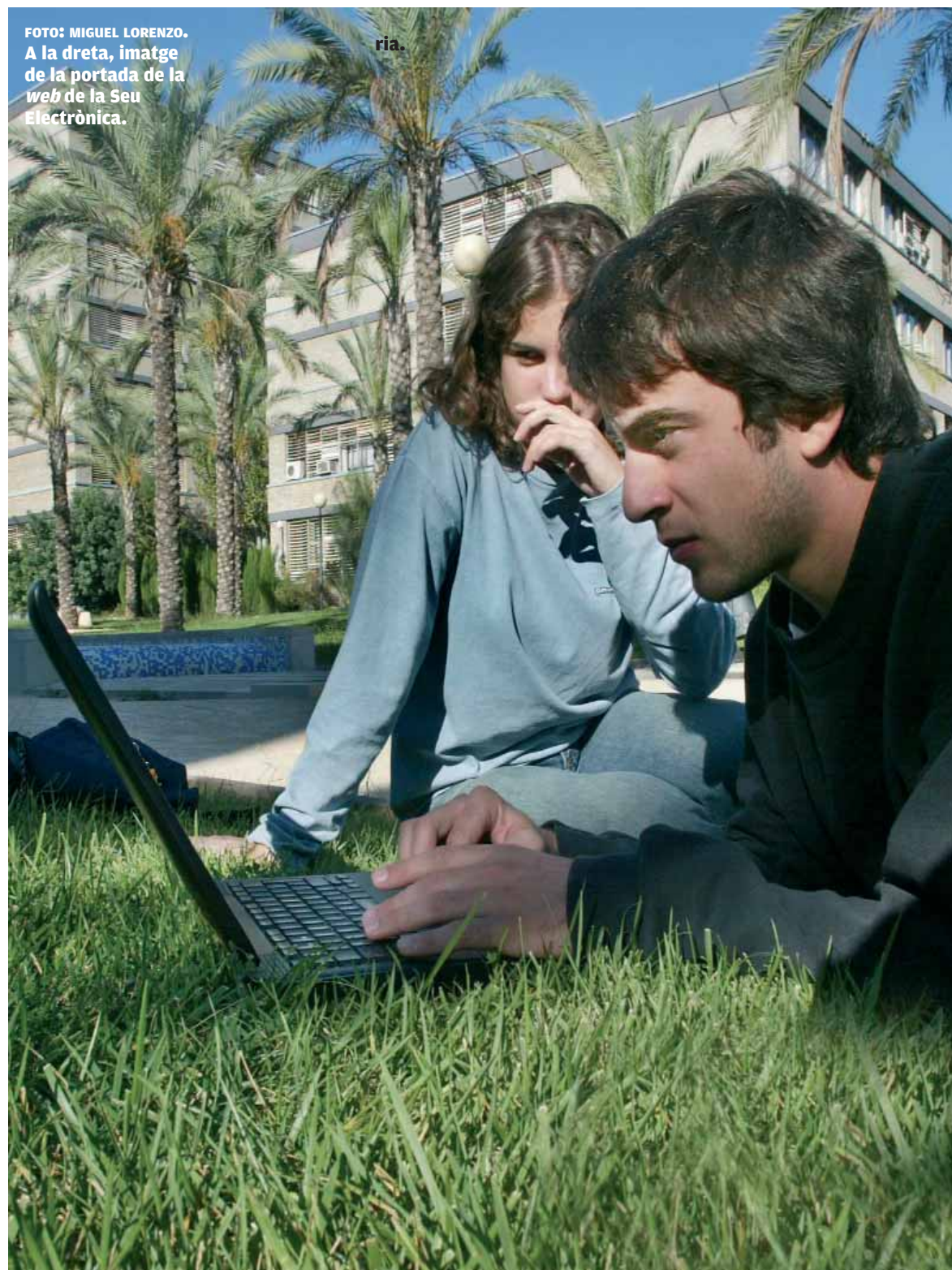
FOTO: MIGUEL LORENZO. A la dreta, imatge de la portada de la web de la Seu Electrònica.

SEU ELECTRÒNICA. En l'adreça entreu.uv.es es poden fer gestions sense necessitat de desplaçar-se