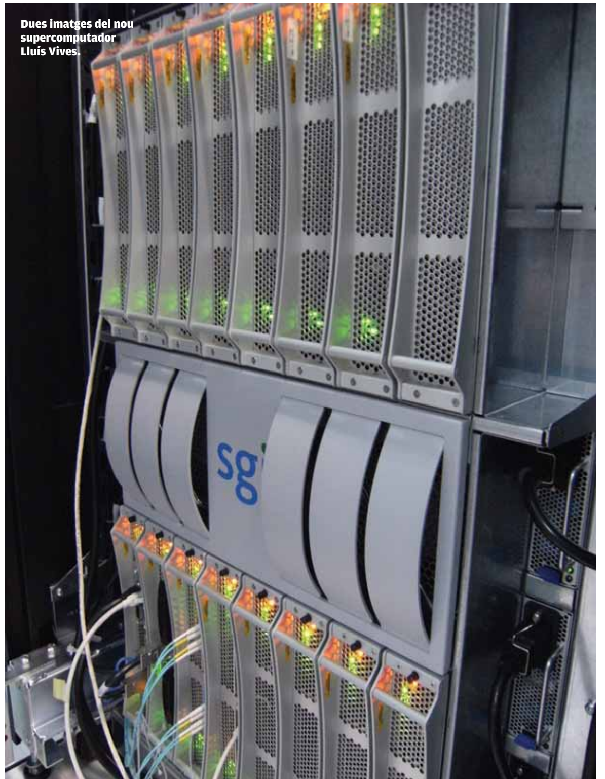
Dues imatges del nou supercomputador Lluís Vives.

La Universitat de València va començar la seua carrera en matèria de supercomputació en els anys noranta amb un mainframe d'IBM que posteriorment es va destinar a tasques de gestió. El 2003 es va adquirir el primer equip SGI, el Cesar, que ara s'ha substituït pel Lluís Vives. A pesar que s'acaba d'estrenar, ja es contempla una possible ampliació del supercomputador. El 2006 la Universitat va adquirir un clúster d'equips HP, amb accés a 16 Gb de