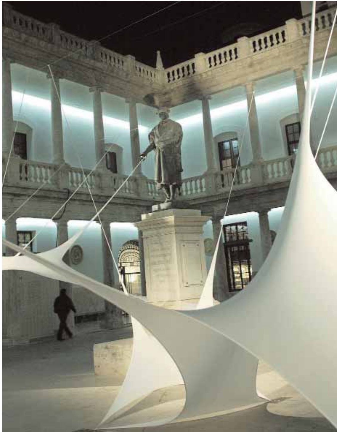
La Nau serà un dels espais que apagaran les llums durant l'Hora del Planeta.