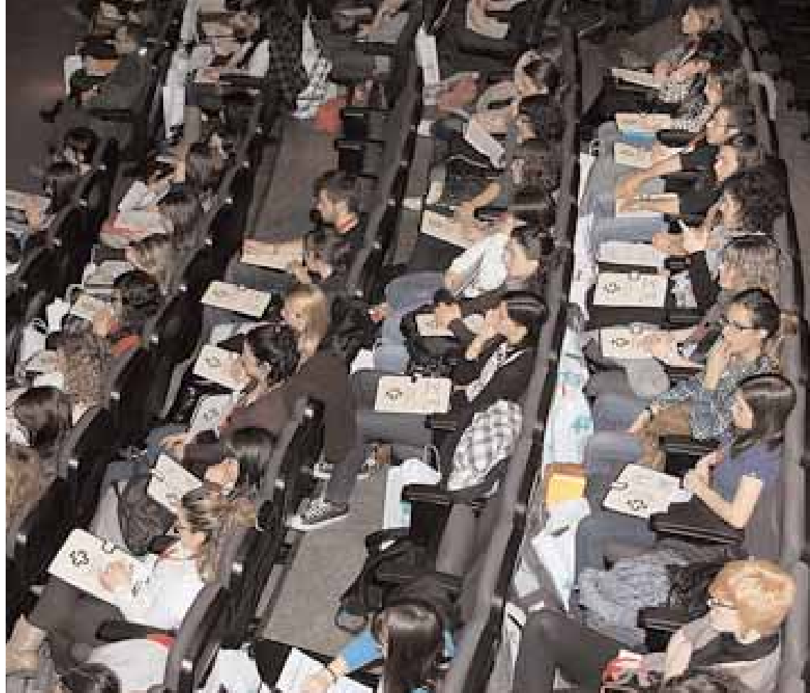
Més de tres-cents estudiants han assistit a les jornades, celebrades al Campus de Burjassot-Paterna.

IMATGE DEL FARMACÈUTIC ENTRE LA POBLACIÓ. Una vegada fi-