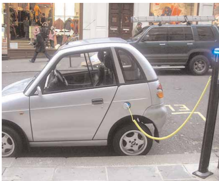
El cotxe elèctric podria ser el vehicle del futur.

També està previst el desenvolupament de la infraestructura de càrrega a llocs de treball i centres comercials, en el qual s'estimen temps de càrrega d'unes tres o quatre hores ( Shop &