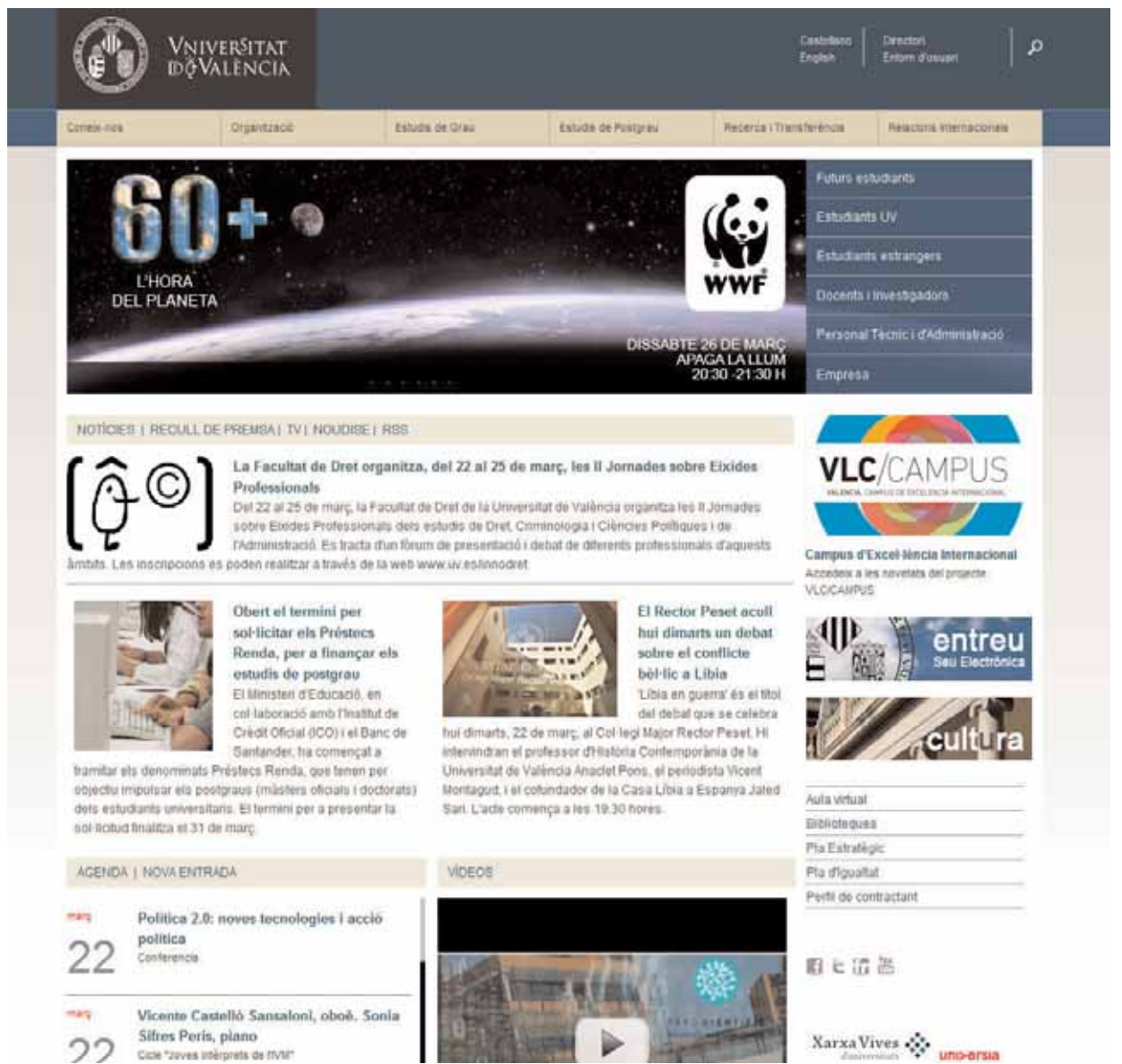
Una imatge de la pàgina d'inici de la web de la Universitat de València.